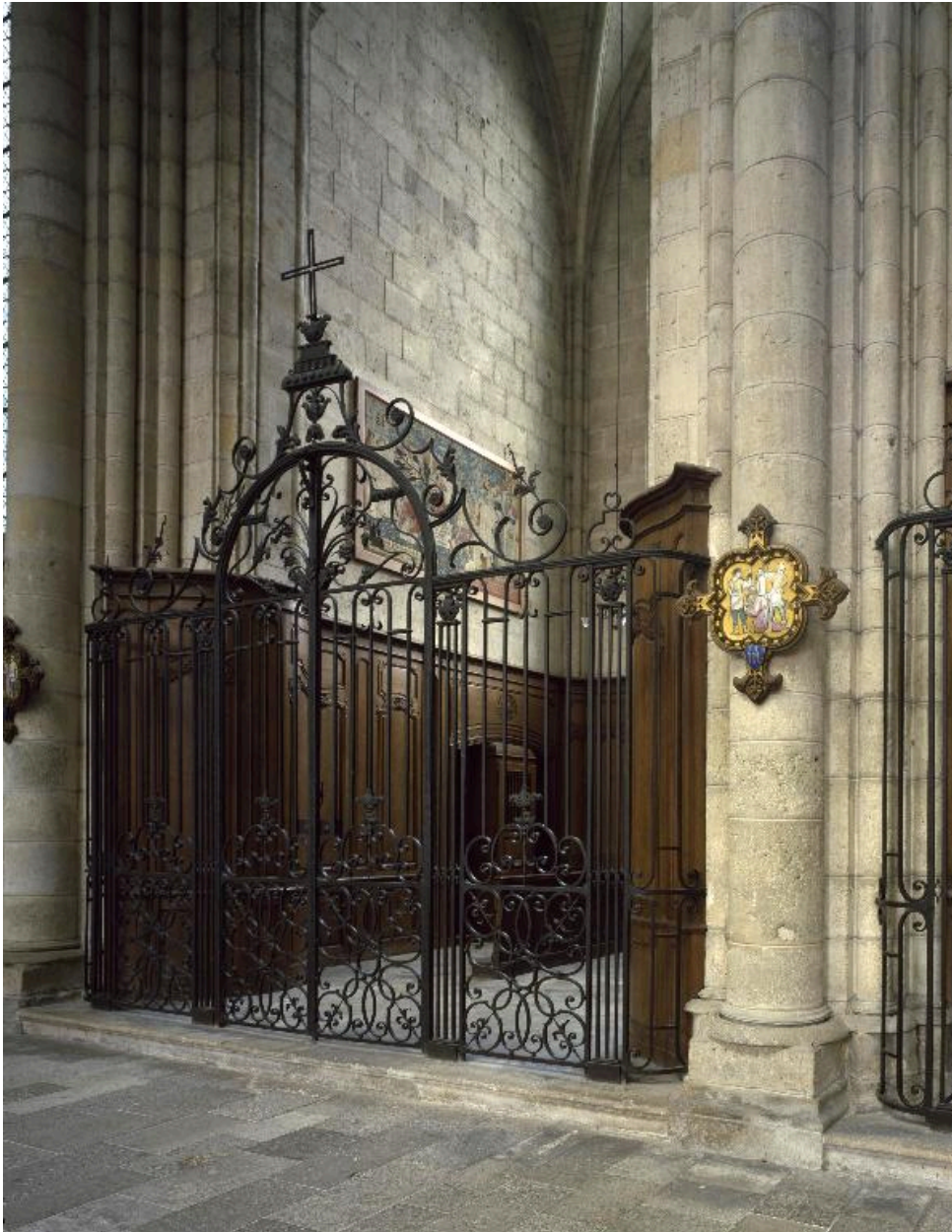
Entrée de la première chapelle nord de la nef.