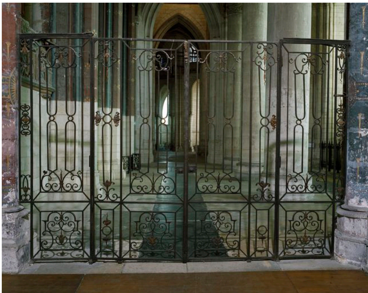
Vue partielle de la grille séparant le grand transept du collatéral sud du choeur.