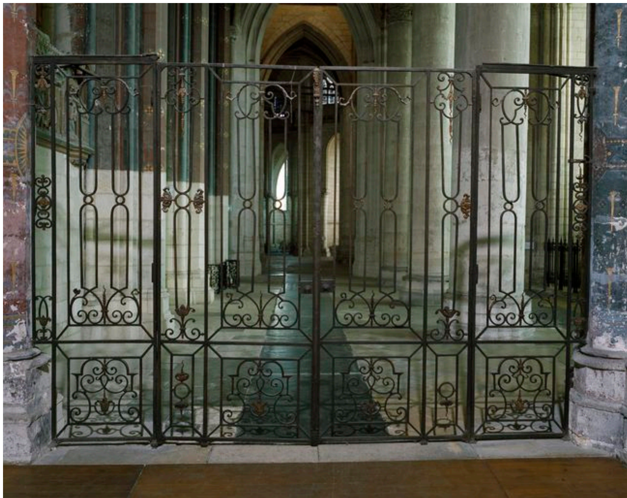
Vue partielle de la grille séparant le grand transept du collatéral sud du chœur.