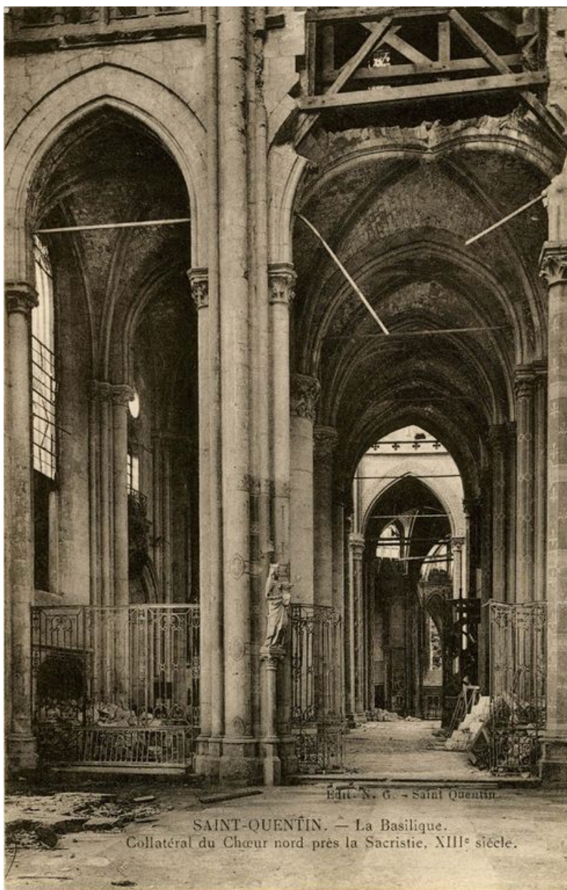
Carte postale éditée vers 1920, montrant la clôture à l'entrée du collatéral nord du choeur.