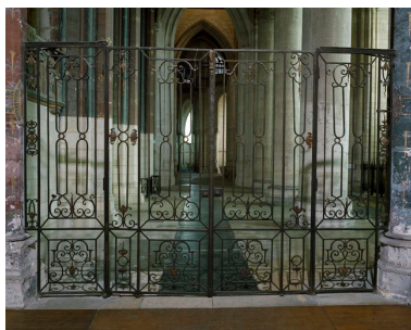
Vue partielle de la grille séparant le grand transept du collatéral sud du chœur. IVR22_20100200280VA