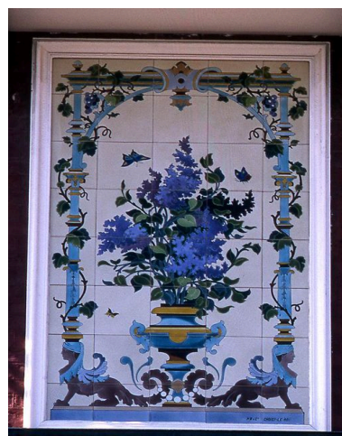
Détail du panneau de céramique de la maison Les Lilas. IVR22_20058001766XA