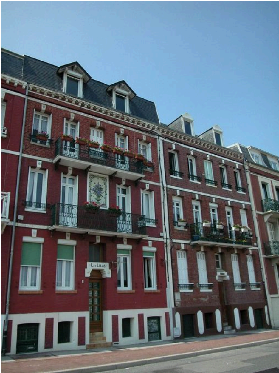
Les Lilas et Tatiana, vue d'ensemble.