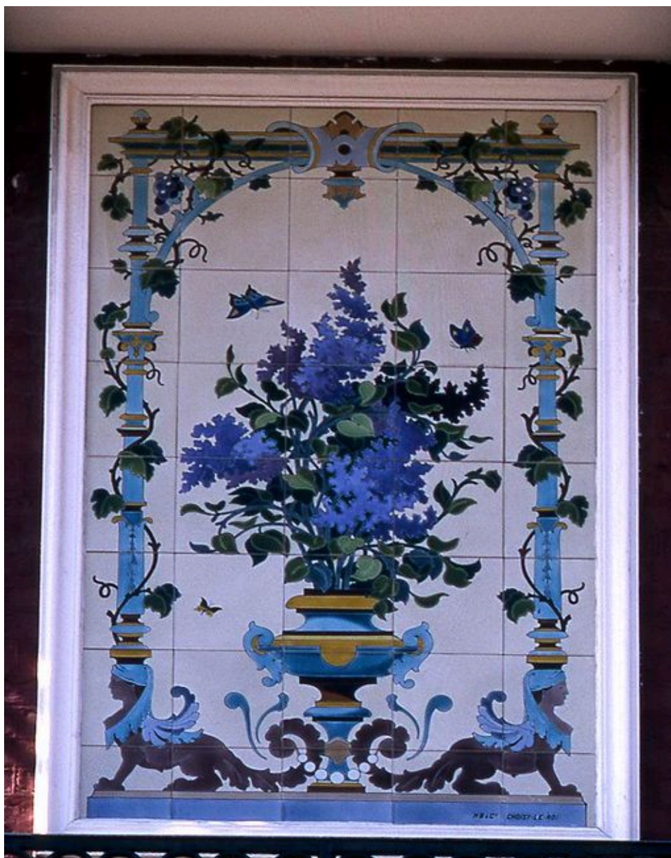
Détail du panneau de céramique de la maison Les Lilas.