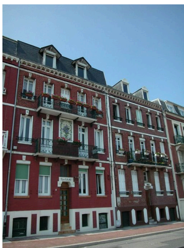
Les Lilas et Tatiana, vue d'ensemble. IVR22_20058003156NUCA