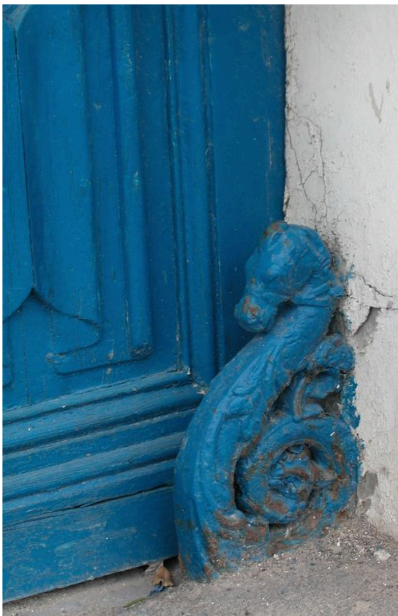
Détail du chasse-roue d'une des portes cochères.