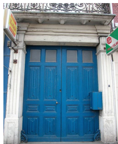
Détail d'une des portes cochères, avec motif de plis de serviette.