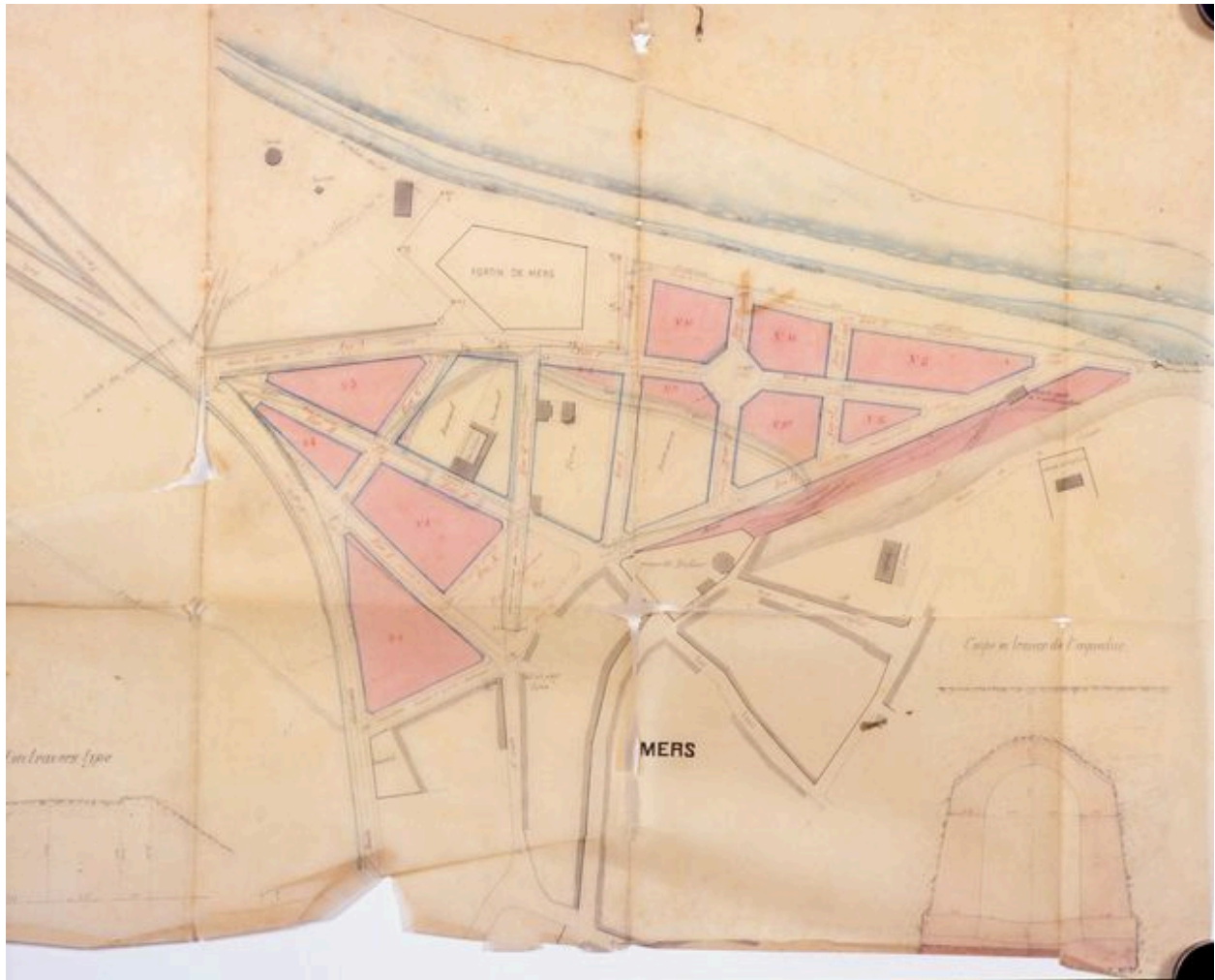
Plan annexé au procès verbal de la conférence ouverte le 23 juillet 1873 sur le projet de lotissement (sic) des terrains communaux de Mers situés près de la batterie établie sur la côte, par Geoffroy ingénieur des Ponts et Chaussées, 1873 (AD Somme ; 99 O 2590).