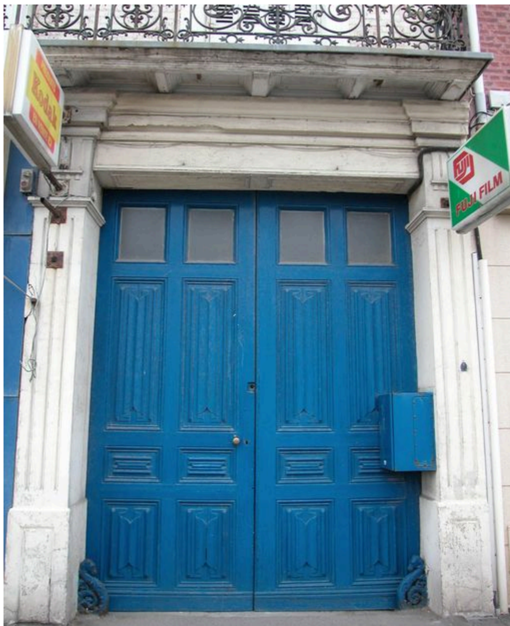
Détail d'une des portes cochères, avec motif de plis de serviette.