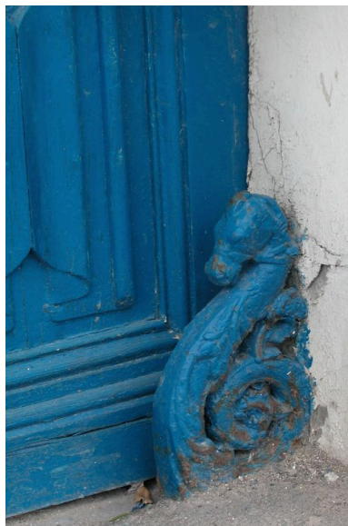
Détail du chasse-roue d'une des portes cochères. IVR22_20048001391NUCA