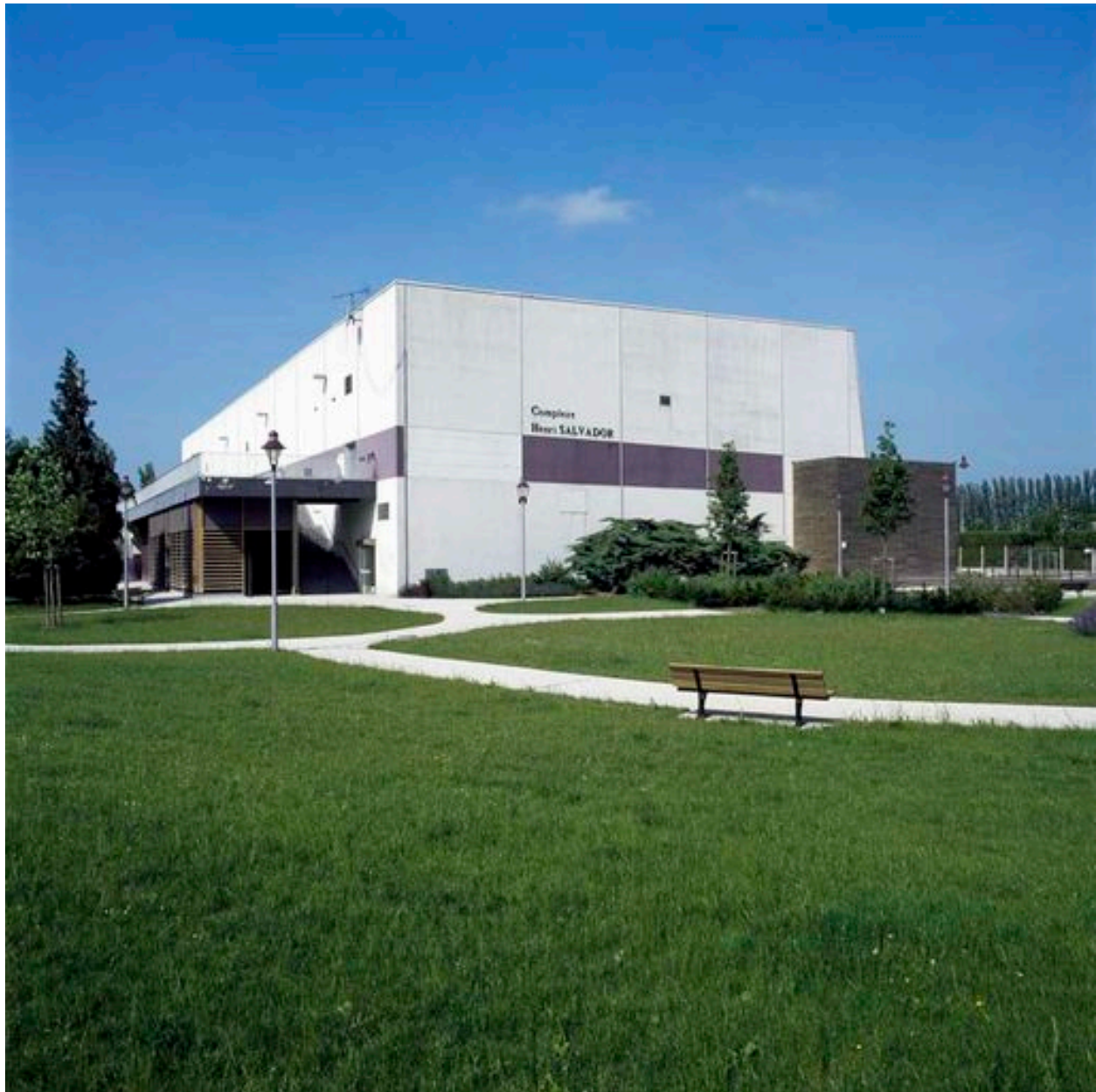
Façades sud-est du complexe sportif.