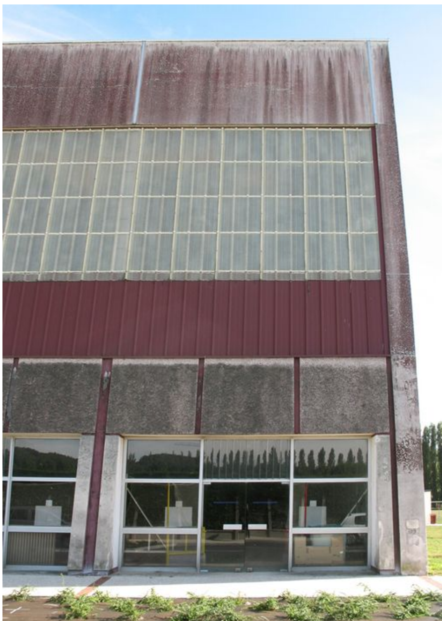
Détail d'une travée de la façade nord.