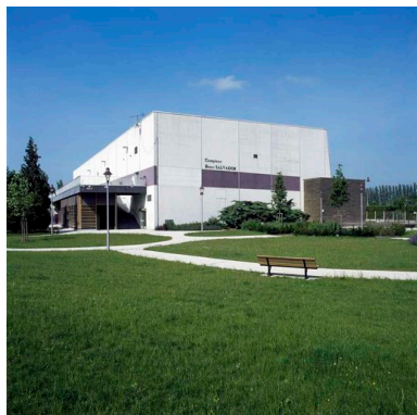
Façades sud-est du complexe sportif.

IVR22_20106000426VA