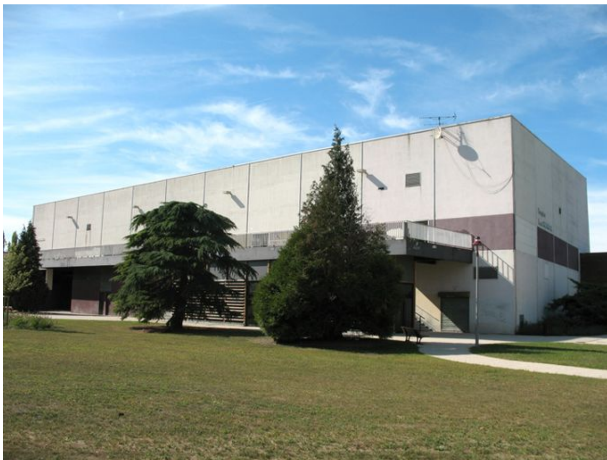
Façade ouest du gymnase.