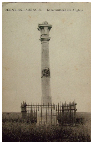
Vue de l'édifice au moment de son érection (coll. part).