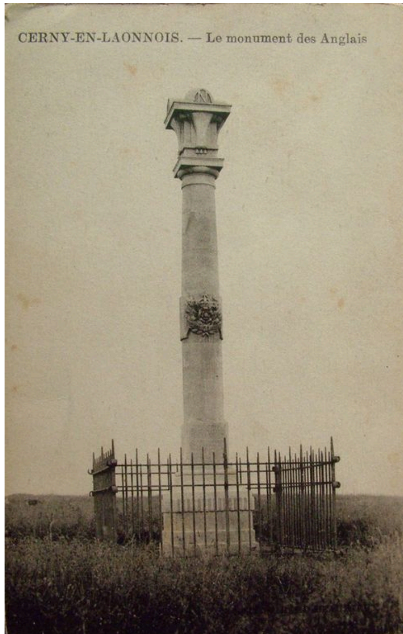
Vue de l'édifice au moment de son érection (coll. part).