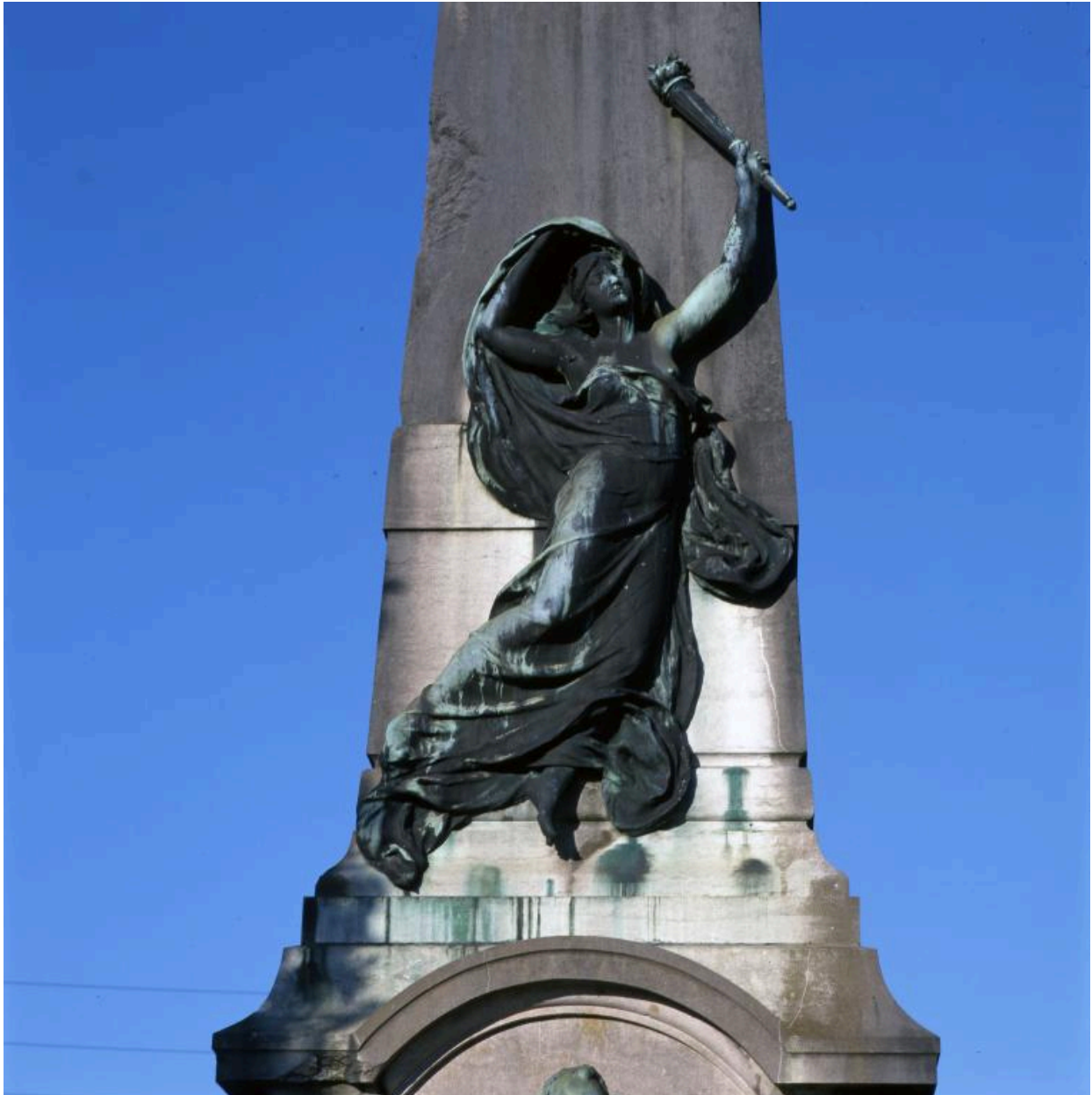
Vue de la figure qui domine la face antérieure du monument.