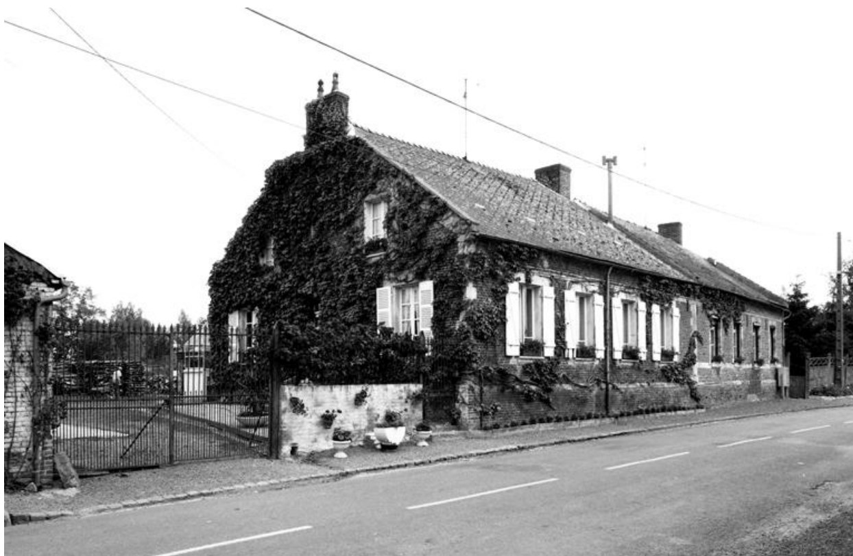
Vue d'ensemble du logis, depuis le sud-ouest.