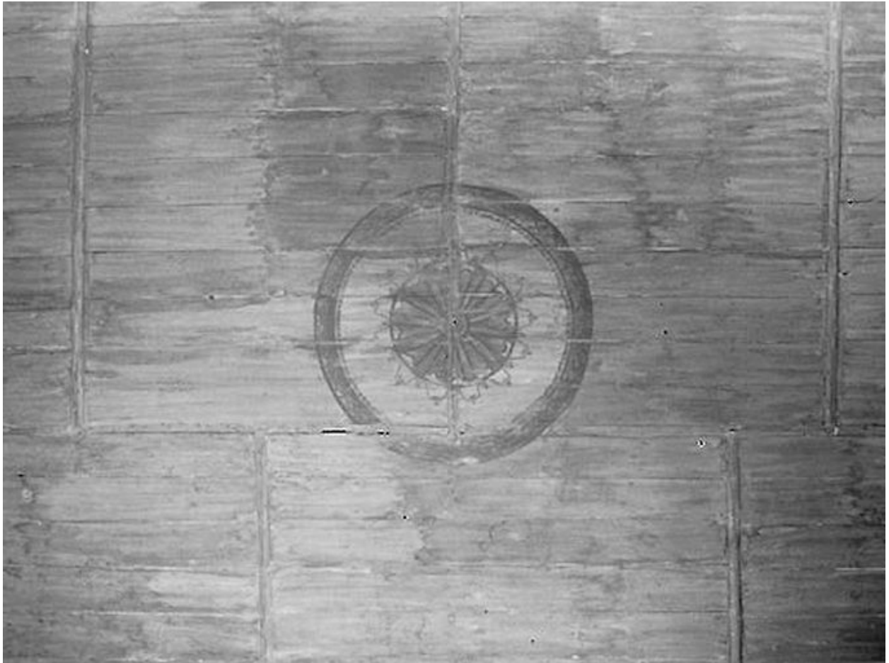
Détail du plafond peint du choeur.