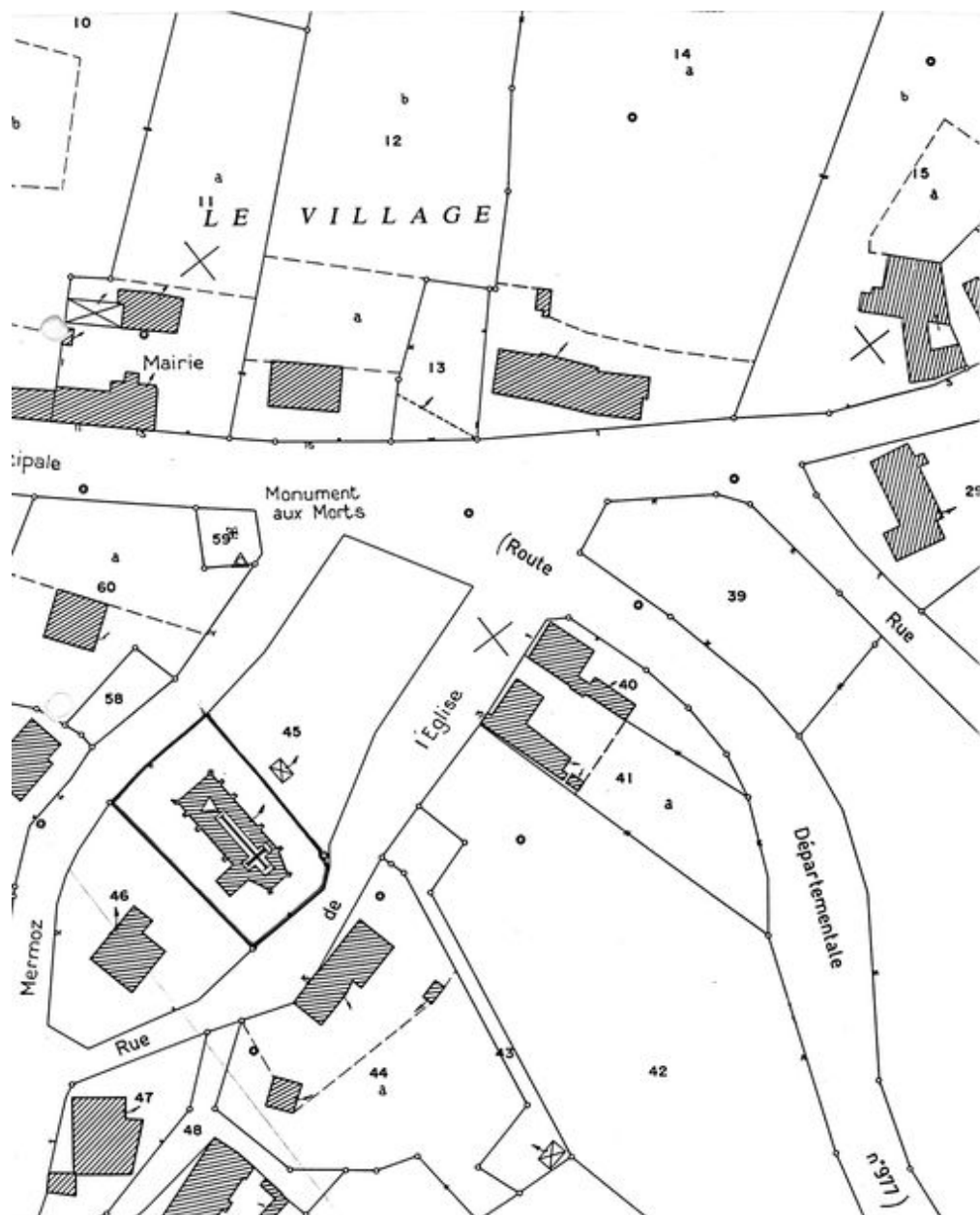
Plan de situation. Extrait du plan cadastral de 1986, section ZA.