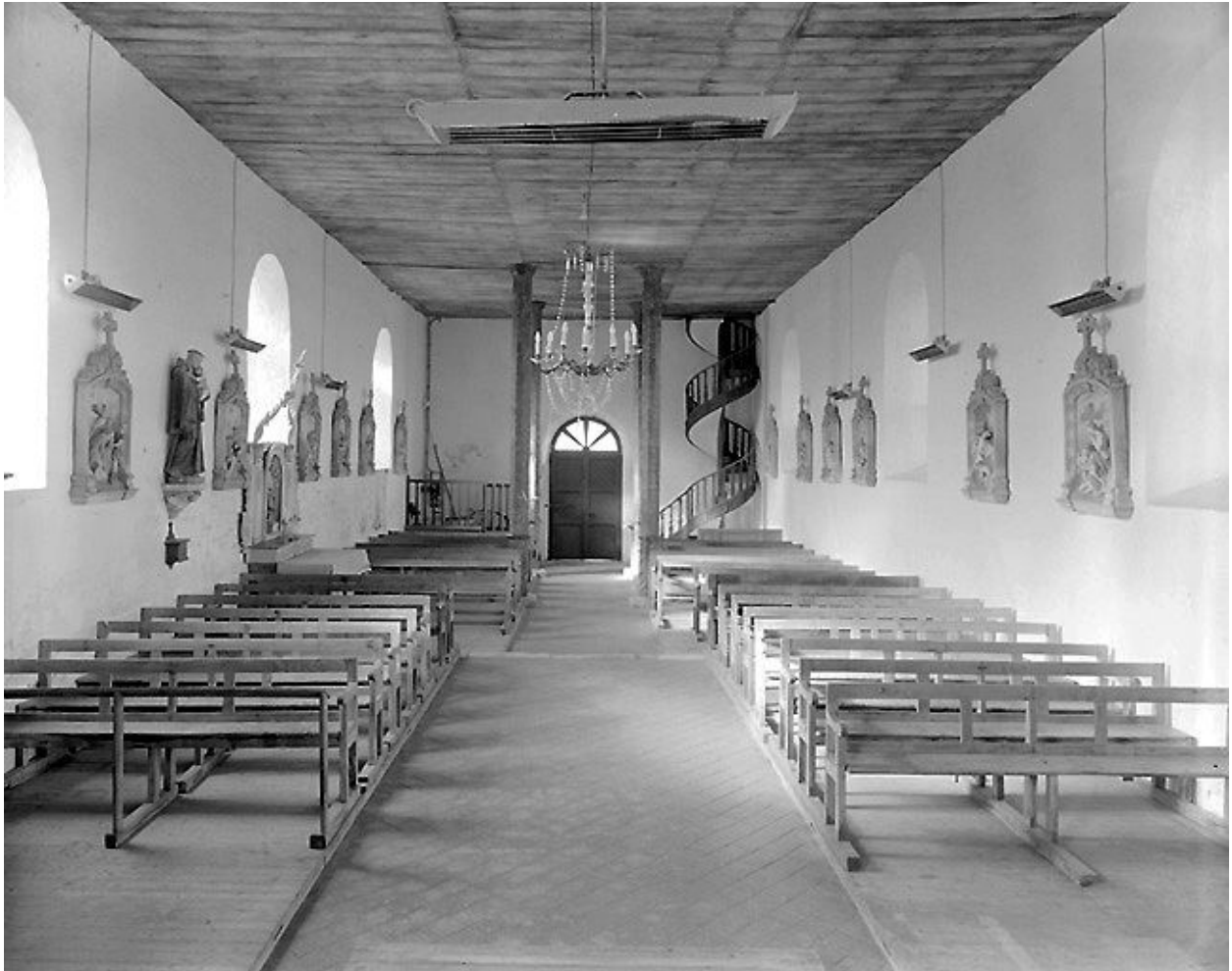
Vue intérieure du choeur vers la nef.