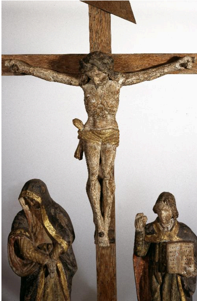
Vue de détail : le Christ.