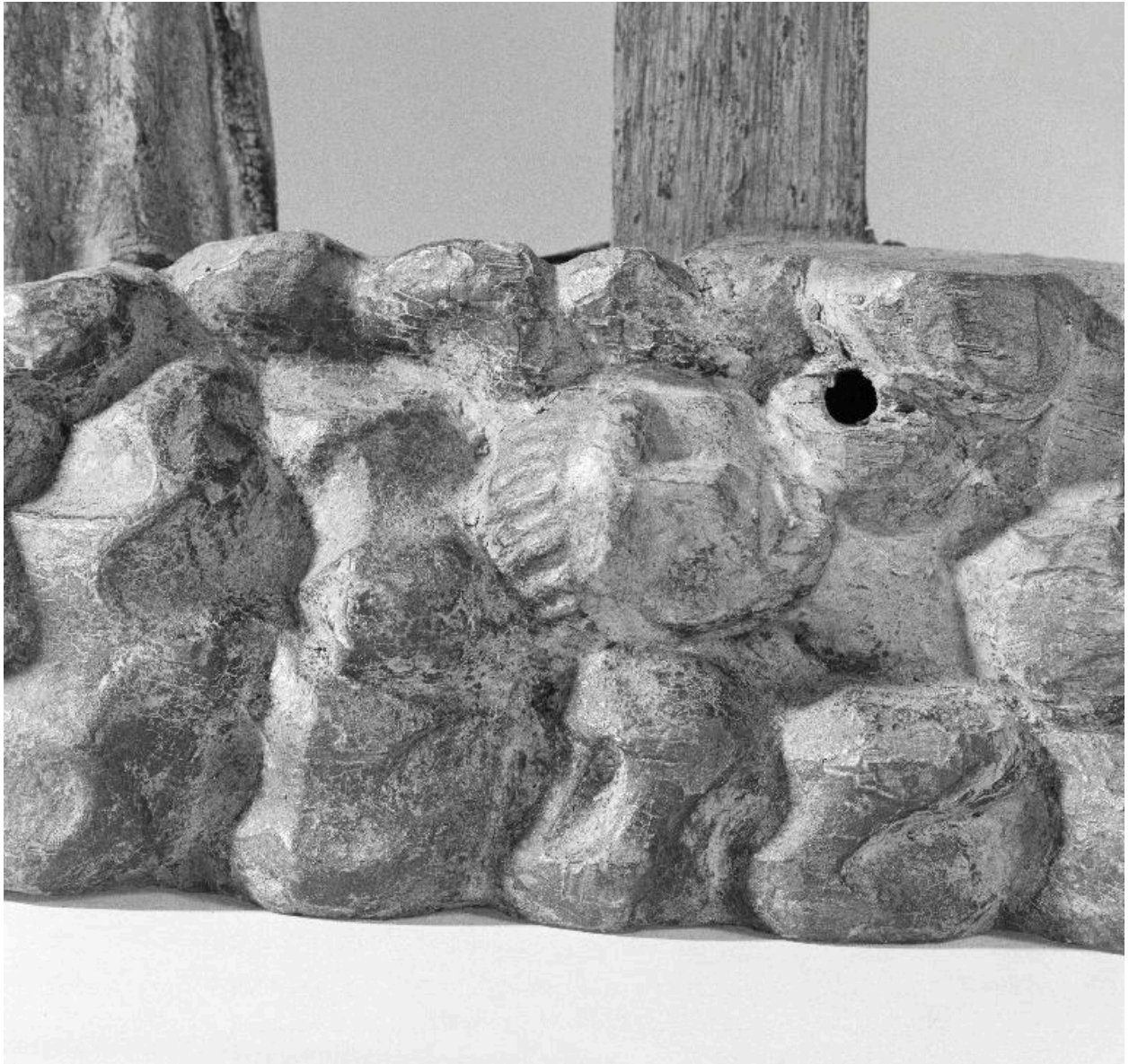
Détail du socle : la tête d'Adam.