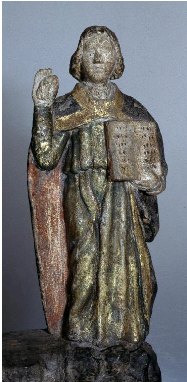
Vue de détail : saint Jean.