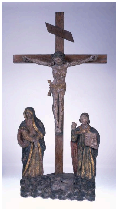
Vue d'ensemble. IVR22_19956000354XA