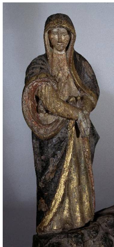
Vue de détail : la Vierge. IVR22_19956000357XA