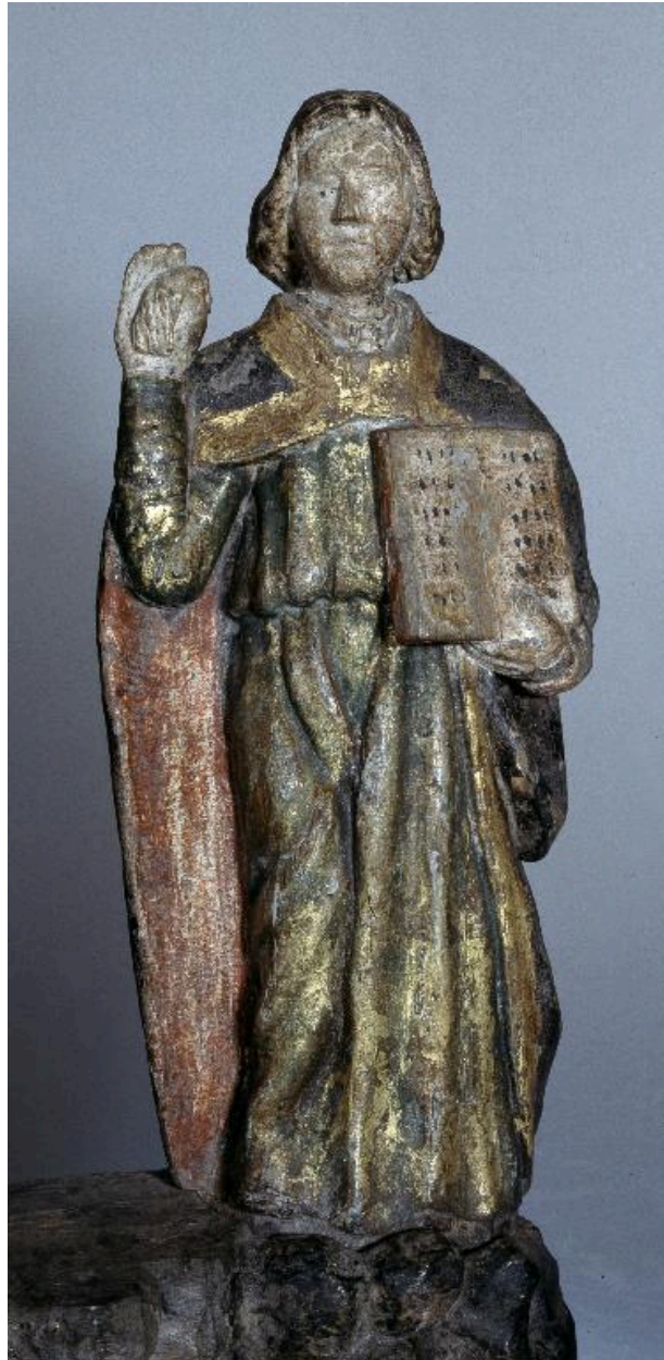
Vue de détail : saint Jean.