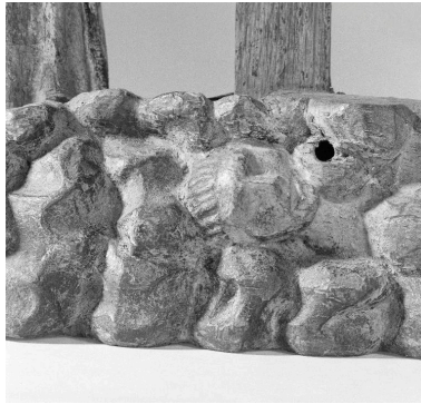
Détail du socle : la tête d'Adam.