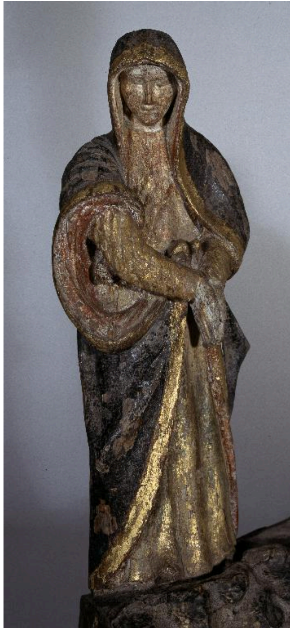
Vue de détail : la Vierge.