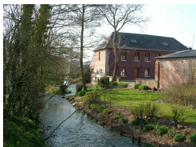
Vue générale des bâtiments de l'ancien moulin depuis la Nièvre.