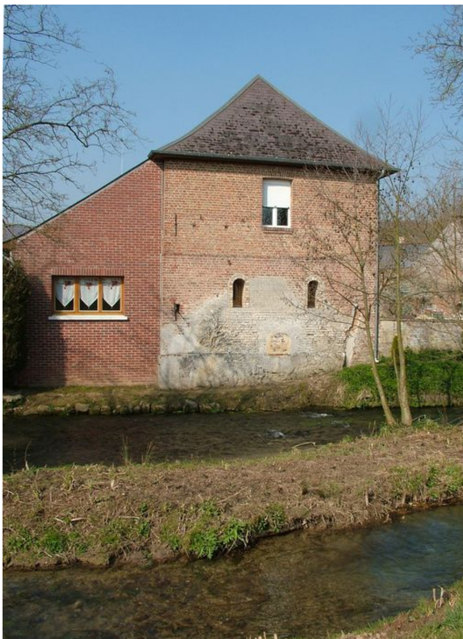
Mur de croupe de l'ancien moulin portant la trace de l'ancienne roue hydraulique.