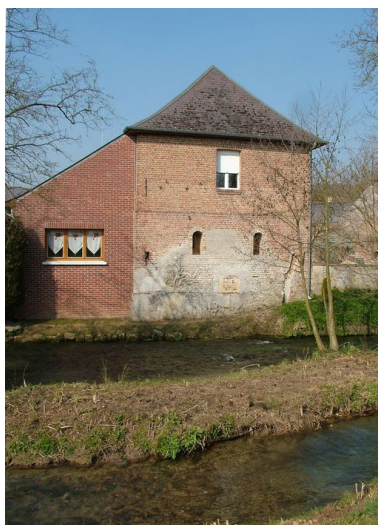
Mur de croupe de l'ancien moulin portant la trace de l'ancienne roue hydraulique. IVR22_20098005425NUCA