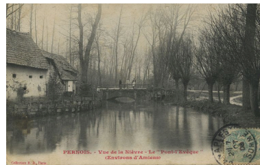
Vue de la Nièvre, du Pont- l'Évêque et des dépendances du moulin, avant 1906 (coll. part.). IVR22_20098000352NUCA