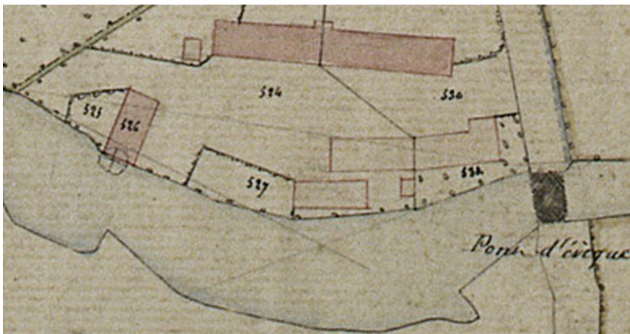
Extrait du cadastre napoléonien, section B, par Carette, 1832 (AD Somme ; 3 P 1447/4).