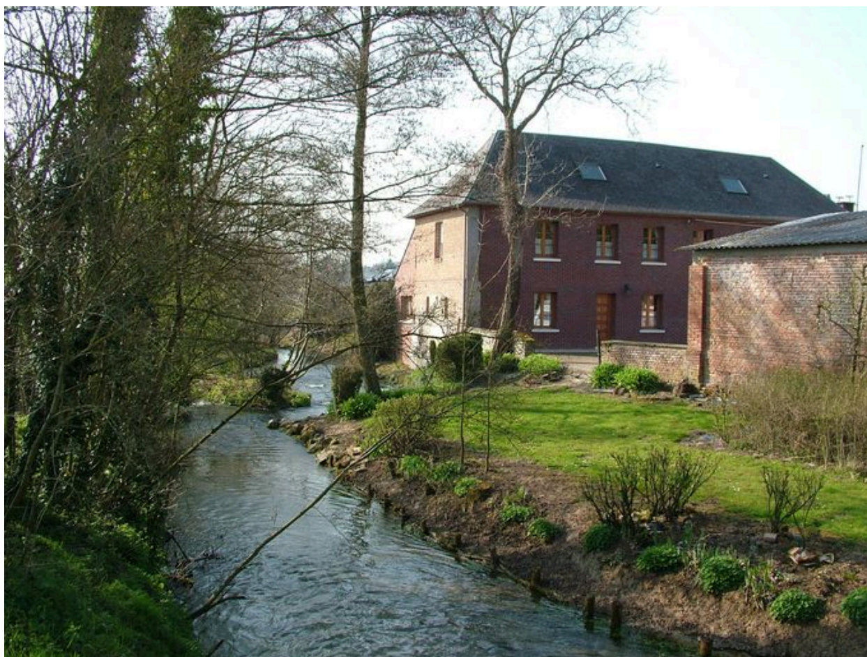
Vue générale des bâtiments de l'ancien moulin depuis la Nièvre.