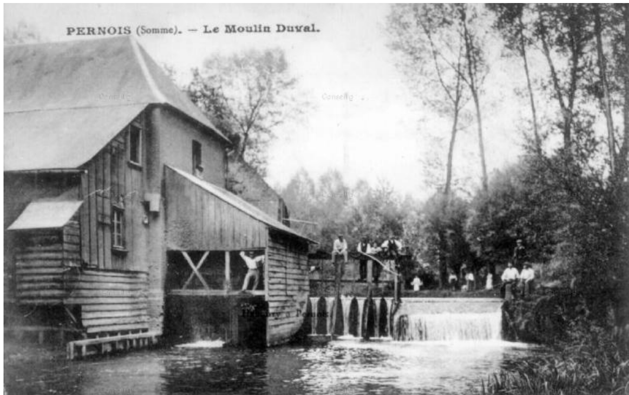
Le moulin et la chute d'eau, début du 20e siècle.