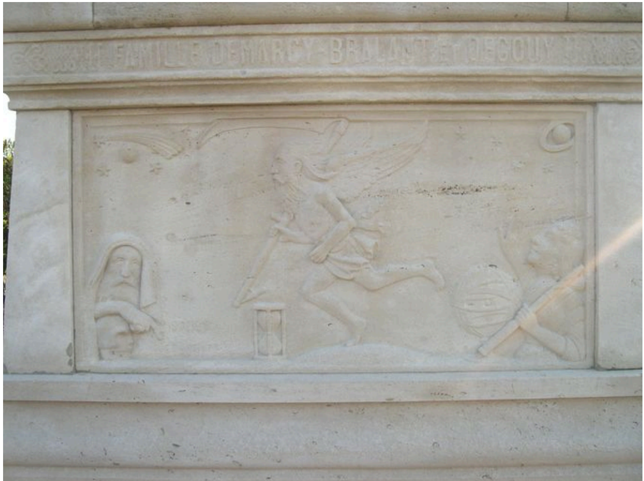
Vue de détail sur la face ouest.