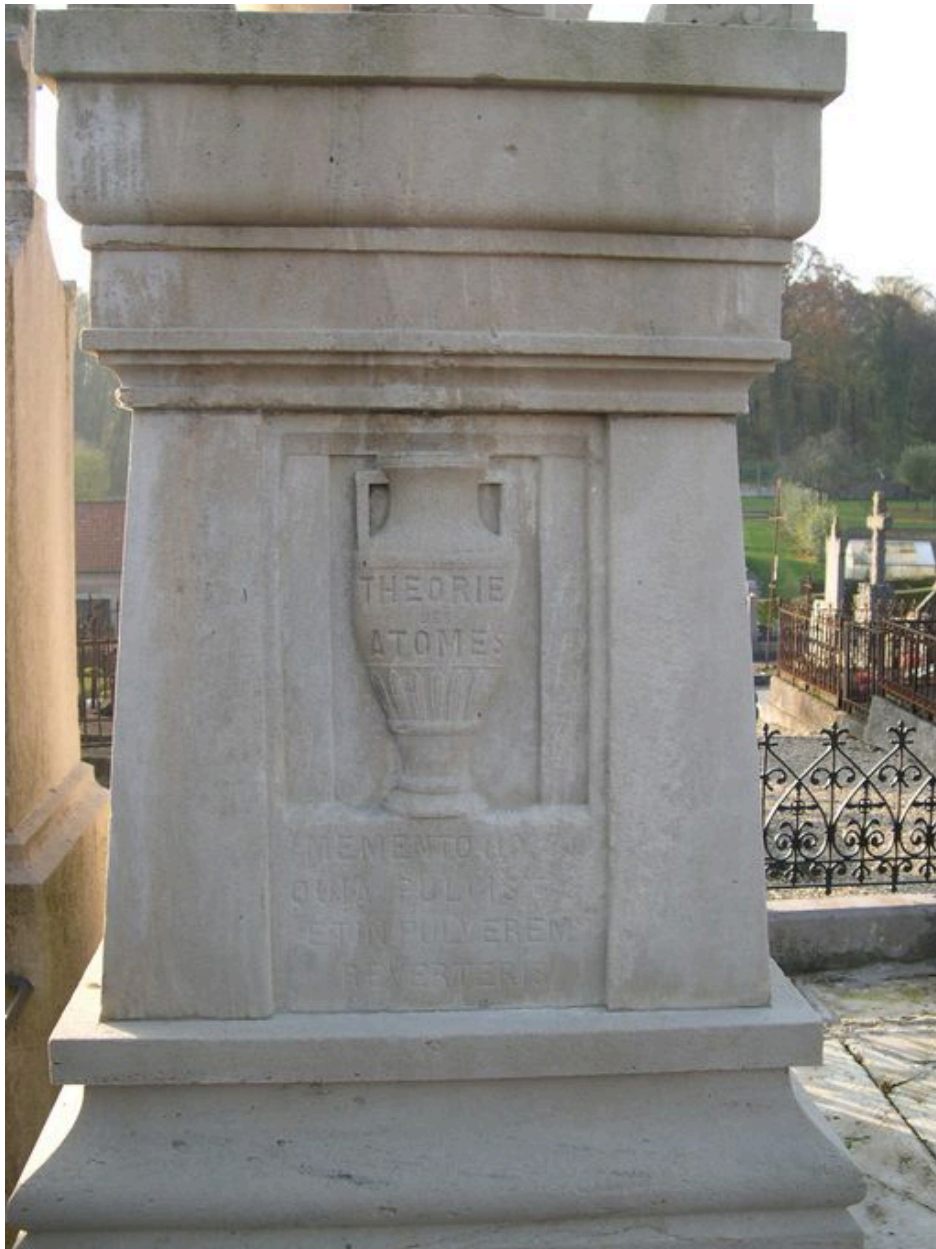
Vue de détail sur la face nord.