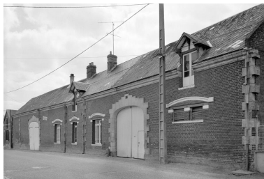
Elévation sur rue. IVR22_19856001016X