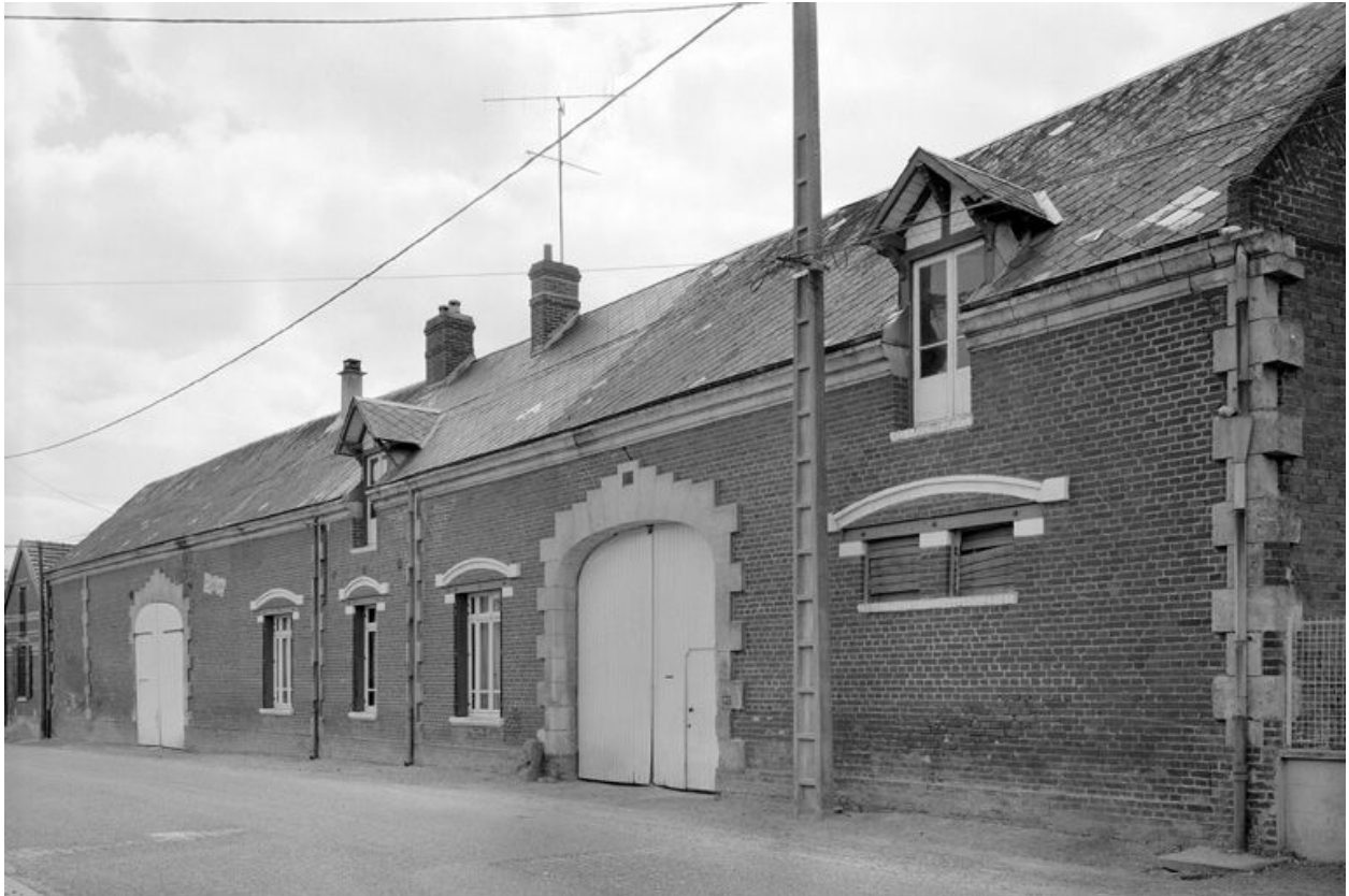
Elévation sur rue.