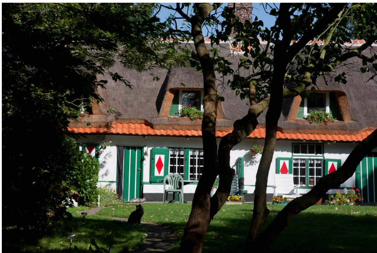
Détail façade sud depuis le jardin.