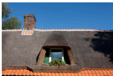
Lucarne ouvrant sur la toiture en chaume. IVR32_20115900722NUC4A