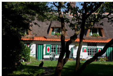
Détail façade sud depuis le jardin. IVR32_20115900724NUC4A