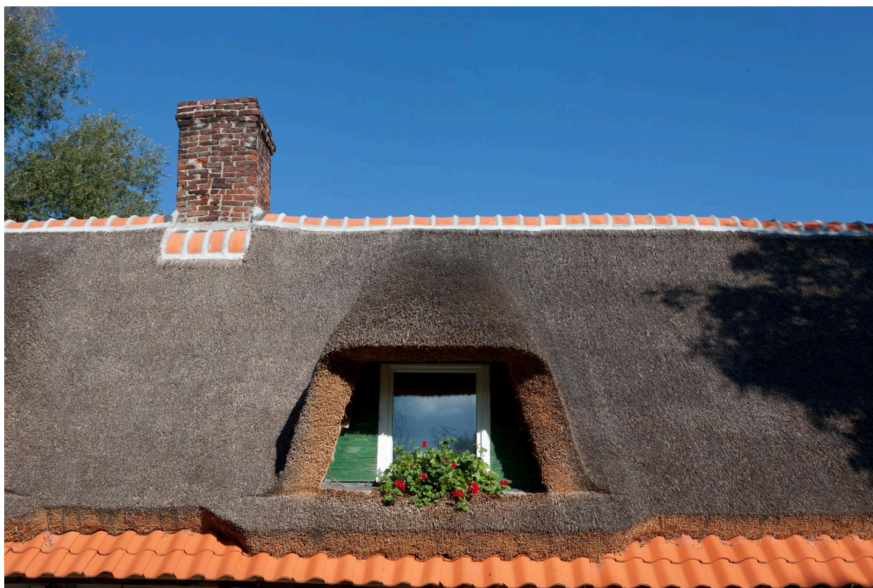
Lucarne ouvrant sur la toiture en chaume.