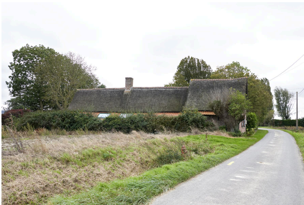
Chaumière dans son environnement direct.