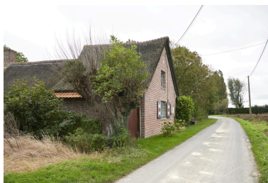
Détails du pignon ouest sur rue.