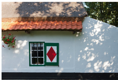
Détail de la façade sud. Fenêtre, chaume et tuiles. IVR32_20115900720NUC4A