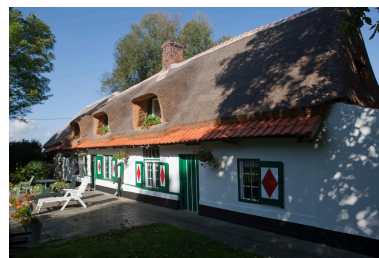
Façade sud vers le jardin. IVR32_20115900718NUC4A