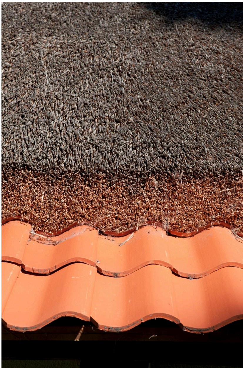
Détail de la toiture.