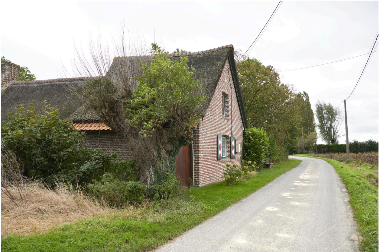
Détails du pignon ouest sur rue.