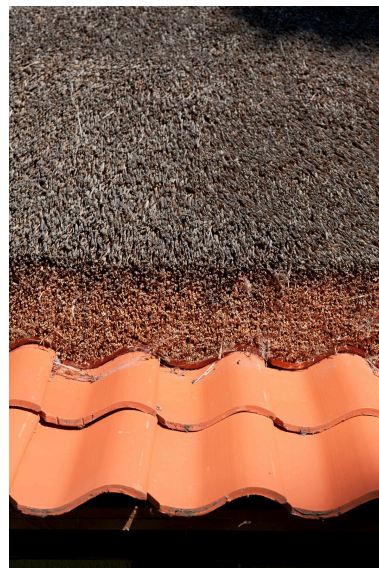
Détail de la toiture.