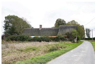
Chaumière dans son environnement direct. IVR32_20255900443NUCA