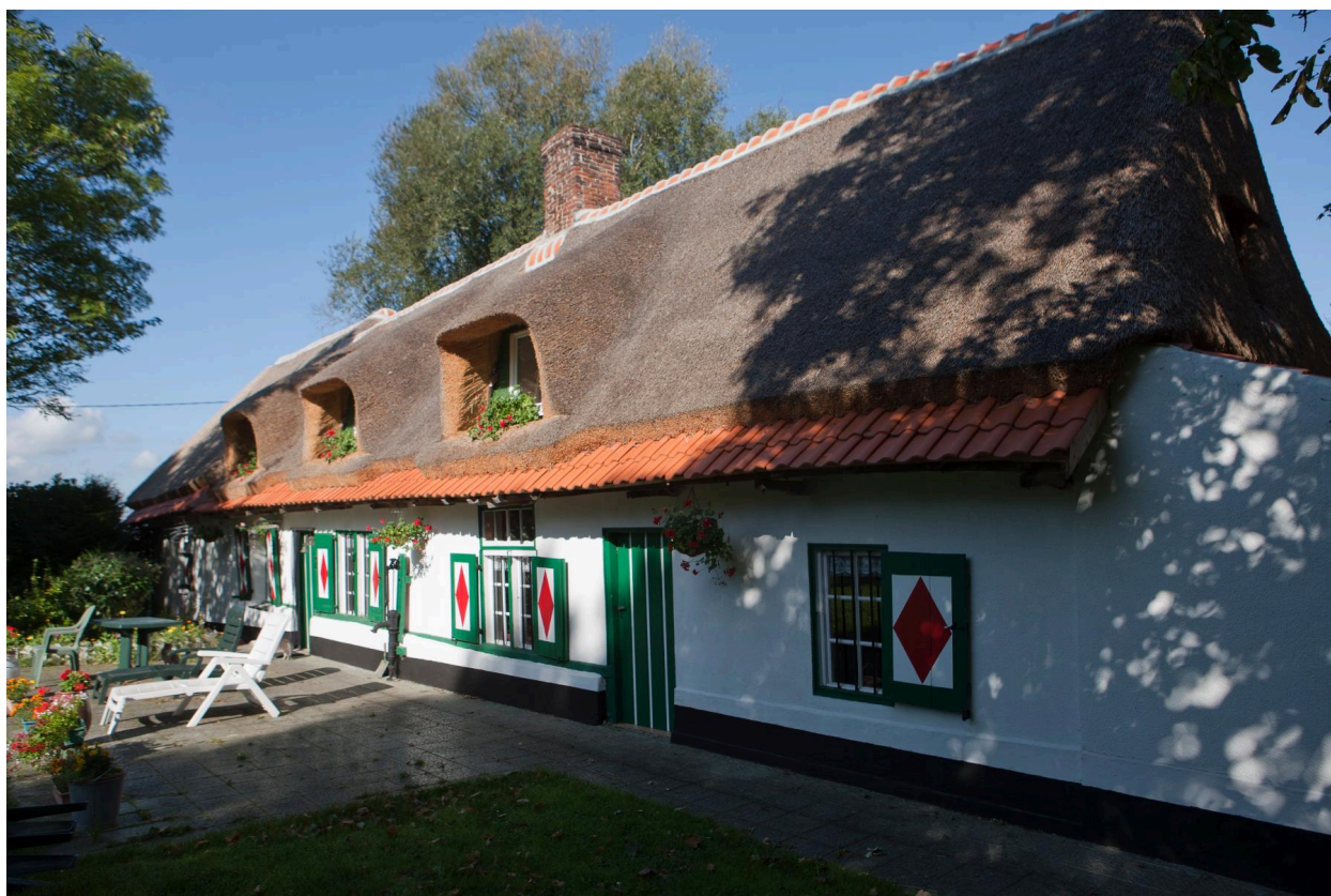
Façade sud vers le jardin.