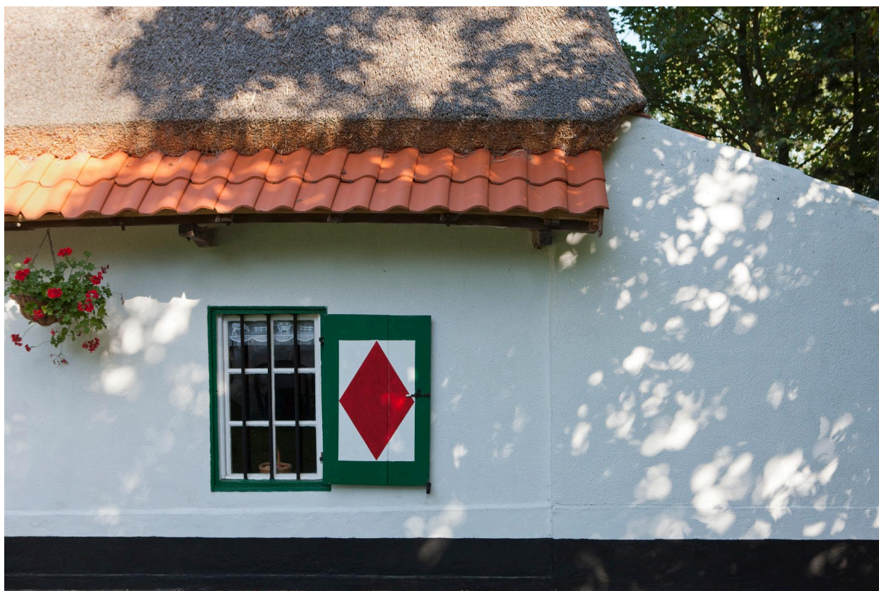
Détail de la façade sud. Fenêtre, chaume et tuiles.