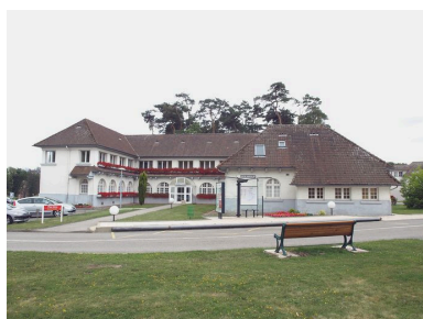
Bâtiments administratifs : architecture du début des années 1930