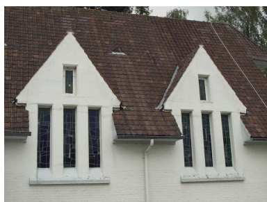
Chapelle : détail des fenêtres latérales IVR31_20106208252NUCA