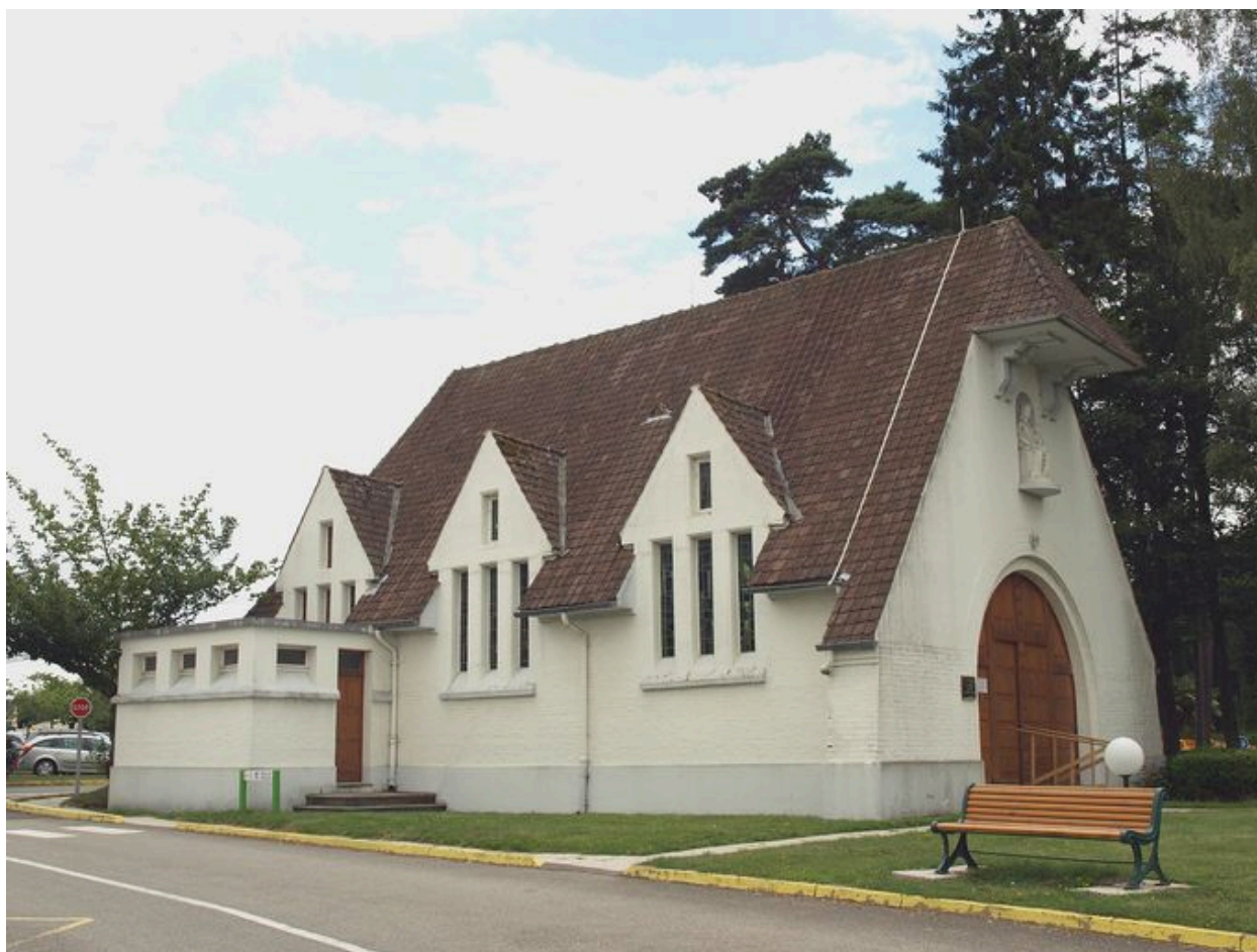
Chapelle, vue latérale