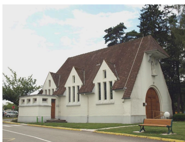
Chapelle, vue latérale IVR31_20106208251NUCA