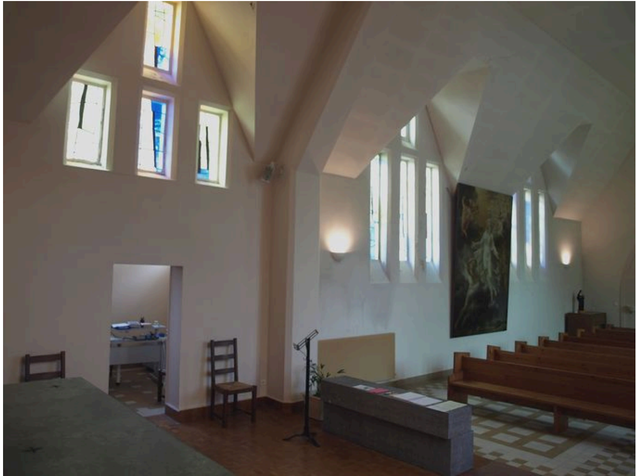
Chapelle : vue intérieure