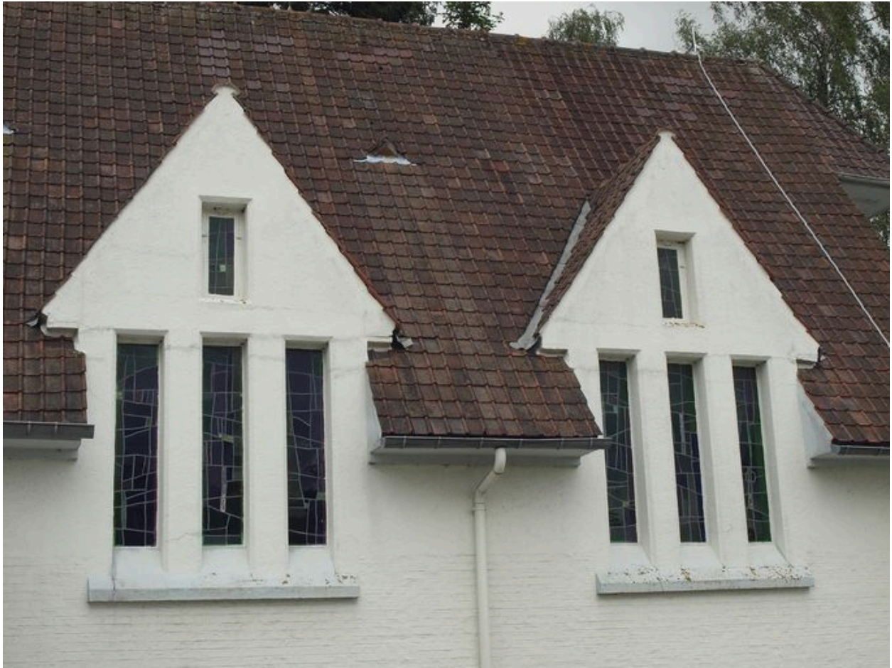
Chapelle : détail des fenêtres latérales