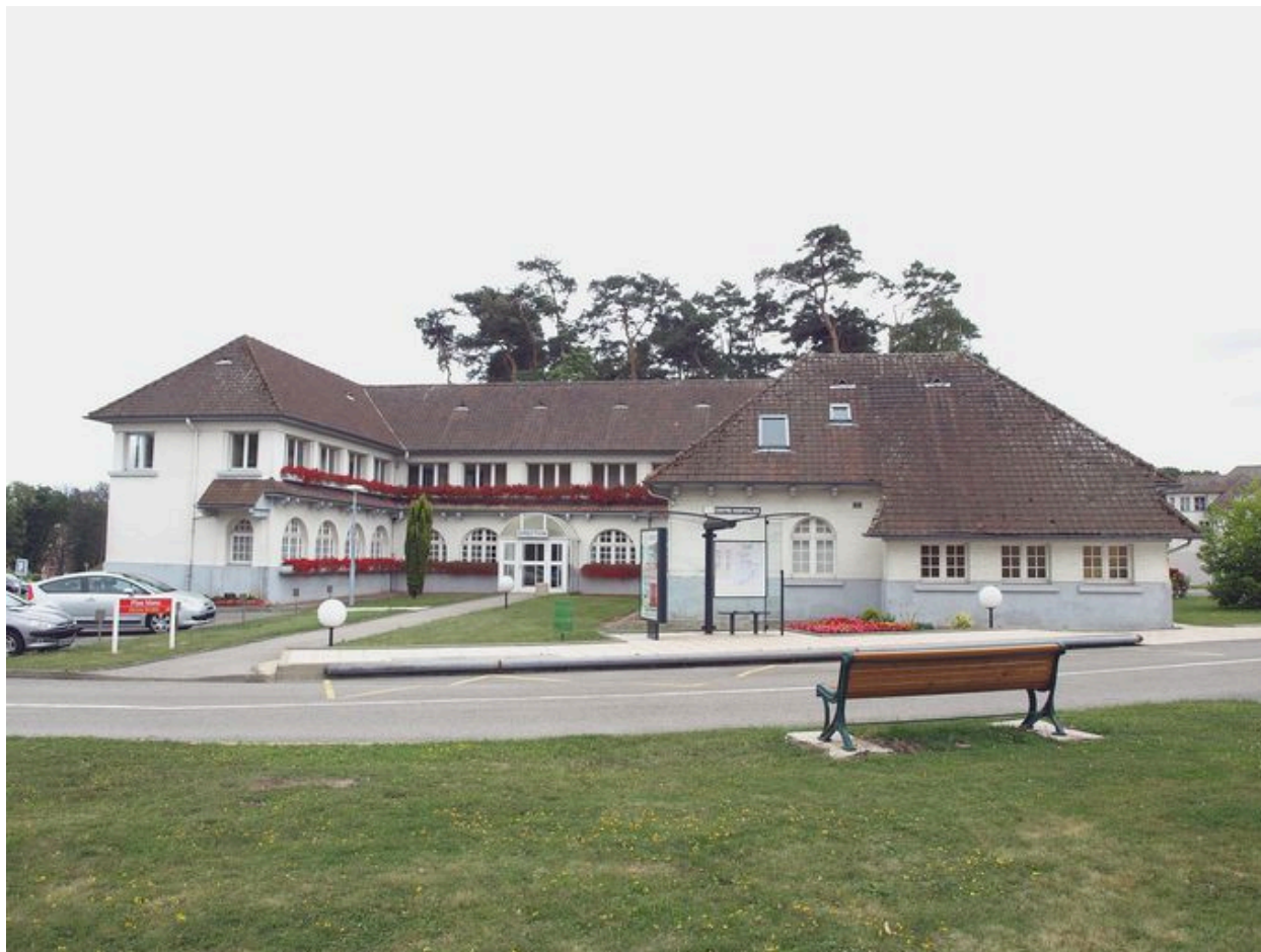
Bâtiments administratifs : architecture du début des années 1930