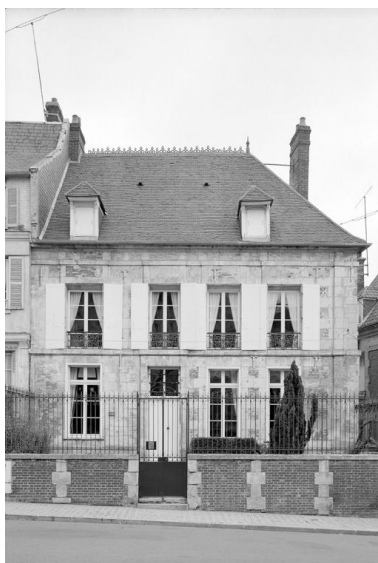
Vue générale. IVR22_19856001369X