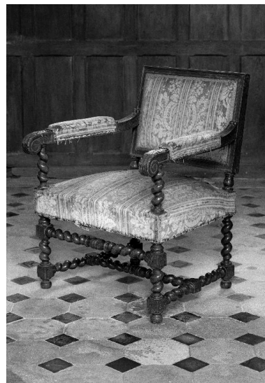
Vue du fauteuil du célébrant.