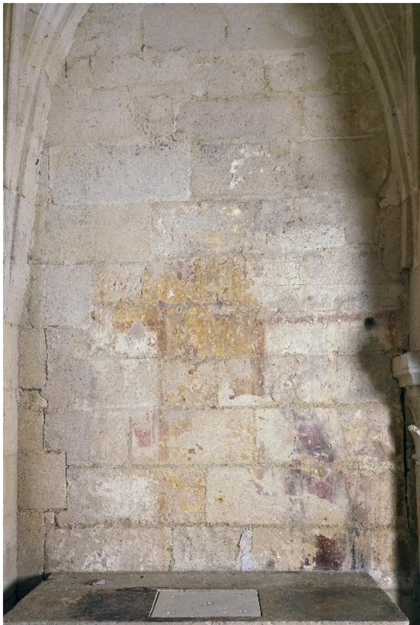
Vue des traces de peinture murale qui subsistent sur le mur oriental du collatéral nord de la nef.