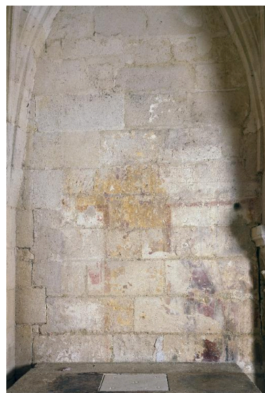
Vue des traces de peinture murale qui subsistent sur le mur oriental du collatéral nord de la nef. IVR22_20010202658XA