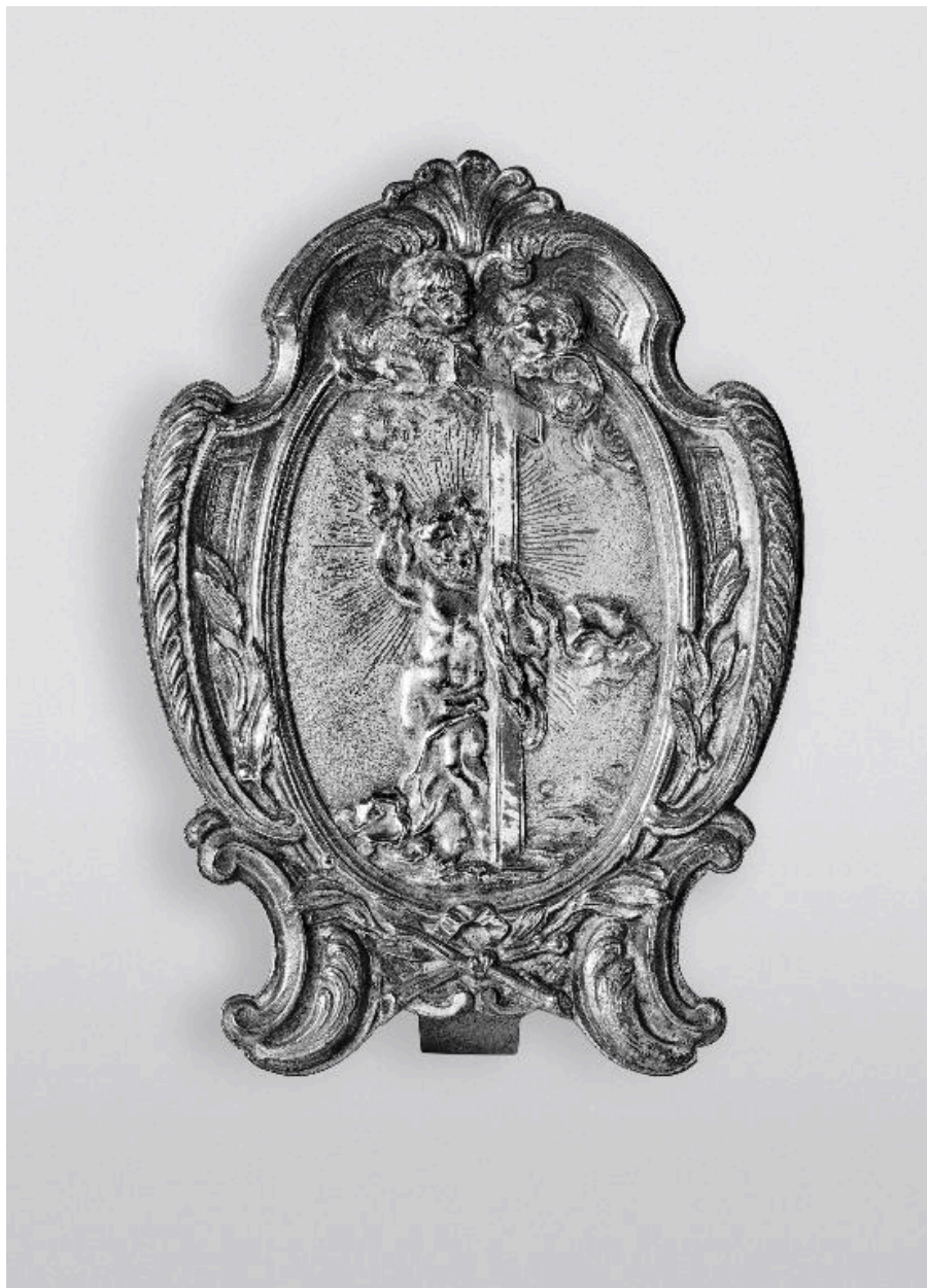
Vue du baiser de paix.