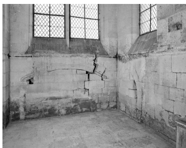
Détail des murs est et sud de la chapelle sud du chœur : enfeu et arcades murés. IVR22_20010202987V