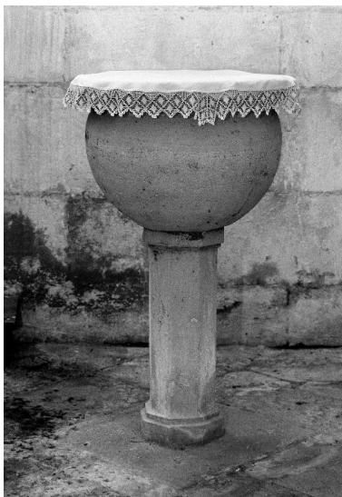
Vue des fonts baptismaux. IVR22_19880200705X