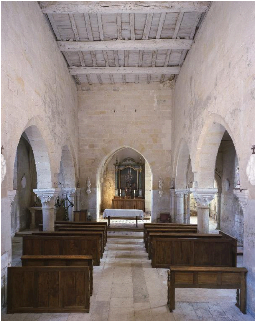
Vue intérieure de l'église et de son ameublement, depuis l'entrée vers le chœur.