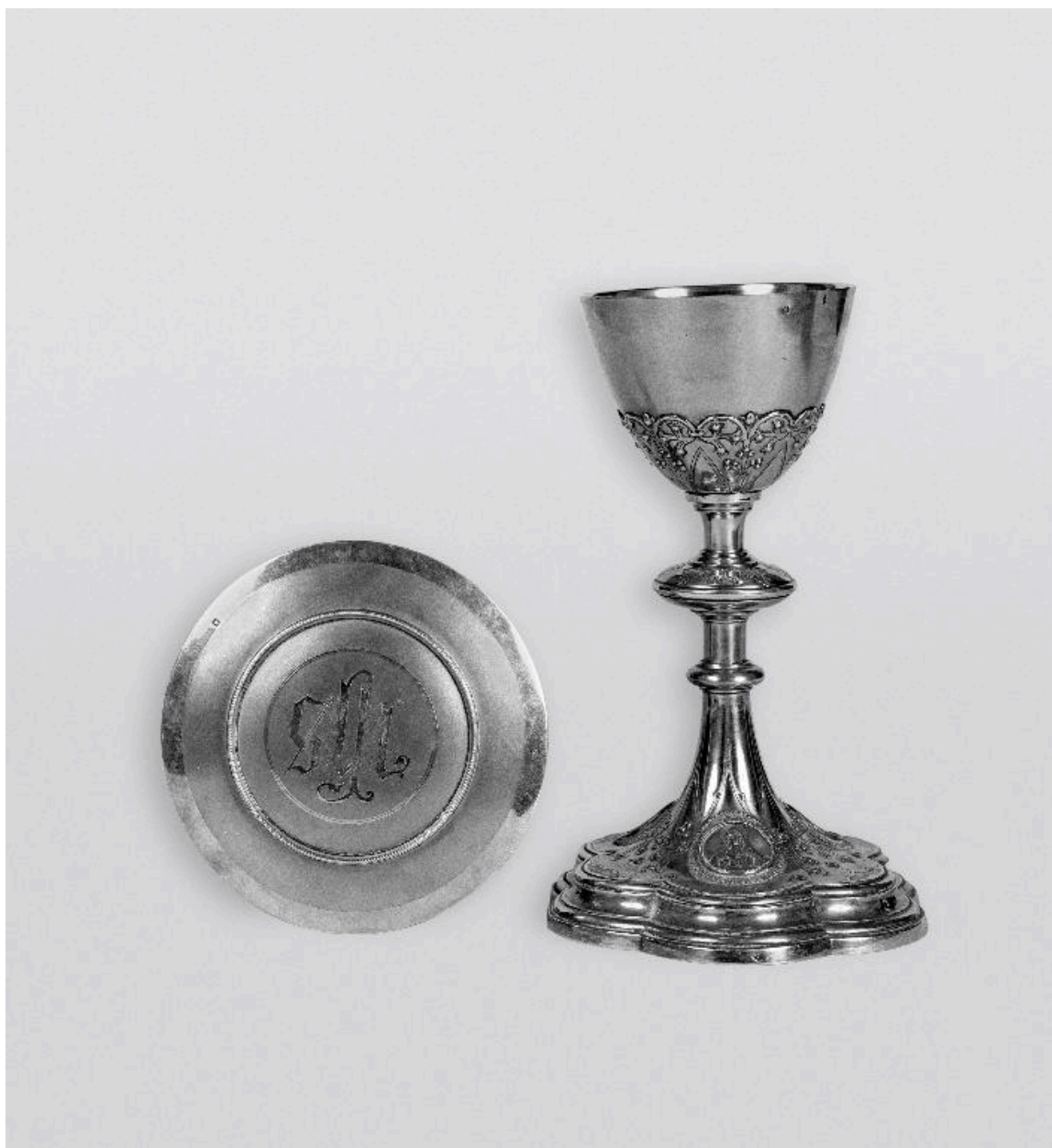
Vue du calice et de sa patène, œuvres des orfèvres lyonnais Favier frères.