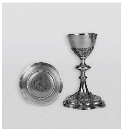
Vue du calice et de sa patène, œuvres des orfèvres lyonnais Favier frères. IVR22_19930200088X