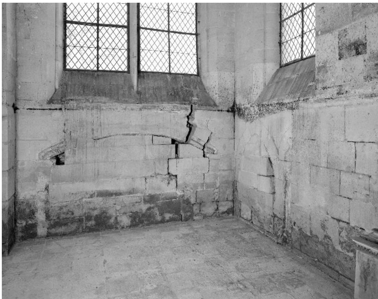
Détail des murs est et sud de la chapelle sud du chœur : enfeu et arcades murés.