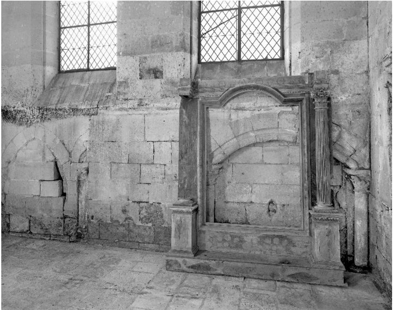
Détail du mur sud de la chapelle sud du chœur : arcades murées et enfeu.