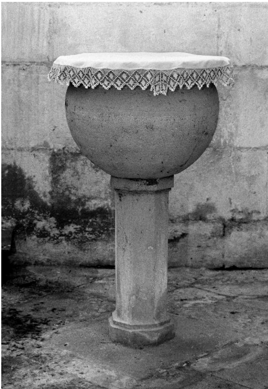
Vue des fonts baptismaux.