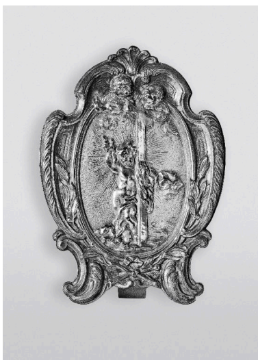
Vue du baiser de paix. IVR22_19930200089X