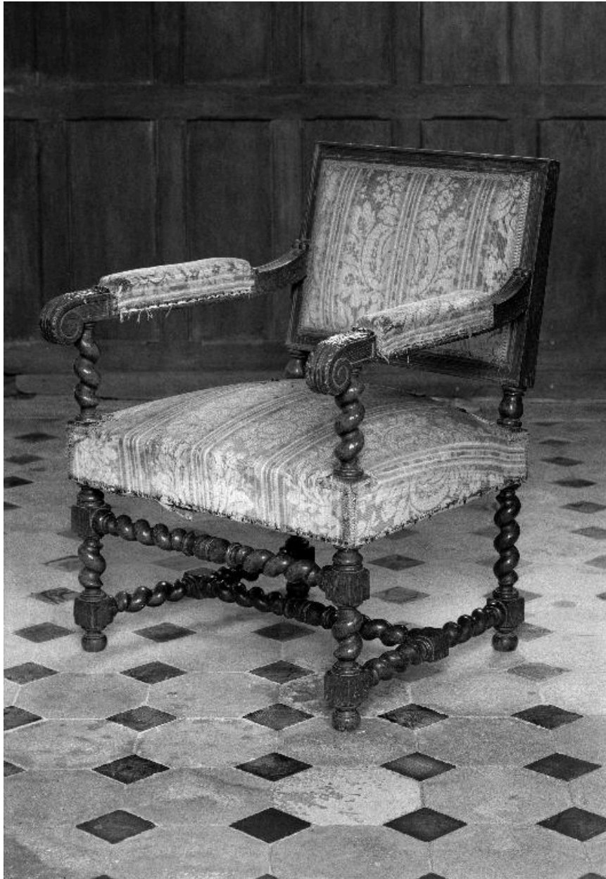
Vue du fauteuil du célébrant.