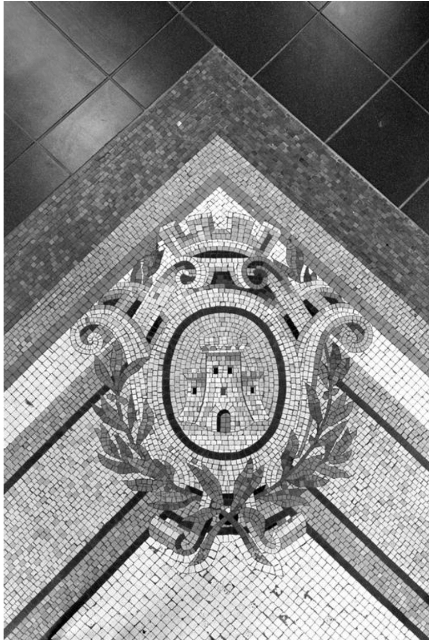
Détail de la mosaïque du vestibule : représentation des armes de Vervins.