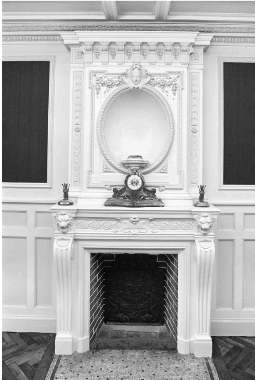
Vue de la cheminée de la salle du Conseil d'administration.