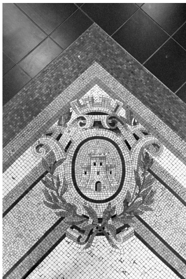
Détail de la mosaïque du vestibule : représentation des armes de Vervins. IVR22_19990207308Z