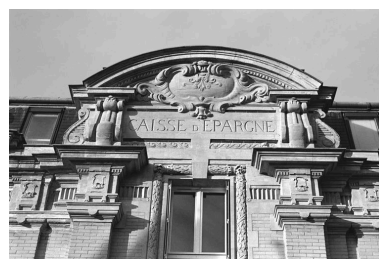
Détail du fronton cintré.