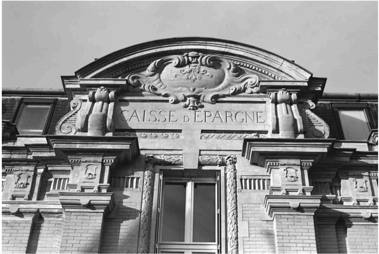
Détail du fronton cintré.