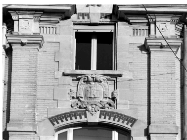
Détail du cartouche aux armes de Vervins, situé sur la façade latérale.