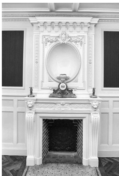
Vue de la cheminée de la salle du Conseil d'administration.