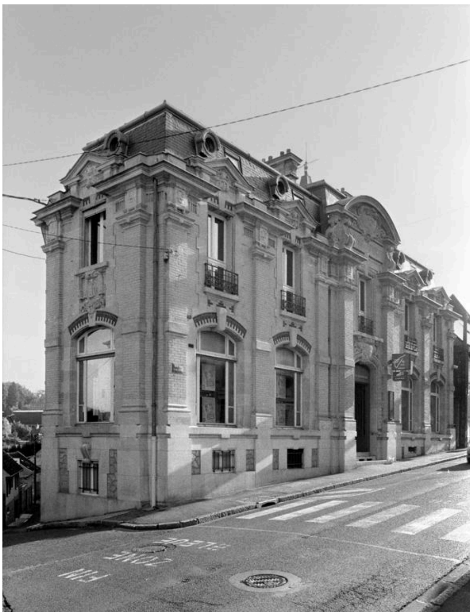
Vue de l'élévation principale.