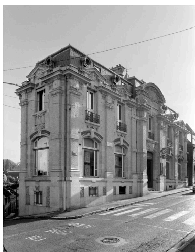
Vue de l'élévation principale. IVR22_19990204354Z