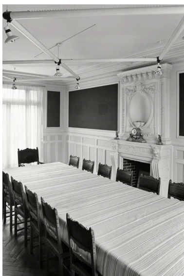
Vue de la salle du Conseil d'administration. IVR22_19990207311Z