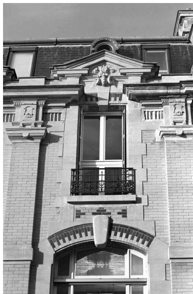
Détail d'une travée. IVR22_19990207117Z