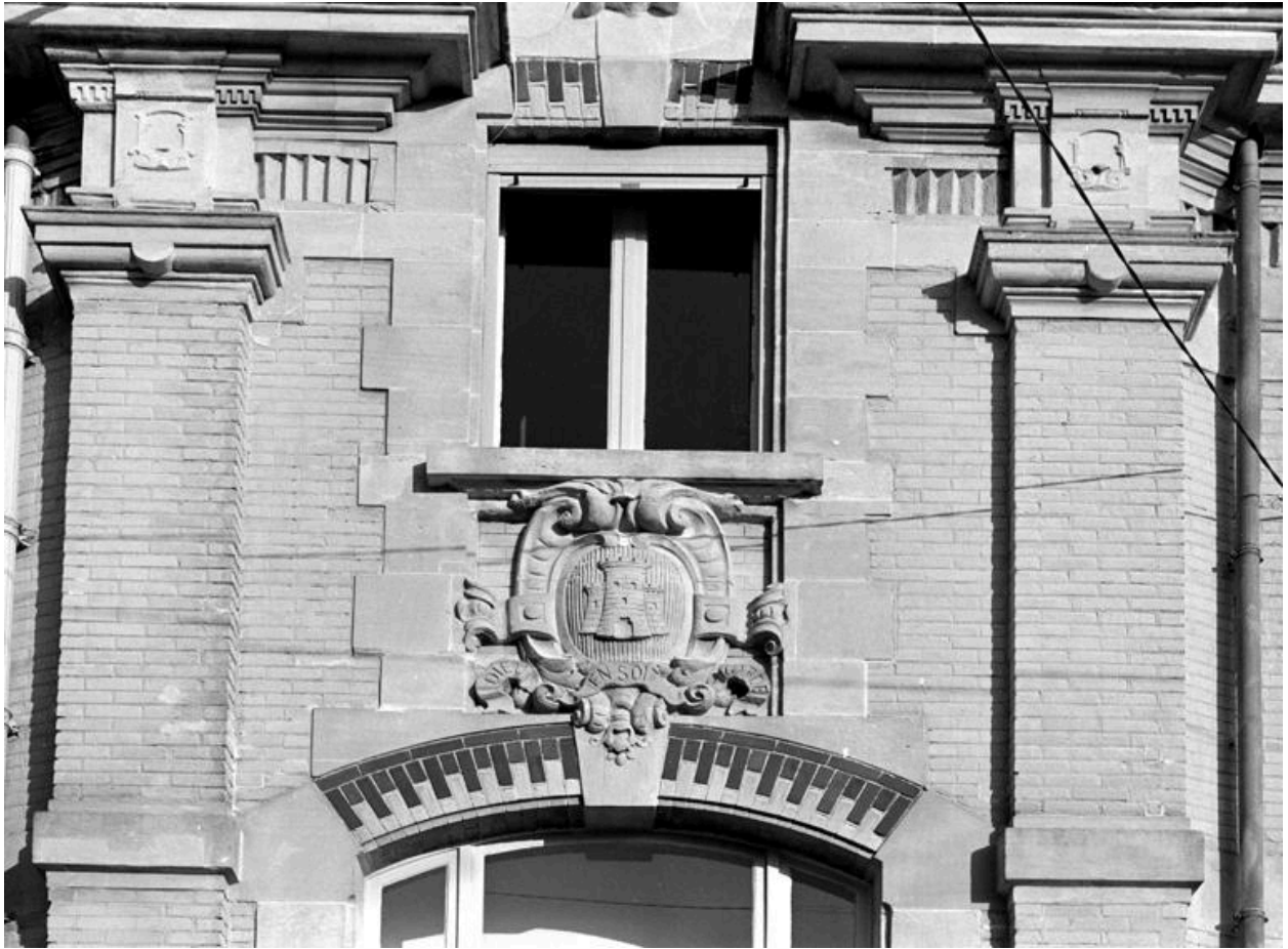
Détail du cartouche aux armes de Vervins, situé sur la façade latérale.