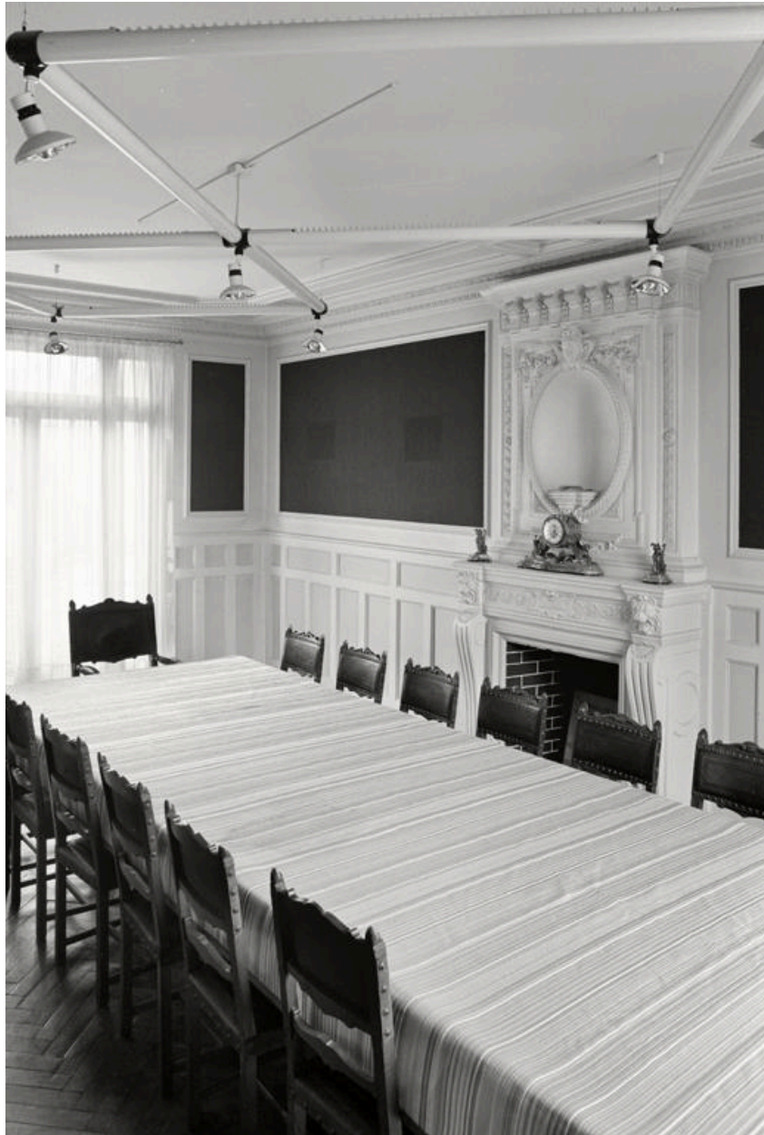
Vue de la salle du Conseil d'administration.