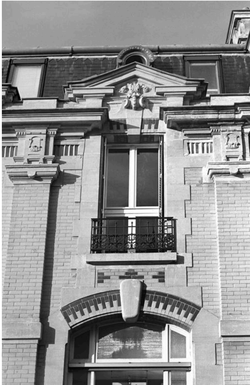
Détail d'une travée.