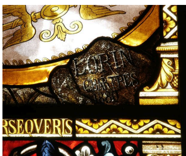
Détail : signature.

IVR22_20058001916NUCA