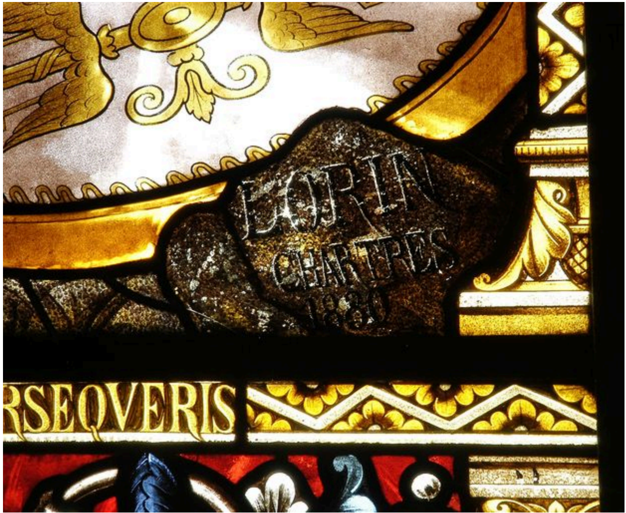
Détail : signature.