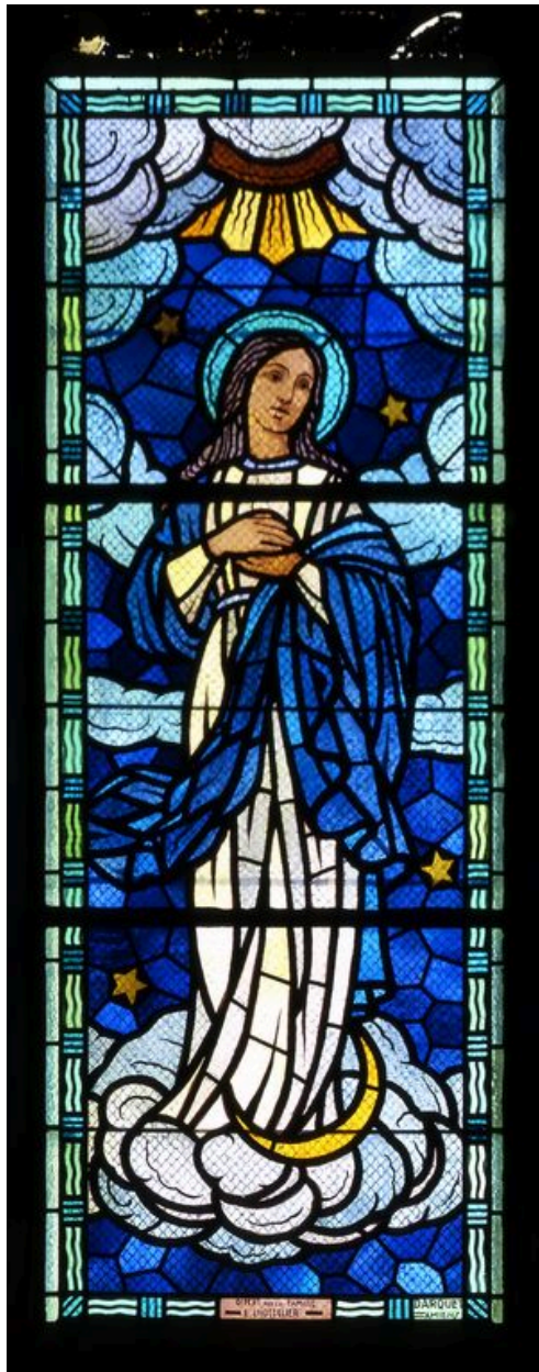
Vue d'ensemble de la baie (Vierge).