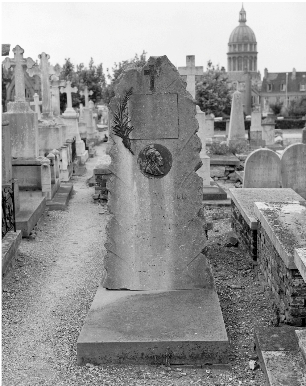
Tombeau d'Émile Martel. Vue générale.