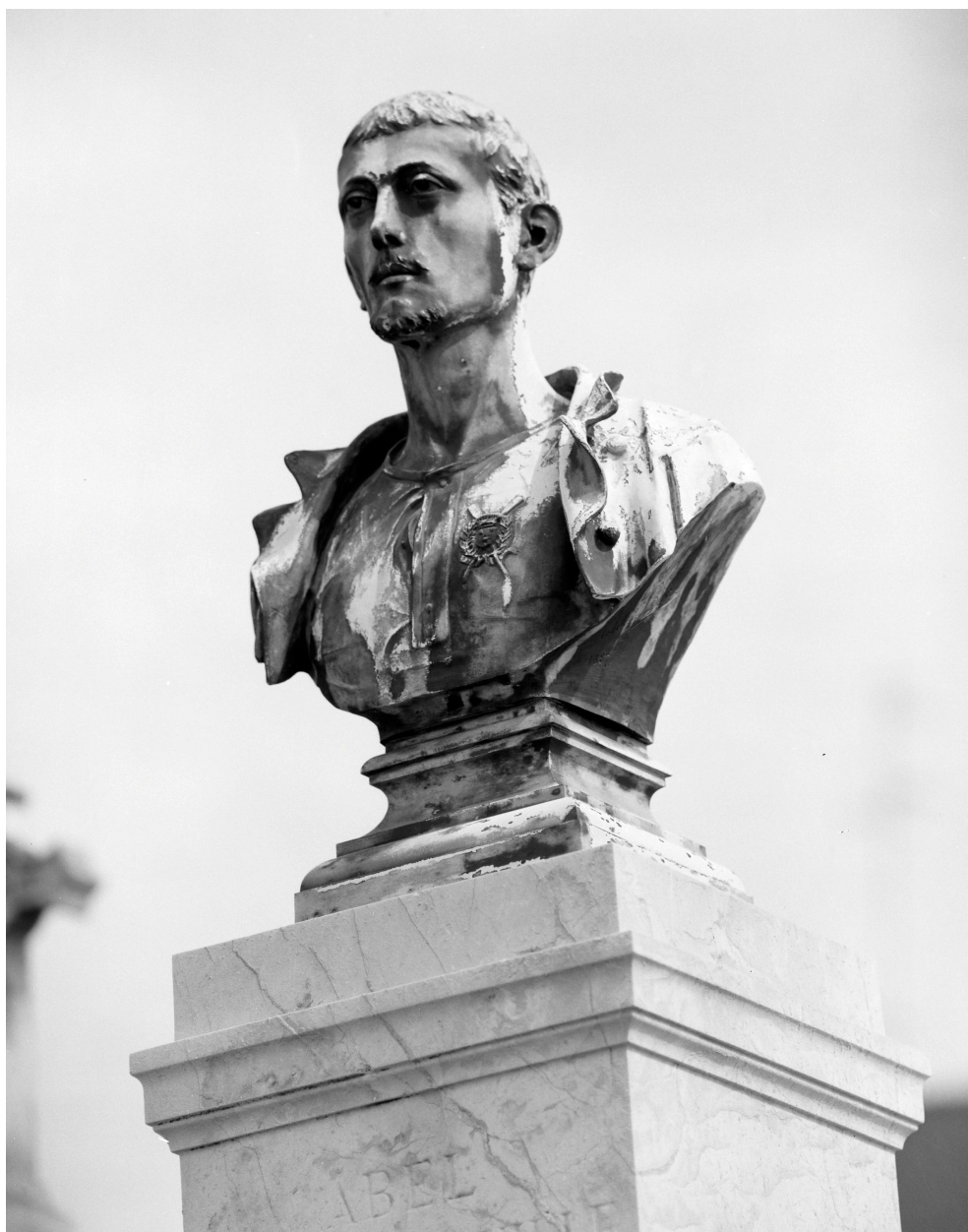
Tombeau d'Abel d'Hautefeuille. Buste.