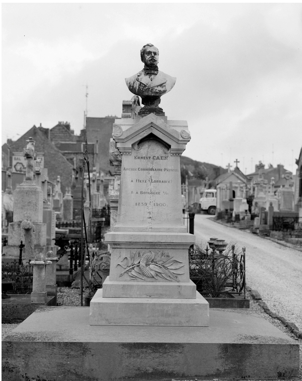
Tombeau d'Ernest Caen. Vue générale.