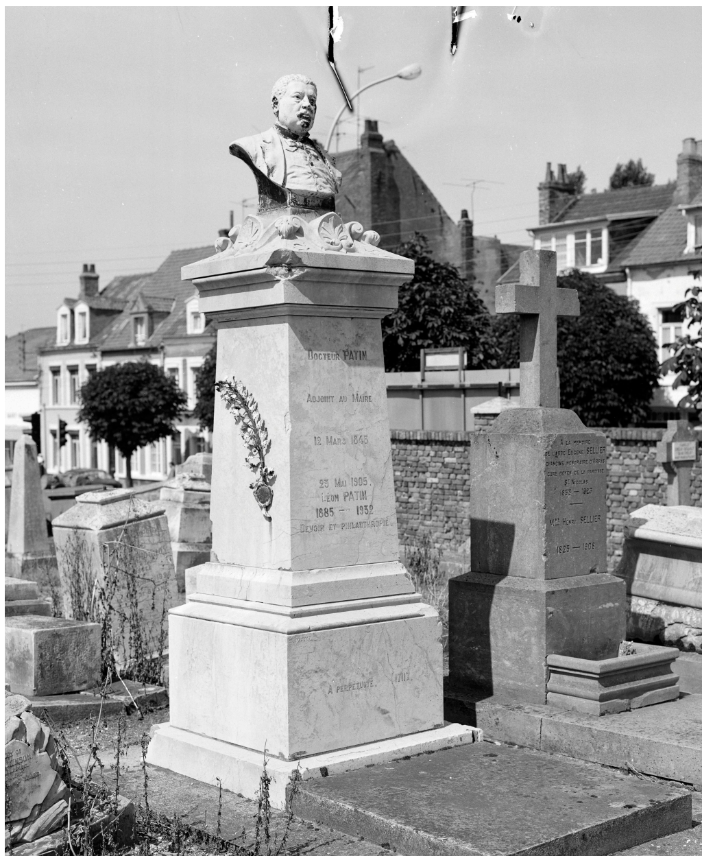
Tombeau du Docteur Patin. Vue générale.