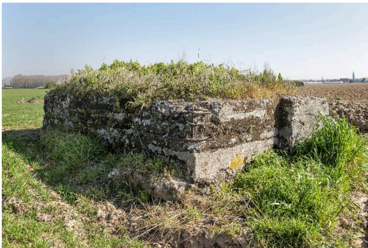
Vue de 3/a arrière, vers le nord-est