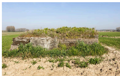
Vue vers le nord IVR31_20145905025NUCA