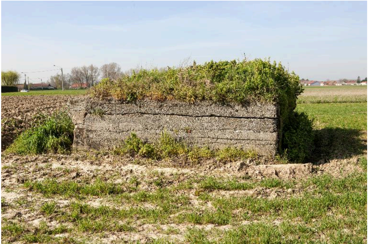
Vue de trois-quarts, vers le sud-ouest