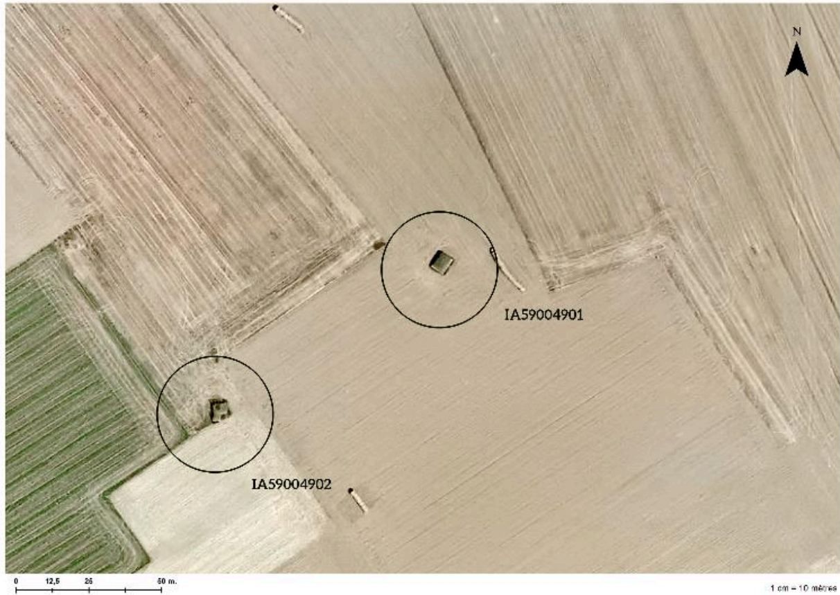
Position de l'édifice (cercle du bas) sur une photographie aérienne de 2009