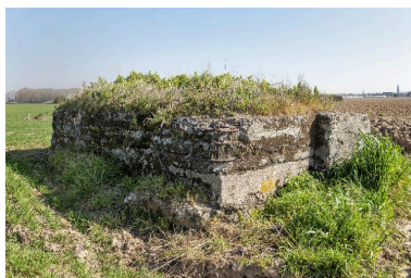
Vue de 3/4 arrière, vers le nord-est IVR31_20145905026NUCA