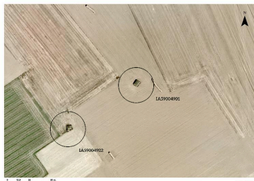
Position de l'édifice (cercle du bas) sur une photographie aérienne de 2009 IVR32_20175900728NUCA