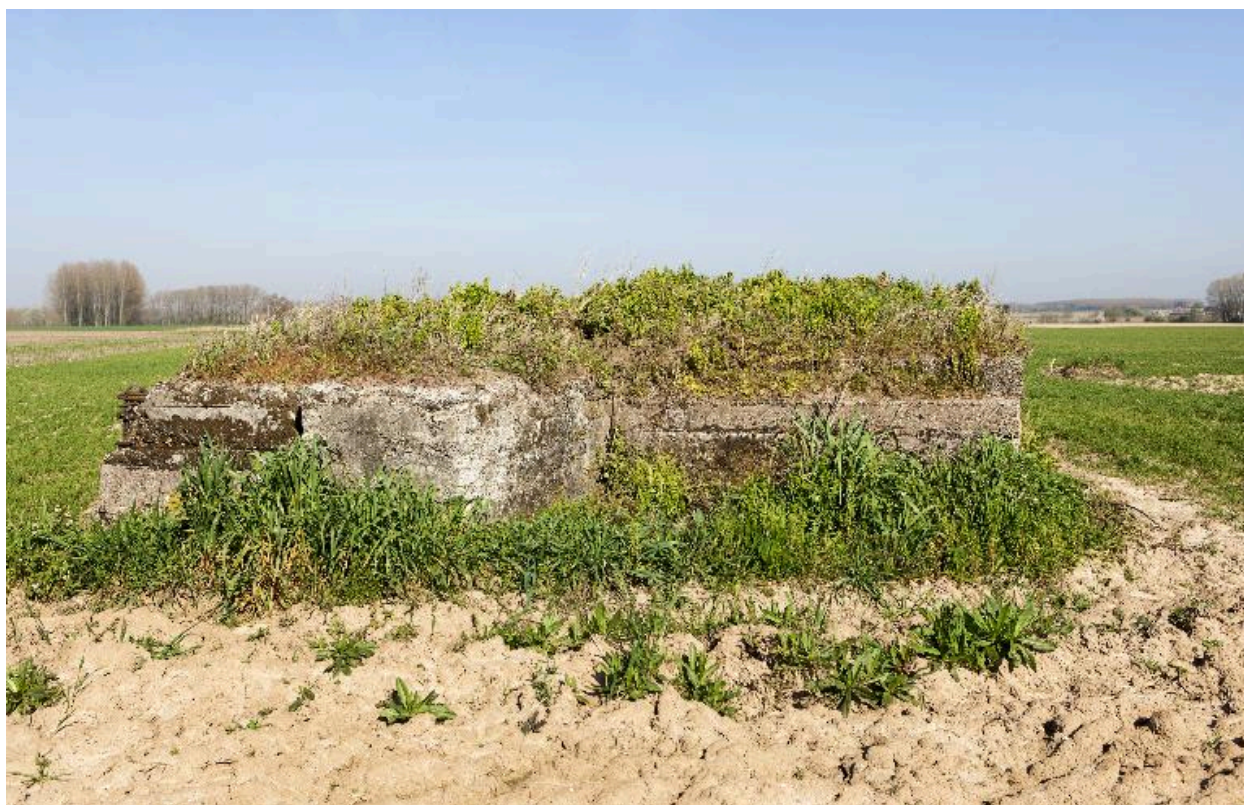
Vue vers le nord