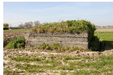
Vue de trois-quarts, vers le sud-ouest IVR31_20145905027NUCA