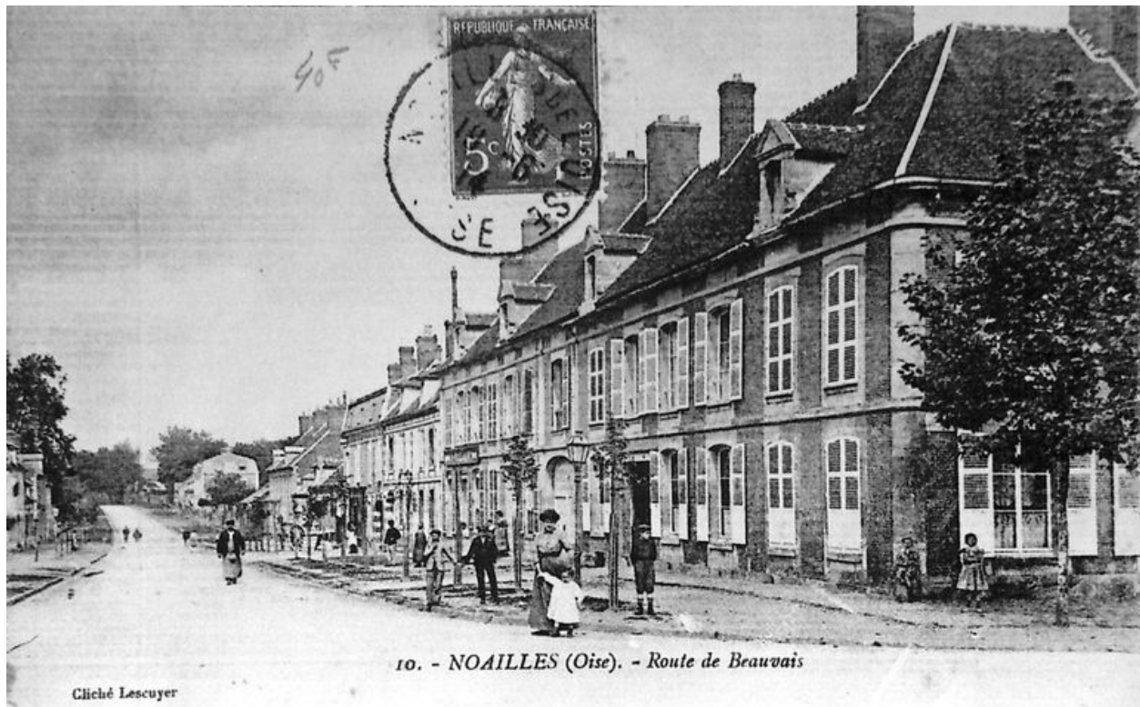
10. - NOAILLES (Oise). - Route de Beauvais