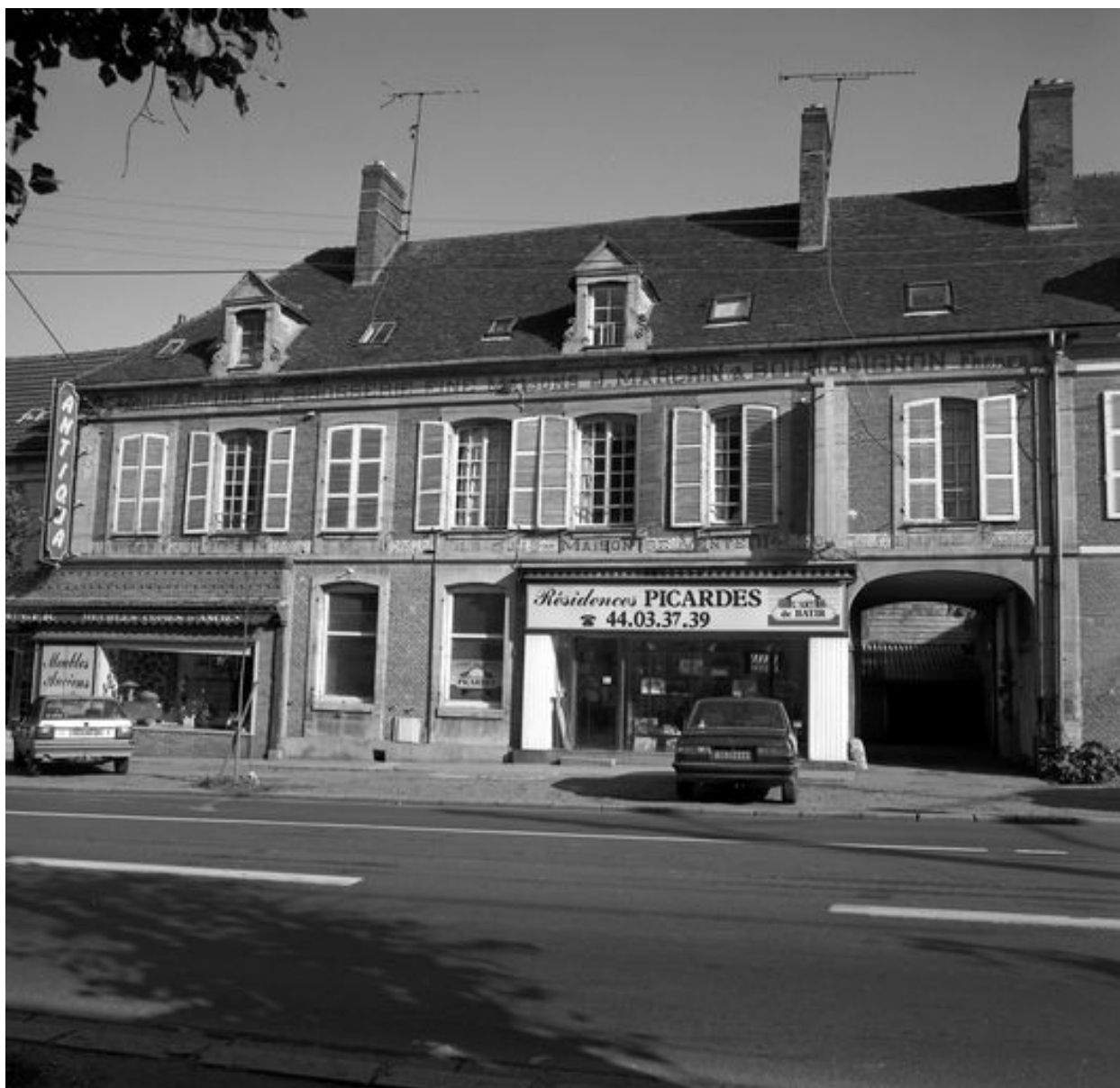
Atelier de fabrication, façade sur rue.