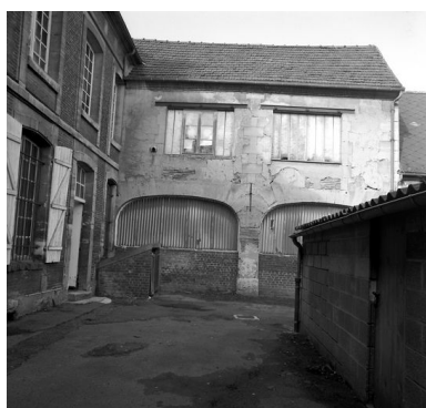
Atelier de fabrication, façade sur cour et aile en retour.