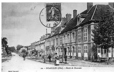
Vue d'ensemble de la façade sur rue de la brosserie au début du XXème siècle.