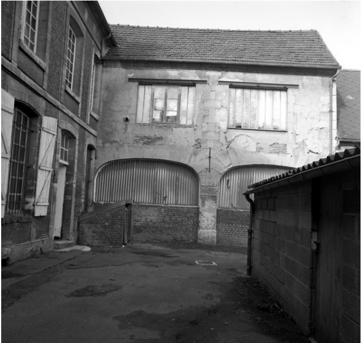
Atelier de fabrication, façade sur cour et aile en retour.