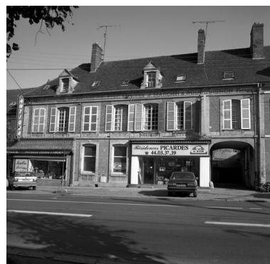
Atelier de fabrication, façade sur rue. IVR22_19996001409X