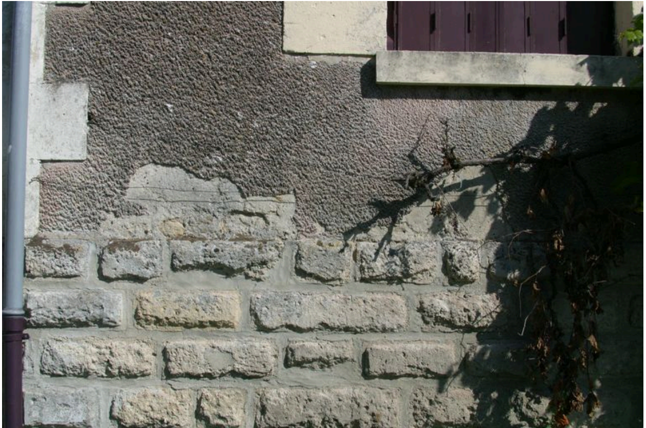
Détail du mur de façade.