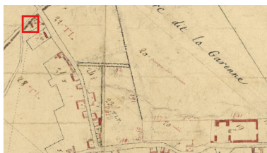
Extrait du plan par masses de cultures de Sailly-Flibeaucourt, 1804 (AD Somme ; 3 P 1097).