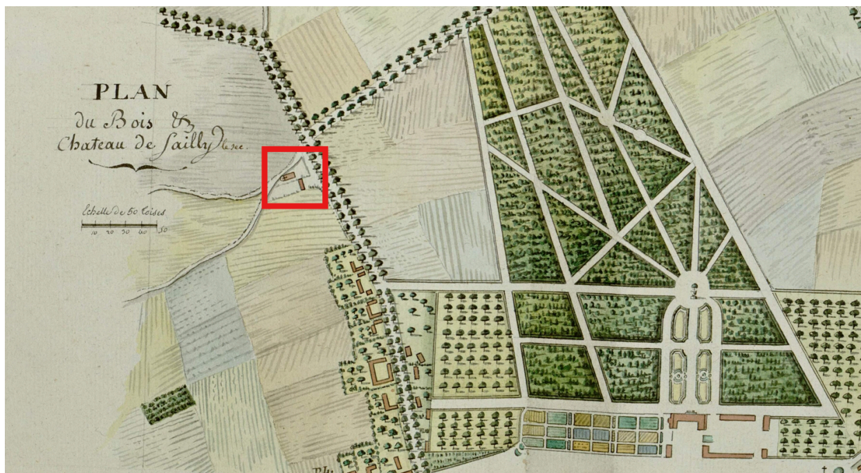
Détail de l'église sur le plan du château de Sailly-le-Sec avec son bois, collection Delignières de Bommy de Saint Amand, 1794 (Archives et bibliothèque patrimoniale d'Abbeville ; 4, 138).