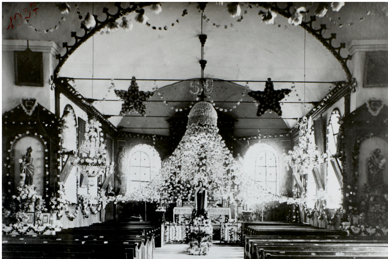
Intérieur de l'église, ancien aménagement liturgique, photo, 1937.