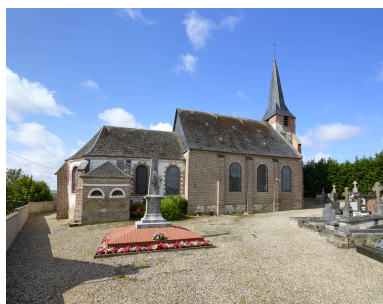
Vue d'ensemble de l'église, depuis le nord. IVR32_20258001038NUCA