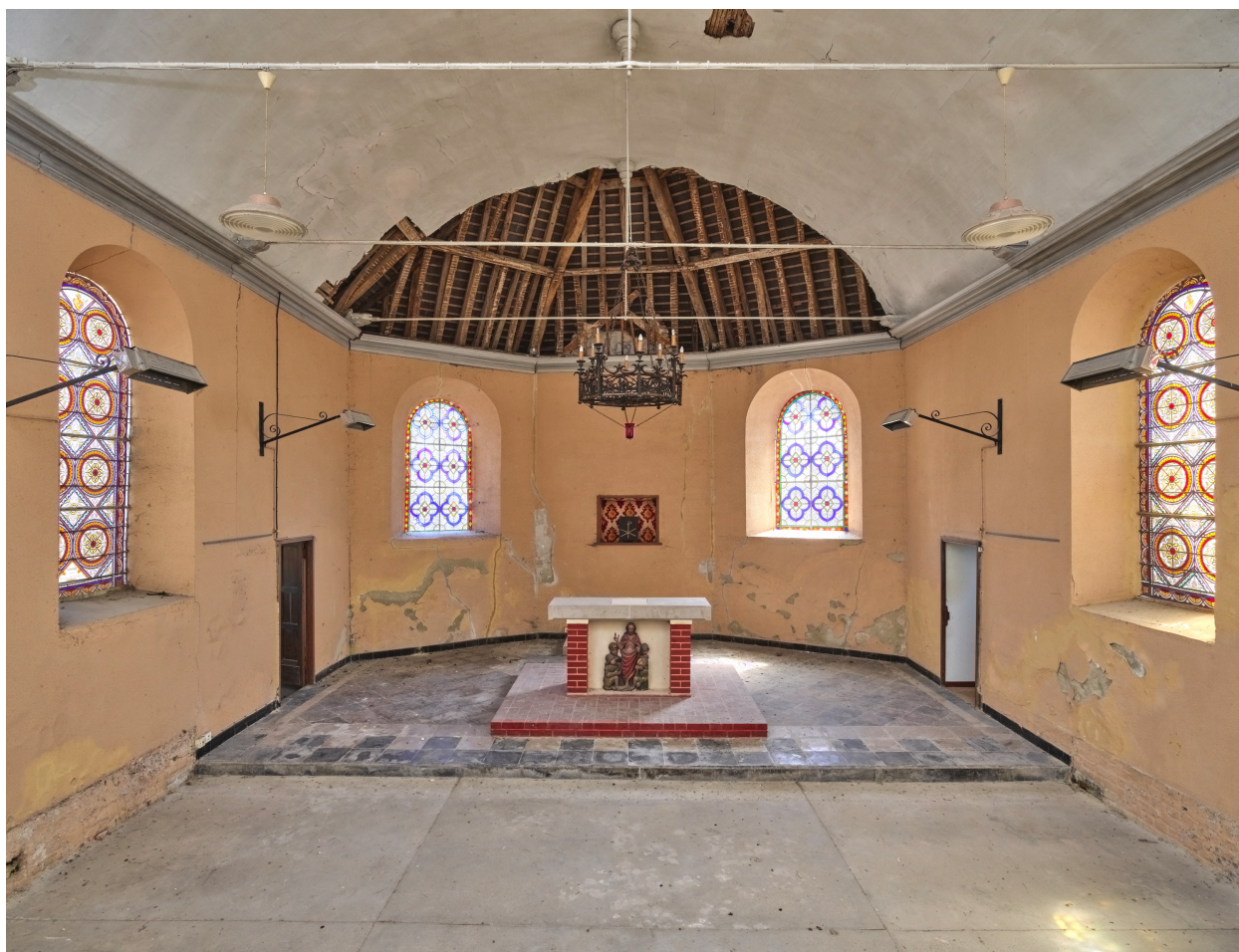
Intérieur, vue du chœur, depuis la nef.