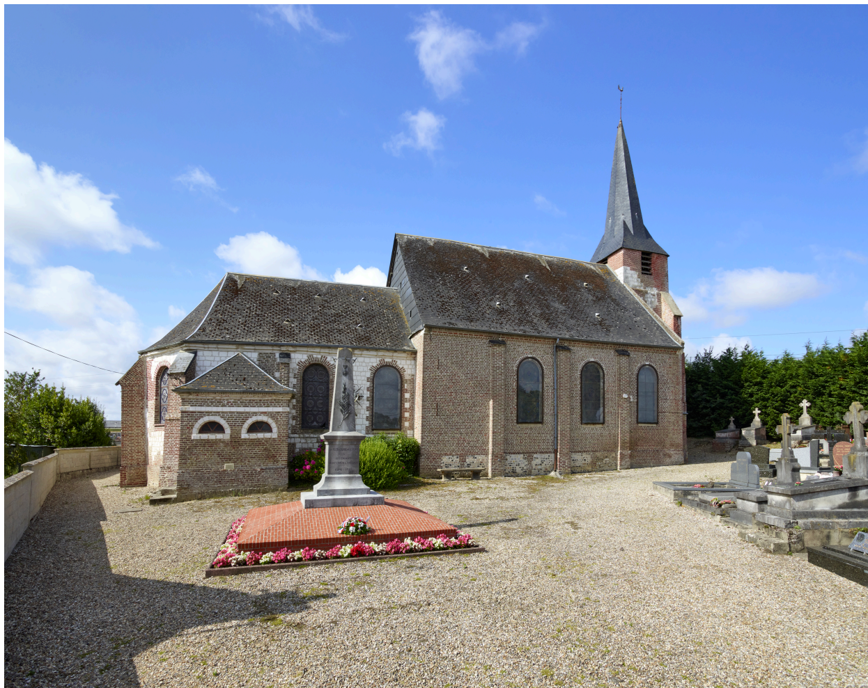
Vue d'ensemble de l'église, depuis le nord.