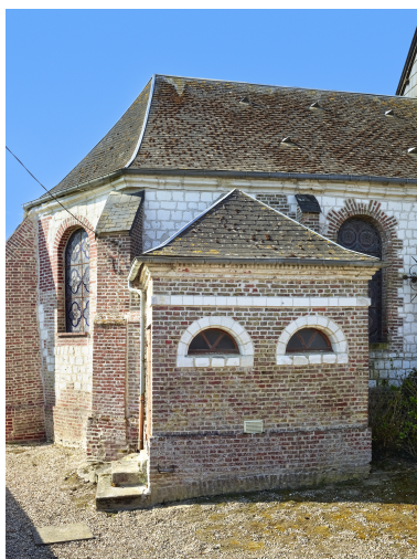
Vue de l'ancienne chapelle, depuis le nord. IVR32_20258001039NUCA