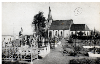
L'église et son cimetière, photo (coll. part.) IVR32_20258002112NUCA