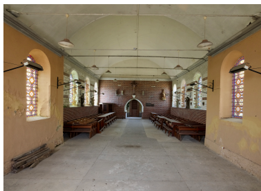
Intérieur, vue de la nef depuis le chœur. IVR32_20258001054NUCA