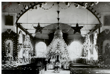
Intérieur de l'église, ancien aménagement liturgique, photo, 1937. IVR32_20258002111NUCA