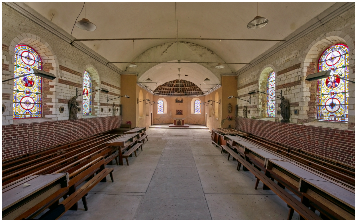
Intérieur, vue de la nef et du chœur, depuis l'entrée.