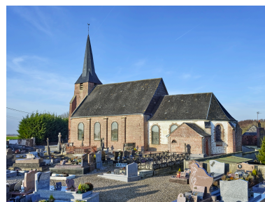
Vue d'ensemble de l'église, depuis le sud. IVR32_20258001035NUCA