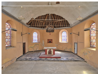
Intérieur, vue du chœur, depuis la nef. IVR32_20258001041NUCA