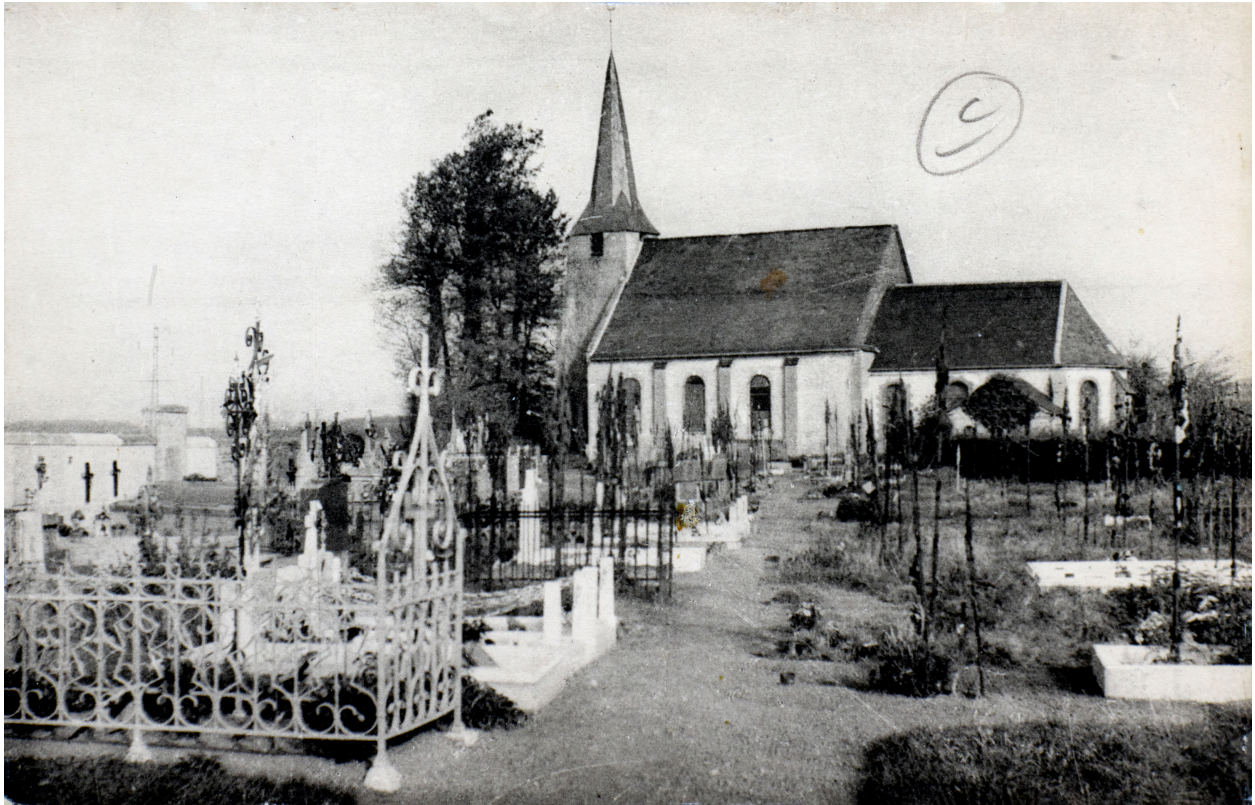
L'église et son cimetière