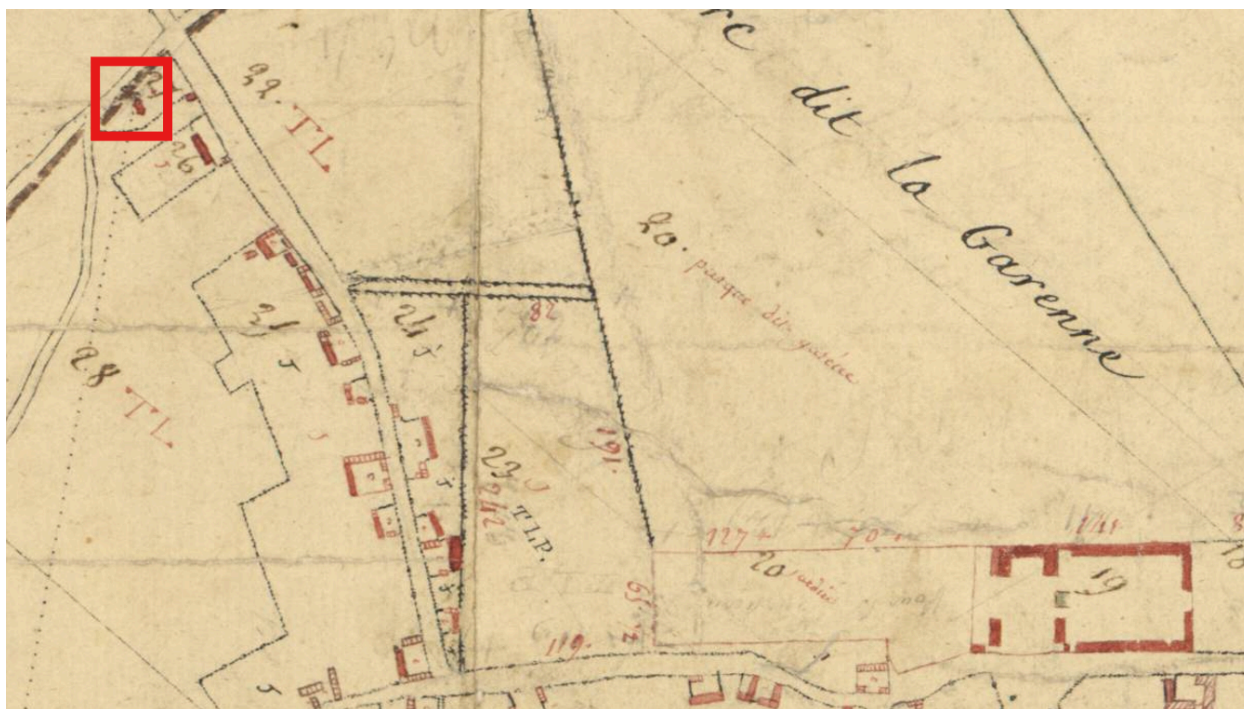
Extrait du plan par masses de cultures de Saily-Flibeaucourt, 1804 (AD Somme ; 3 P 1097).