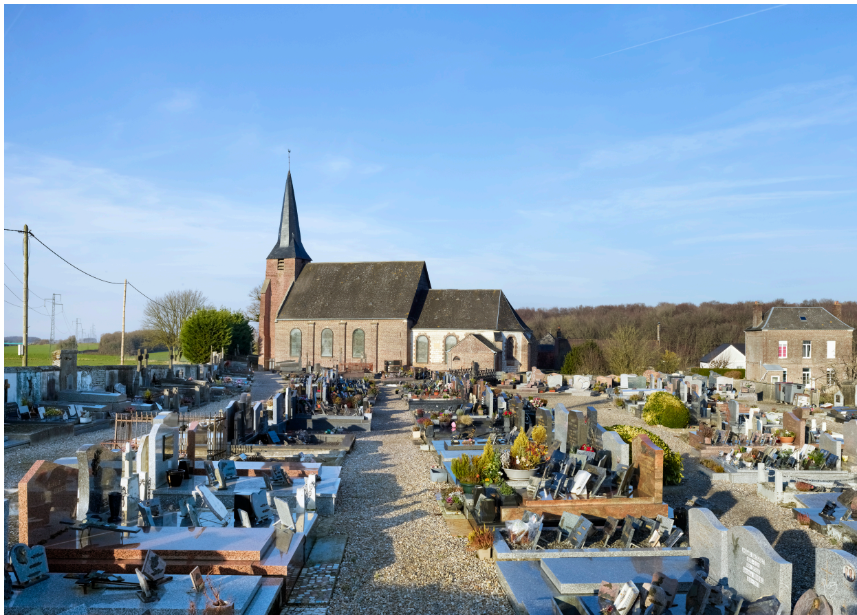
Vue de l'église et de son cimetière, depuis le sud.