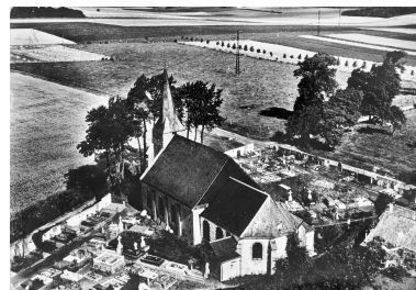
Vue aérienne de l'église