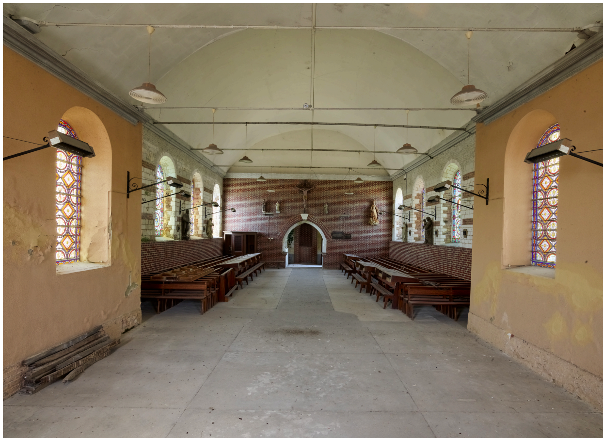
Intérieur, vue de la nef depuis le chœur.