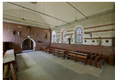
Intérieur, vue du mur nord de la nef. IVR32_20258001055NUCA