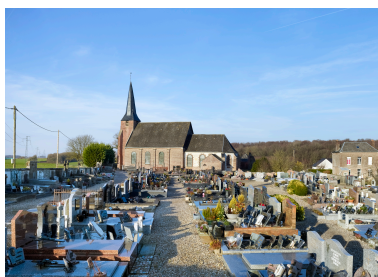
Vue de l'église et de son cimetière, depuis le sud. IVR32_20258001034NUCA