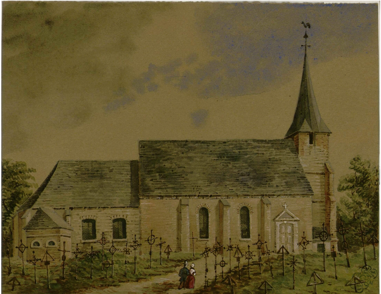
Église de Saily-le-Sec, par Oswald Macqueron, aquarelle d'après nature, 25 mai 1852 (Archives et bibliothèque patrimoniale d'Abbeville ; Nou. 113).