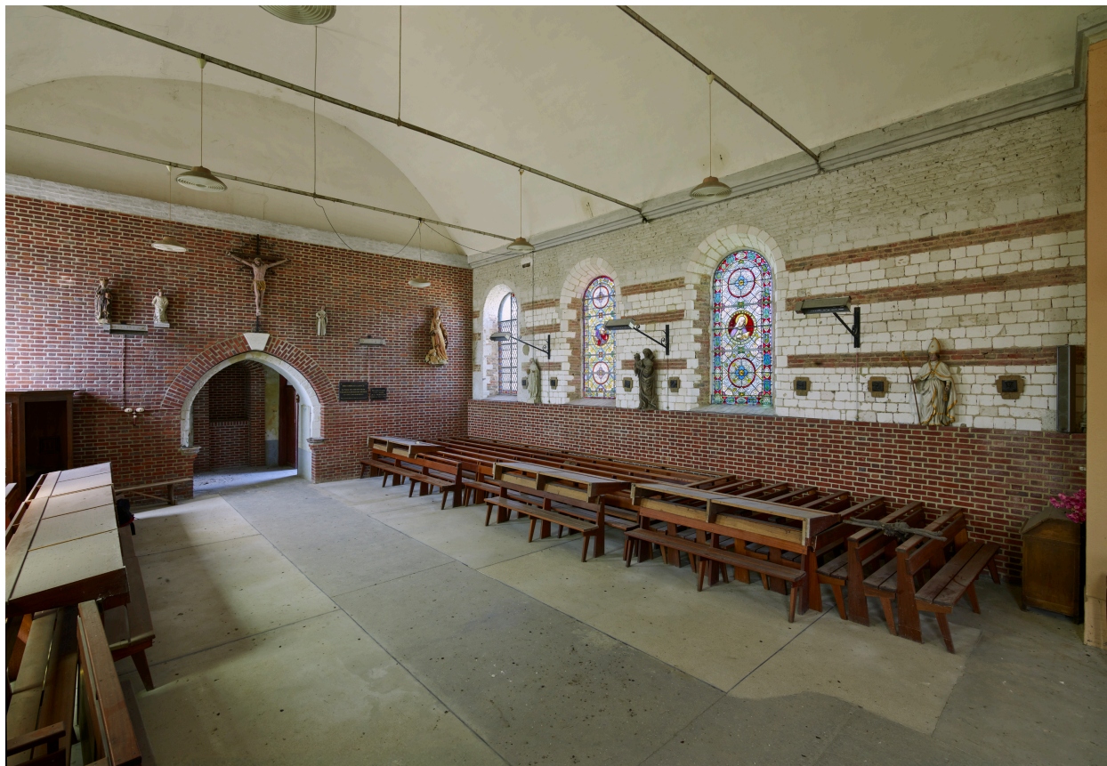
Intérieur, vue du mur nord de la nef.