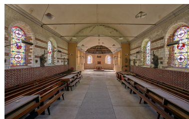
Intérieur, vue de la nef et du chœur, depuis l'entrée. IVR32_20258001040NUCA