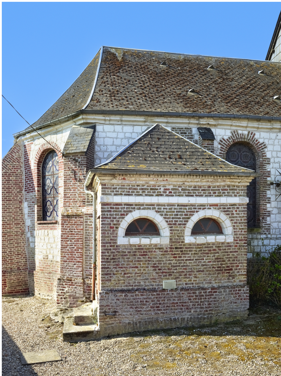
Vue de l'ancienne chapelle, depuis le nord.