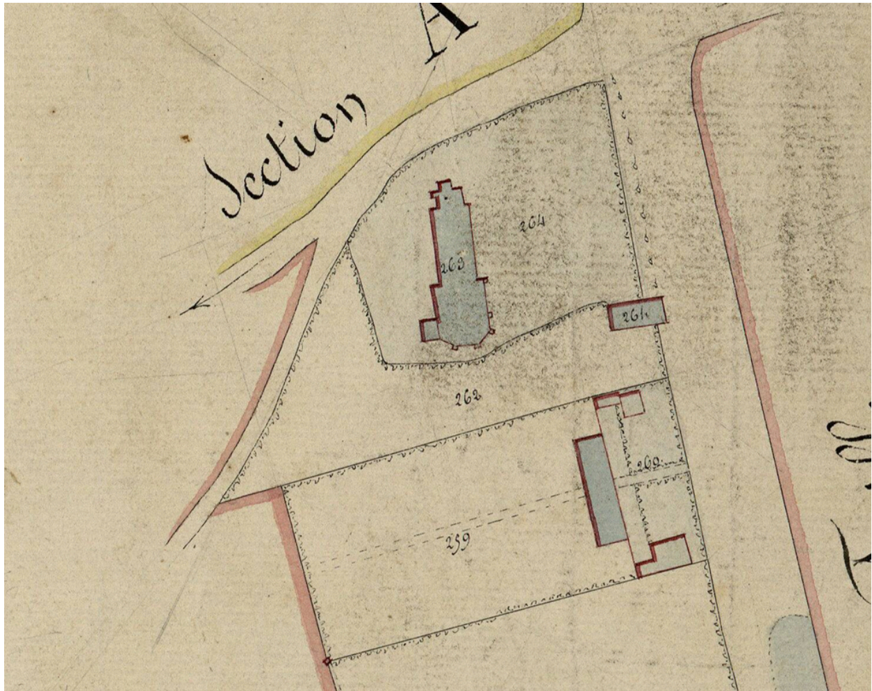
Église de Saily-le-Sec, extrait du plan parcellaire de Saily-Flibeaucourt, dit cadastre napoléonien, section B1, 1832 (AD Somme ; 3 P 1464/5).