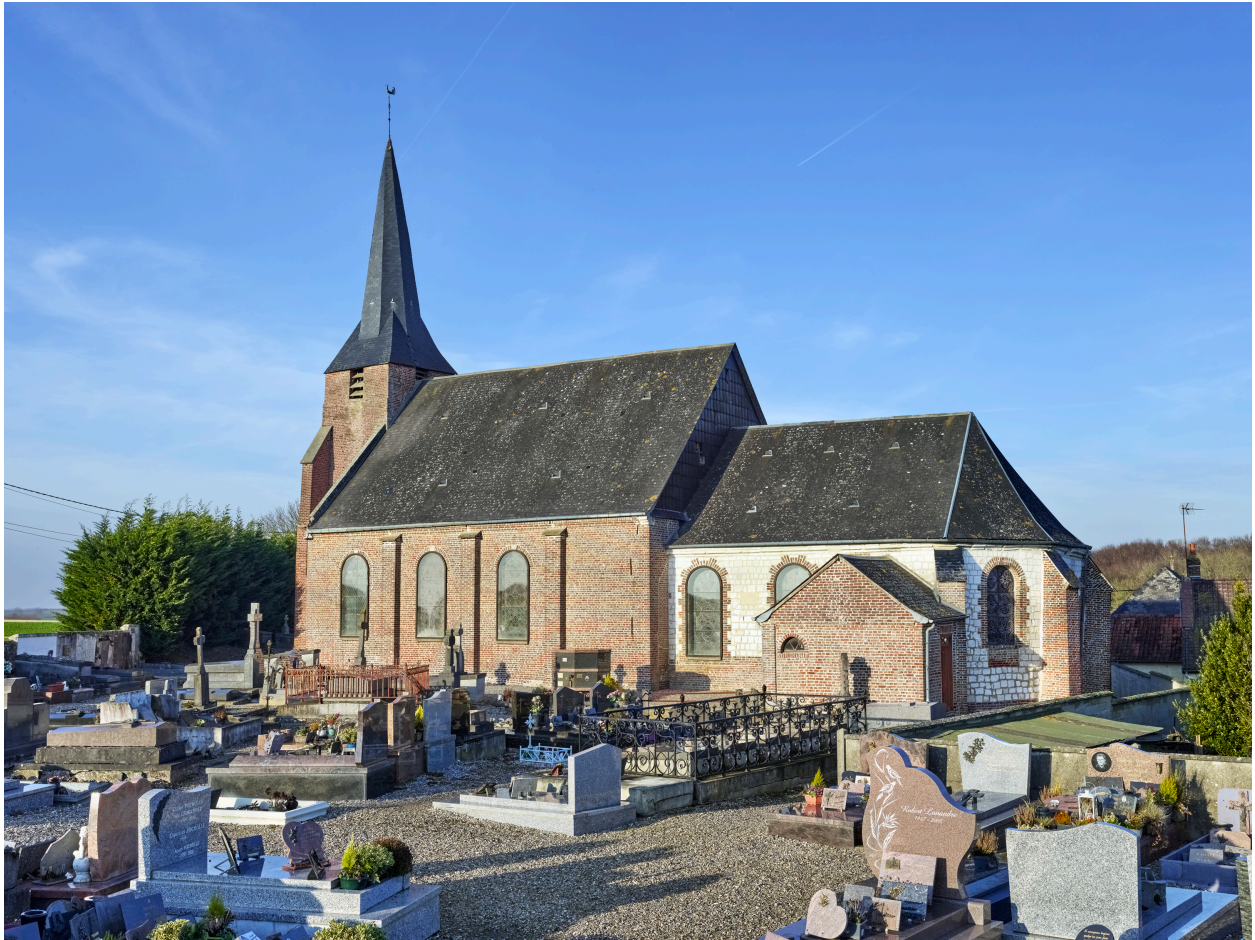
Vue d'ensemble de l'église, depuis le sud.