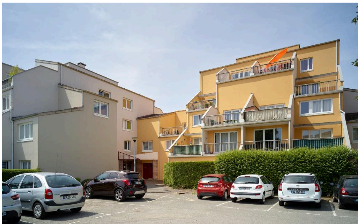
Les immeubles n°71 et n°73 rue des Chercheurs vus depuis le parc de stationnement sud-est.