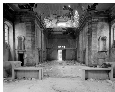
Chapelle, vue intérieure vers entrée. IVR31_19886200650V