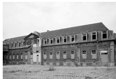
Bâtiment B, façade est sur cour. IVR31_19846200123X