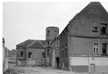
Bâtiment C, chapelle : vue d'ensemble ouest. IVR31_19846200121X