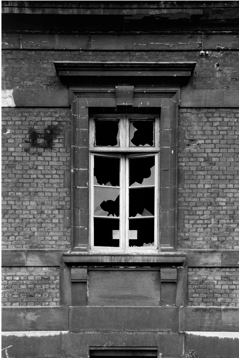
Bâtiment A, façade sur cour, fenêtres.