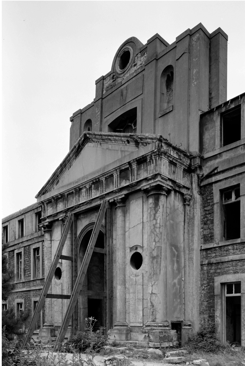
Chapelle, entrée : vue d'angle sur cour.