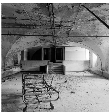
Bâtiment D, sous-sol, voûtement, vue vers l'escalier. IVR31_19886200686X