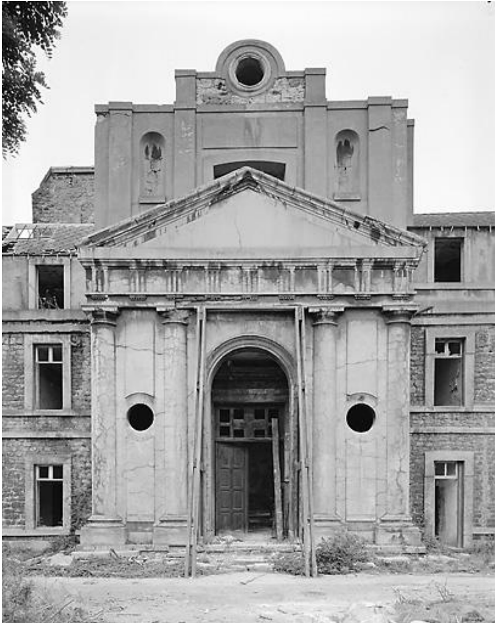
Chapelle, façade sur cour.