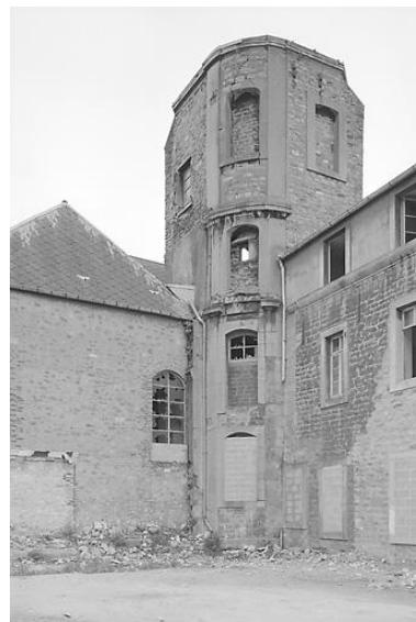
Chapelle, clocher, vue d'angle de la rue du Vivier. IVR31_19846200122X