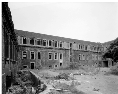
Bâtiment D, façade sur cour.