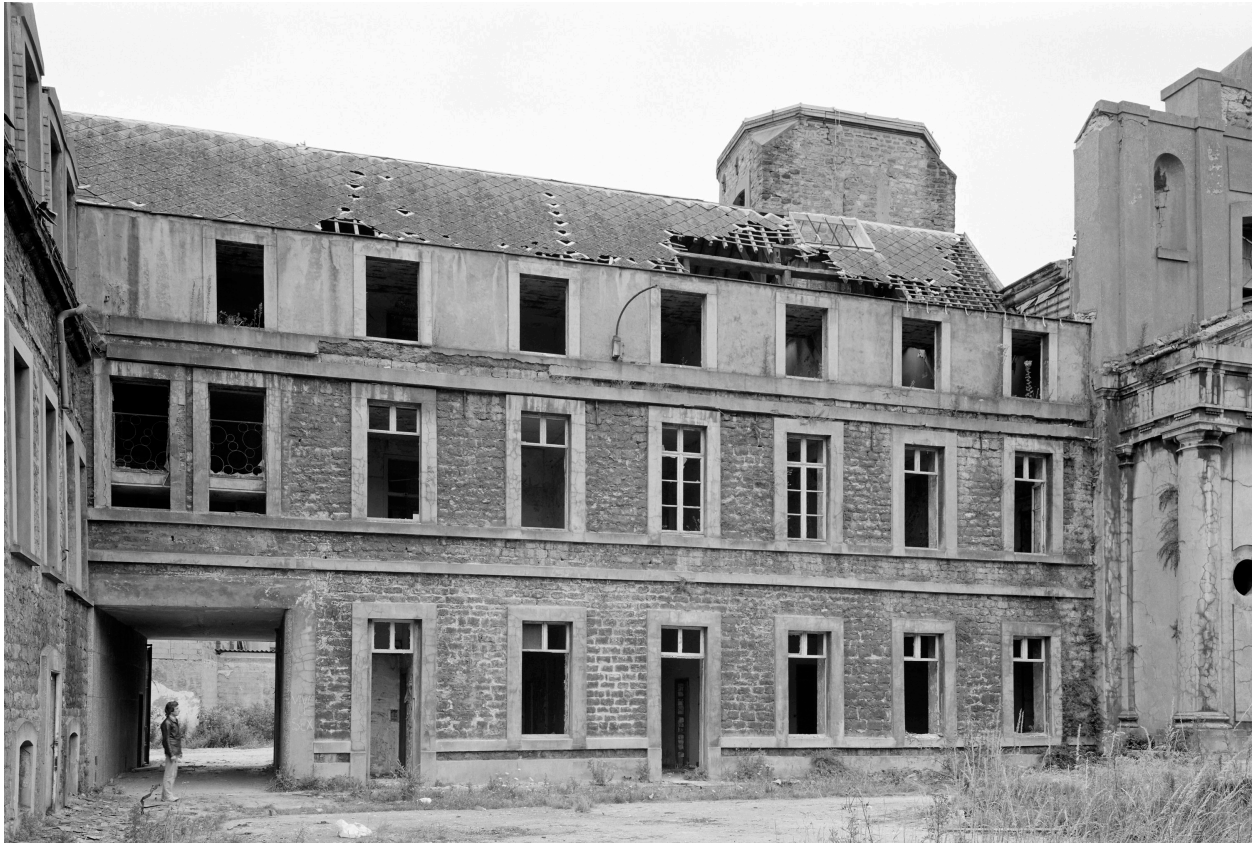
Bâtiment C, partie ouest, façade sur cour.