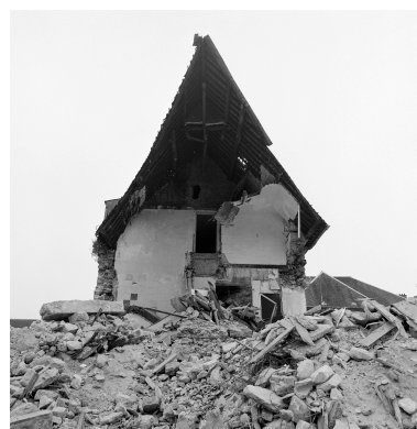
Bâtiment D, charpente. IVR31_19886200683X