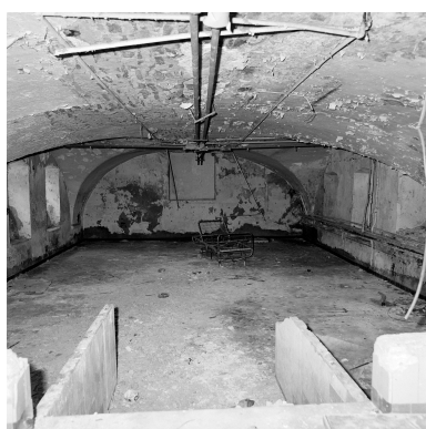
Bâtiment D, sous-sol, voûtement, vue de l'escalier.