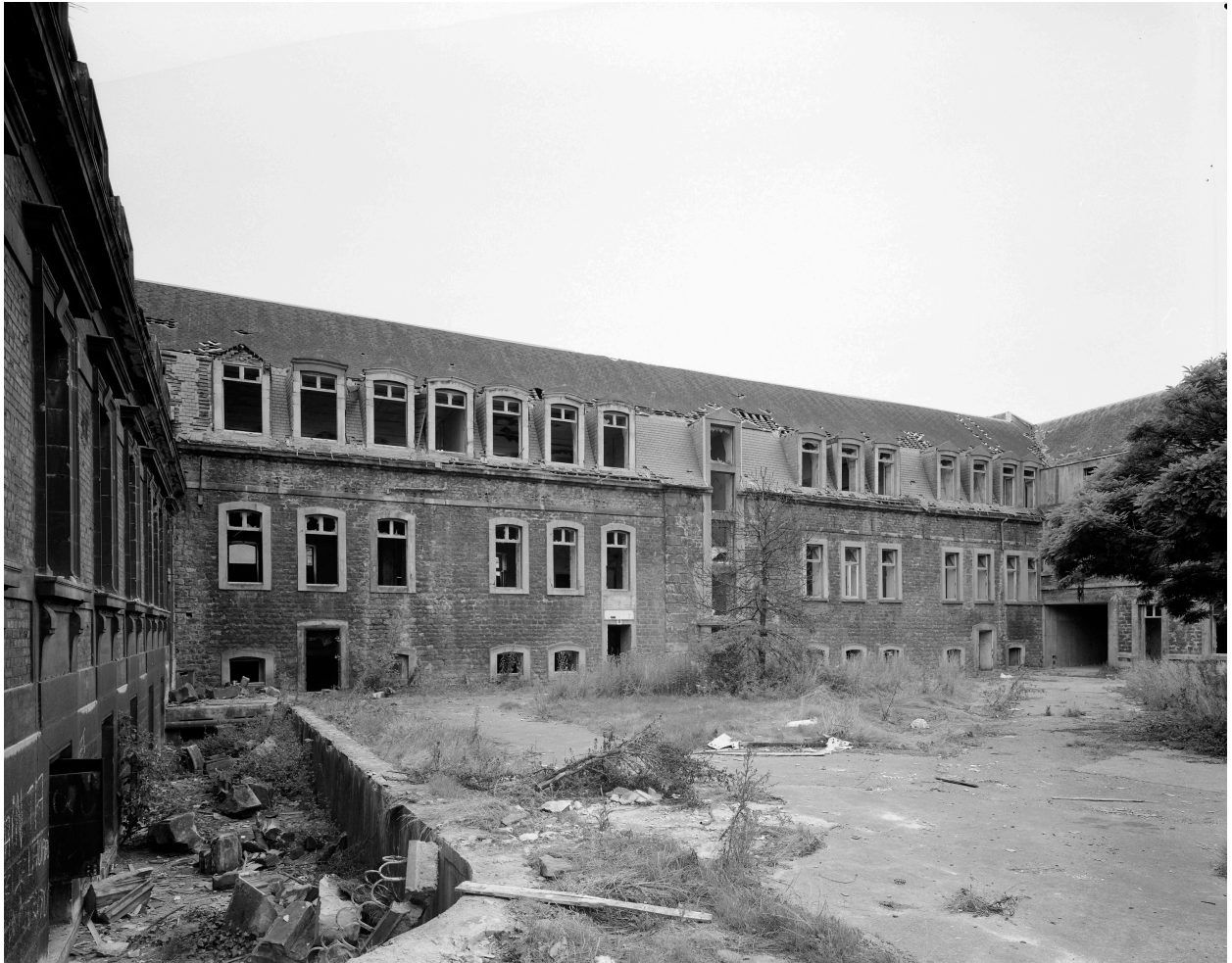
Bâtiment D, façade sur cour.