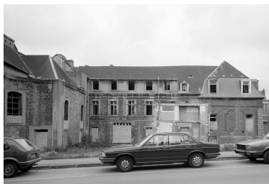
Bâtiment C, partie est, façade partielle rue du Vivier. IVR31_19846200143X