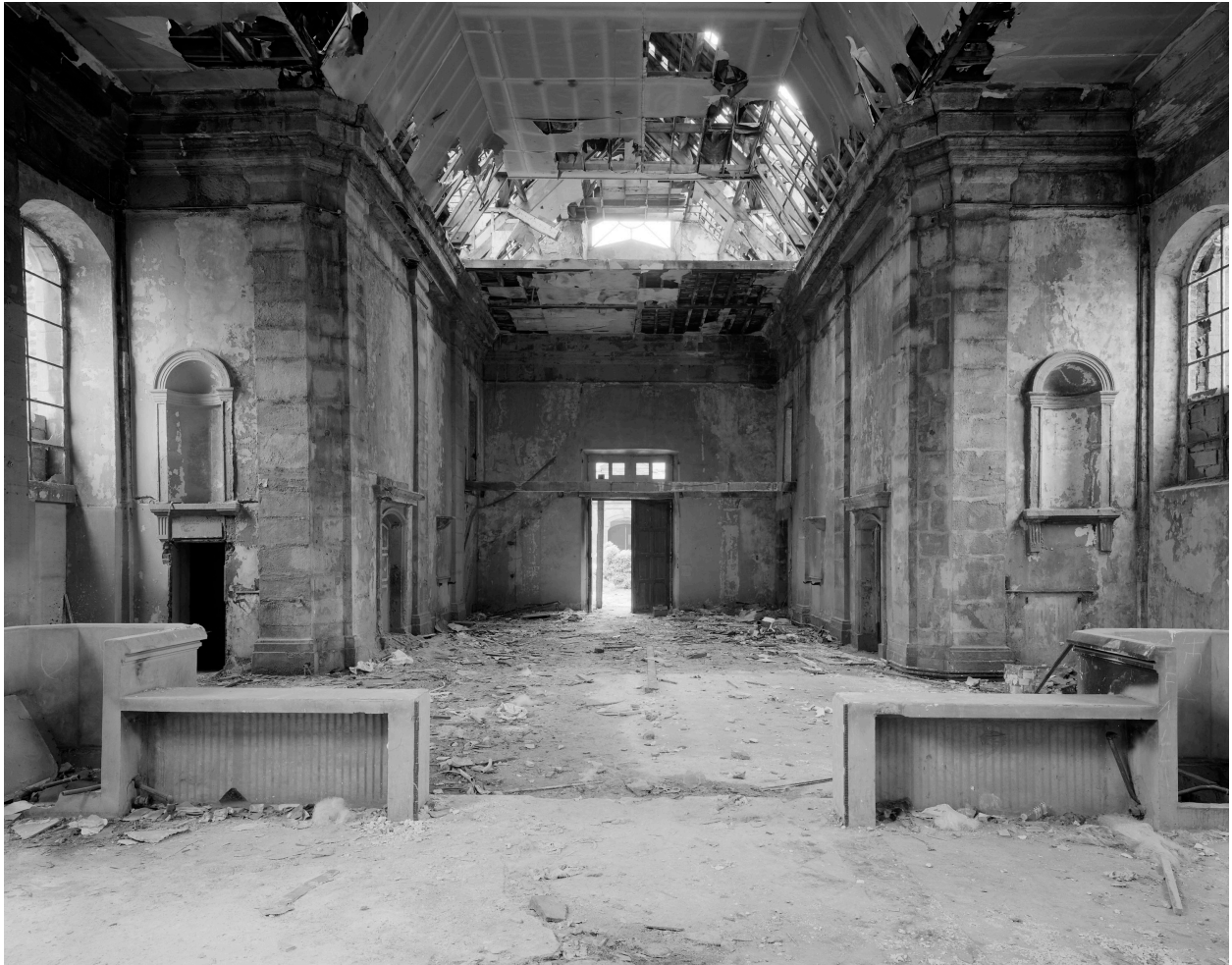
Chapelle, vue intérieure vers entrée.