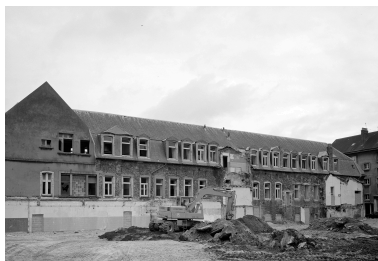
Bâtiment D, façade ouest. IVR31_19846200124X