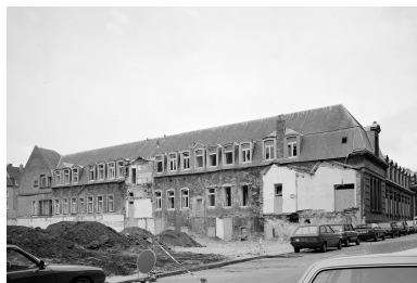
Bâtiment D, vue d'angle de la rue Saint-Louis. IVR31_19846200162X