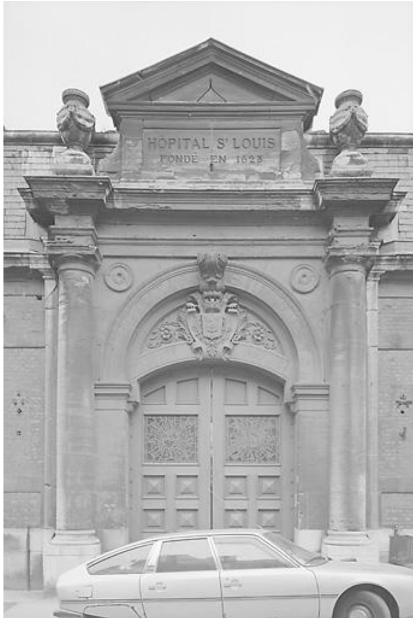
Bâtiment A, portail d'entrée, façade sur voie.