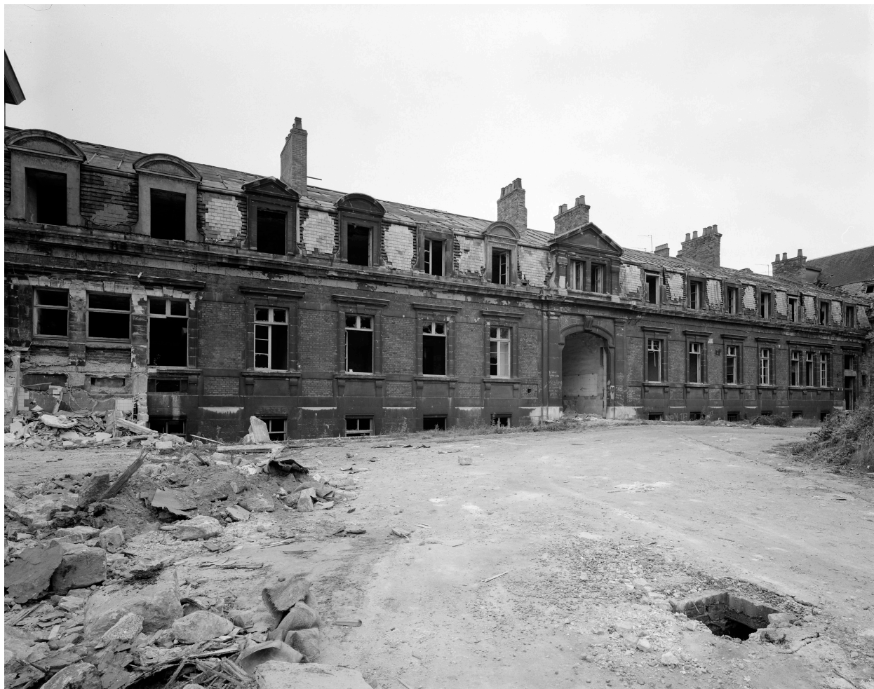
Bâtiment A, façade sur cour.