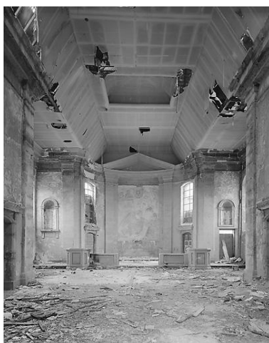
Chapelle, vue intérieure vers chœur.