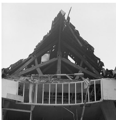
Bâtiment B, charpente. IVR31_19886200682X