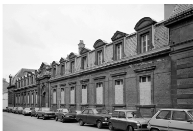
Bâtiment A, corps central, façade sur rue Saint-Louis. IVR31_19846200166X