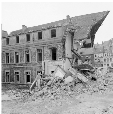
Bâtiment C, façade sur cour, partie nord. IVR31_19886200666X