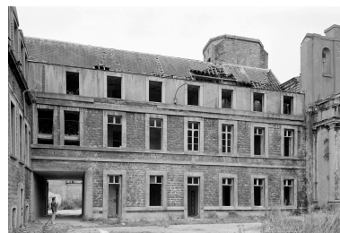
Bâtiment C, partie ouest, façade sur cour. IVR31_19886200651X