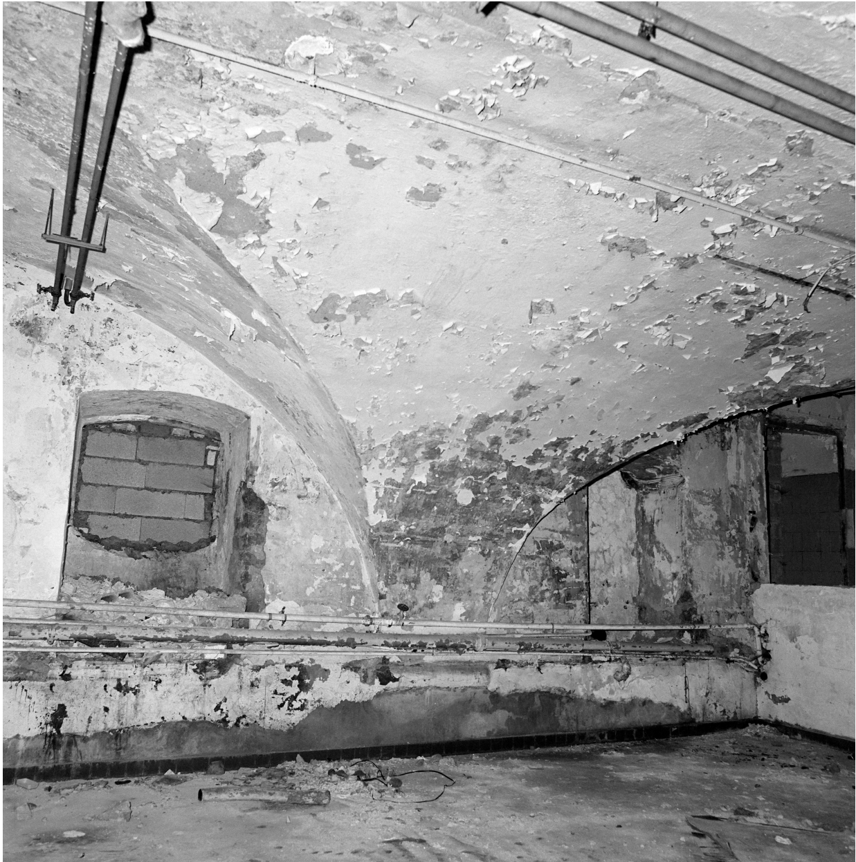
Bâtiment D, sous-sol, voûtement, retombée de voûte.