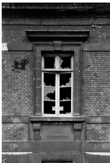
Bâtiment A, façade sur cour, fenêtres. IVR31_19886200659X