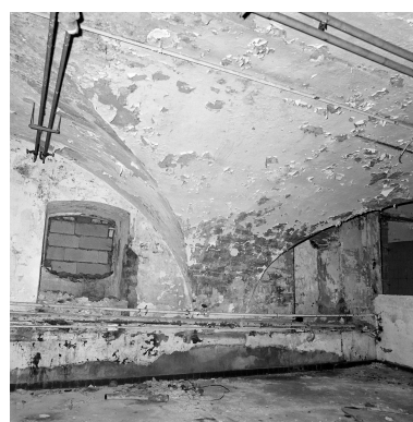
Bâtiment D, sous-sol, voûtement, retombée de voûte.