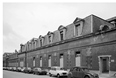
Bâtiment A, partie est, façade sur rue Saint-Louis. IVR31_19846200165X