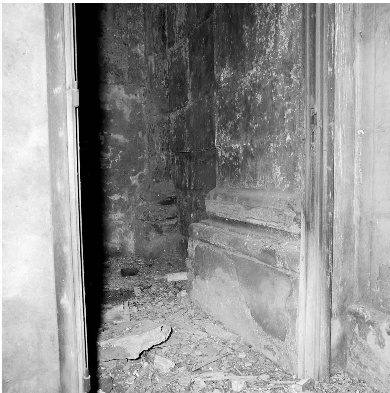
Chapelle, pilastre, base.