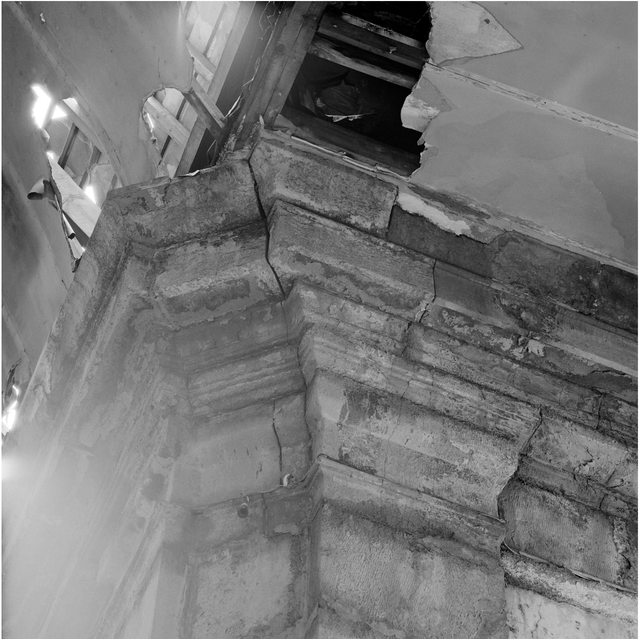
Chapelle, transept ouest, pilastres d'angle, chapiteaux.