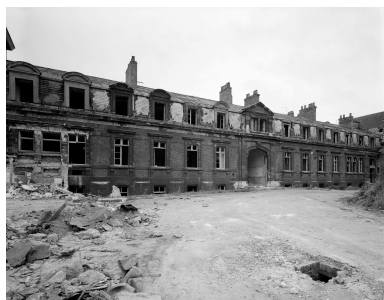
Bâtiment A, façade sur cour. IVR31_19886200645V