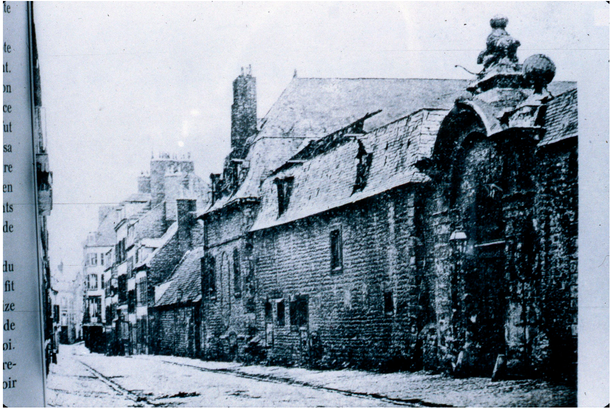
Vue générale en 1893. Extrait : MALO, H., petite histoire de Boulogne-sur-Mer, p. 104.