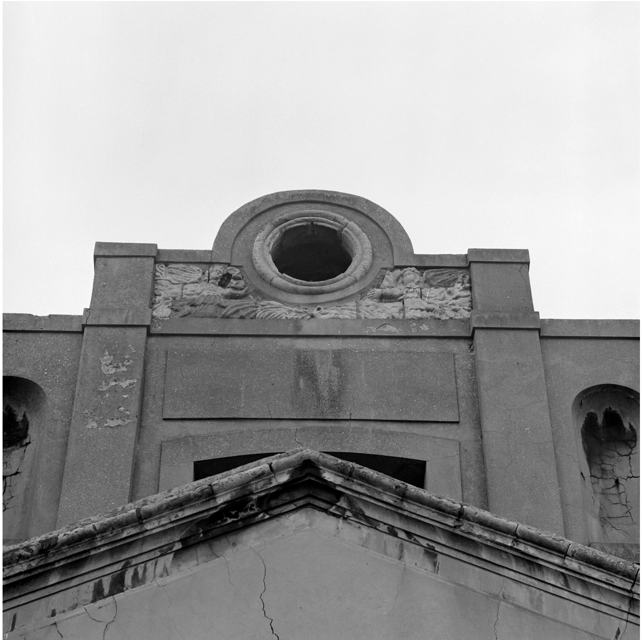
Chapelle, façade sur cour, oculus.