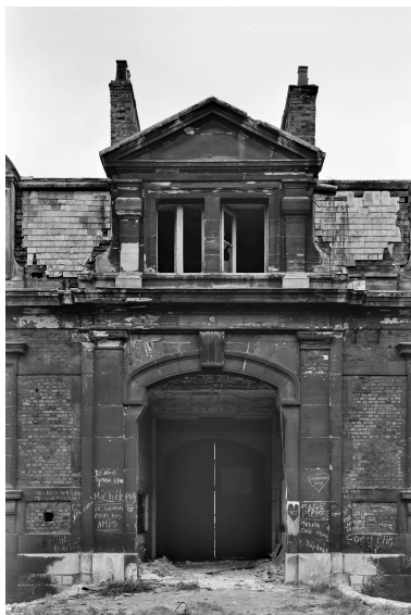
Bâtiment A, portail d'entrée, façade sur cour. IVR31_19886200660X