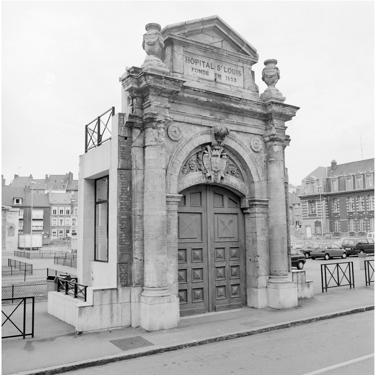
Bâtiment A, portail d'entrée, état en 1994.