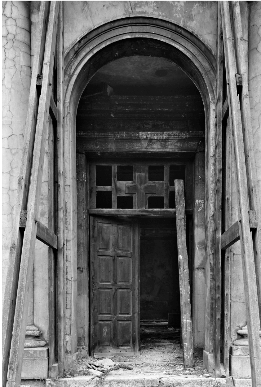
Chapelle, porte, façade sur cour.