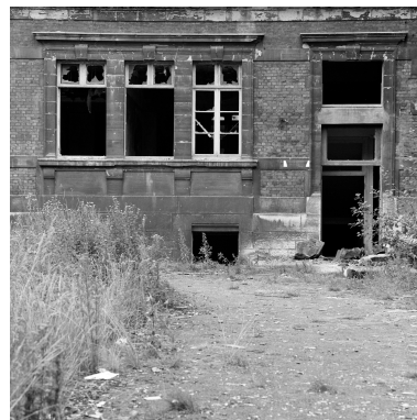
Bâtiment A, façade sur cour, baies. IVR31_19886200662X