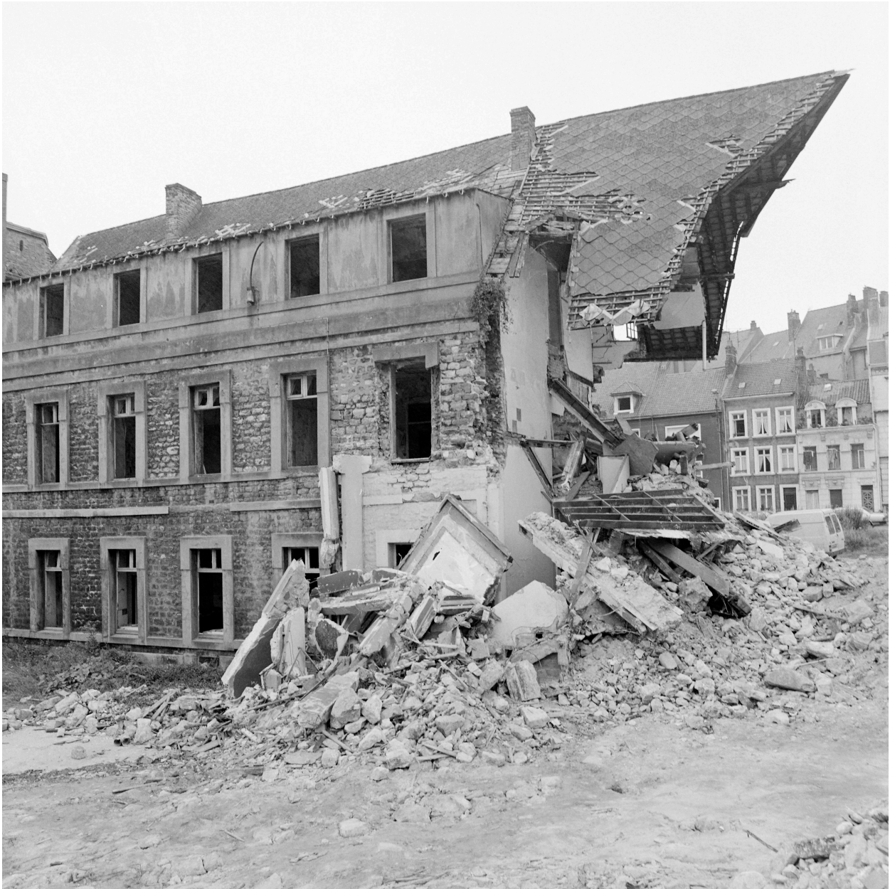
Bâtiment C, façade sur cour, partie nord.