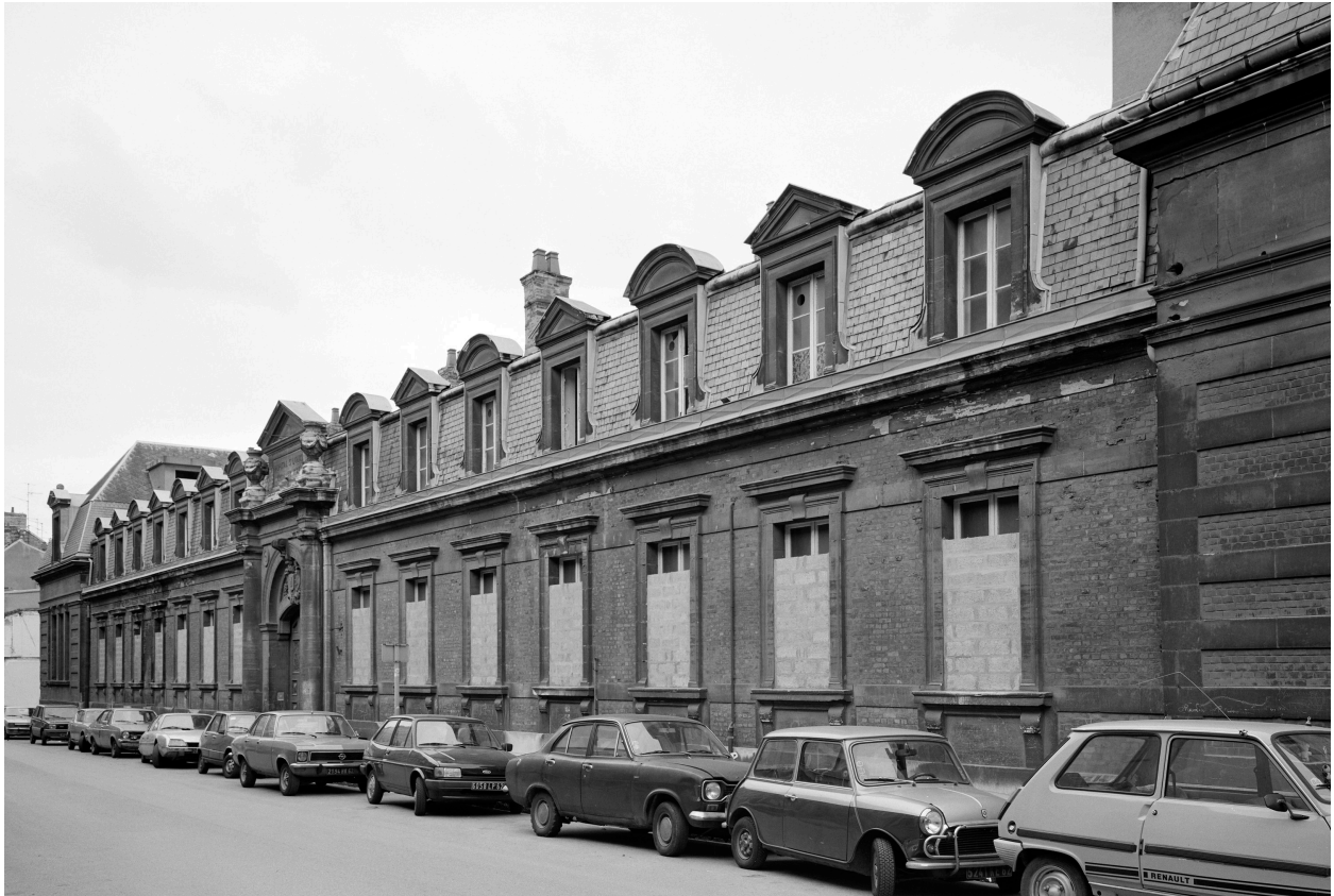
Bâtiment A, corps central, façade sur rue Saint-Louis.