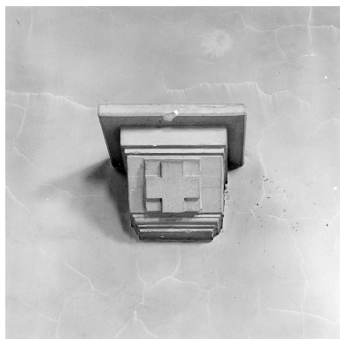
Chapelle, transept ouest, niche. IVR31_19886200654X