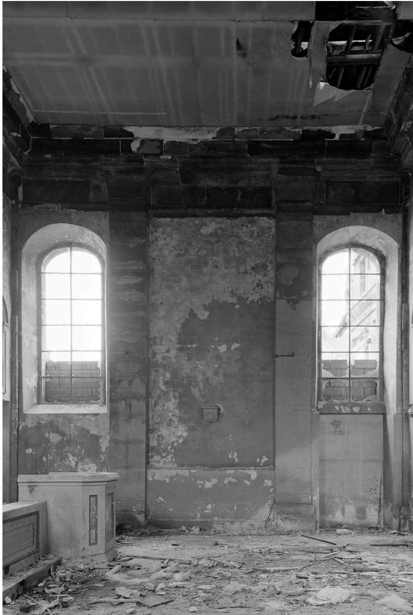
Chapelle, transept est, fenêtres.