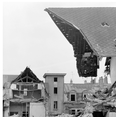
Bâtiments A, B, C : vue d'ensemble de la rue du Vivier. IVR31_19886200661X