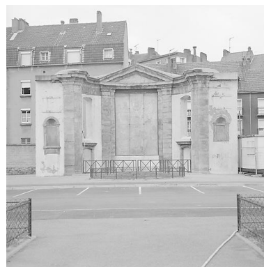
Chapelle, chevet, vestiges conservés.