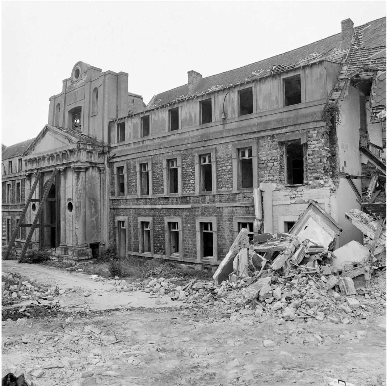
Bâtiment C, chapelle, vue d'ensemble sur cour.