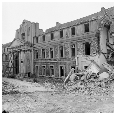
Bâtiment C, chapelle, vue d'ensemble sur cour. IVR31_19886200676X