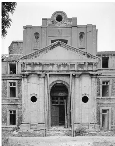
Chapelle, façade sur cour. IVR31_19886200647V