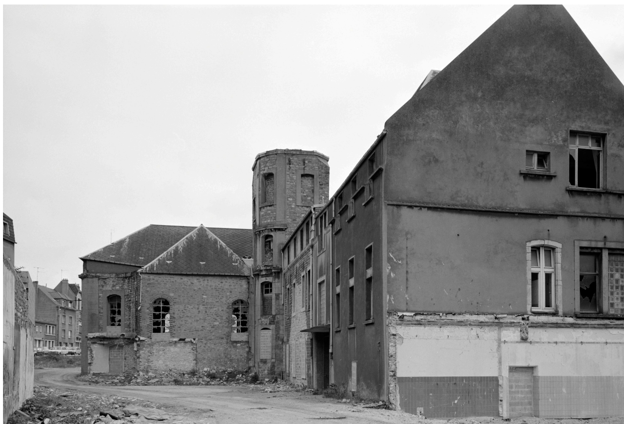
Bâtiment C, chapelle : vue d'ensemble ouest.