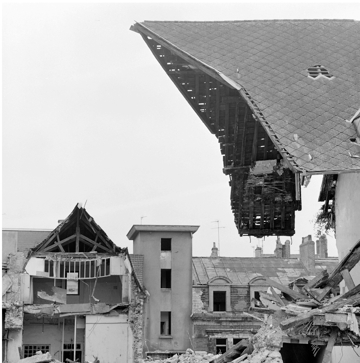
Bâtiments A, B, C : vue d'ensemble de la rue du Vivier.