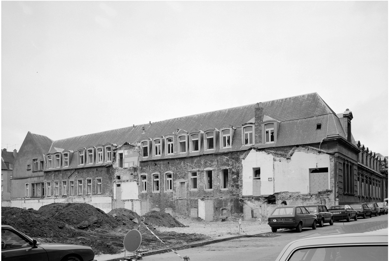
Bâtiment D, vue d'angle de la rue Saint-Louis.