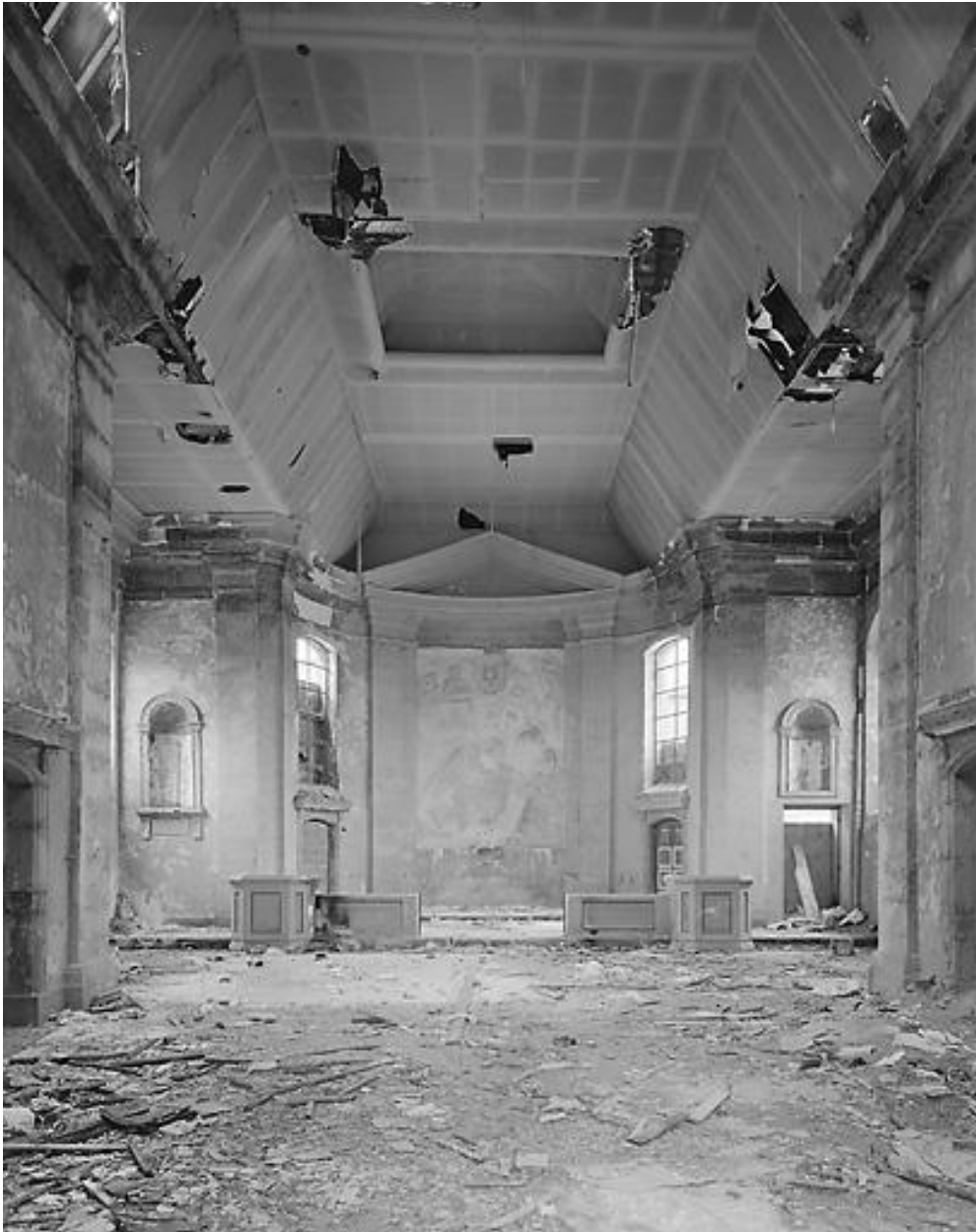
Chapelle, vue intérieure vers chœur.