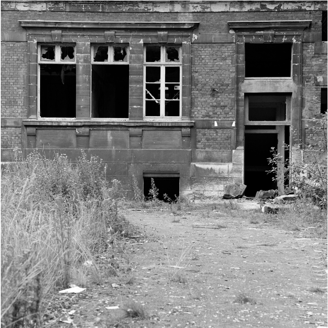
Bâtiment A, façade sur cour, baies.