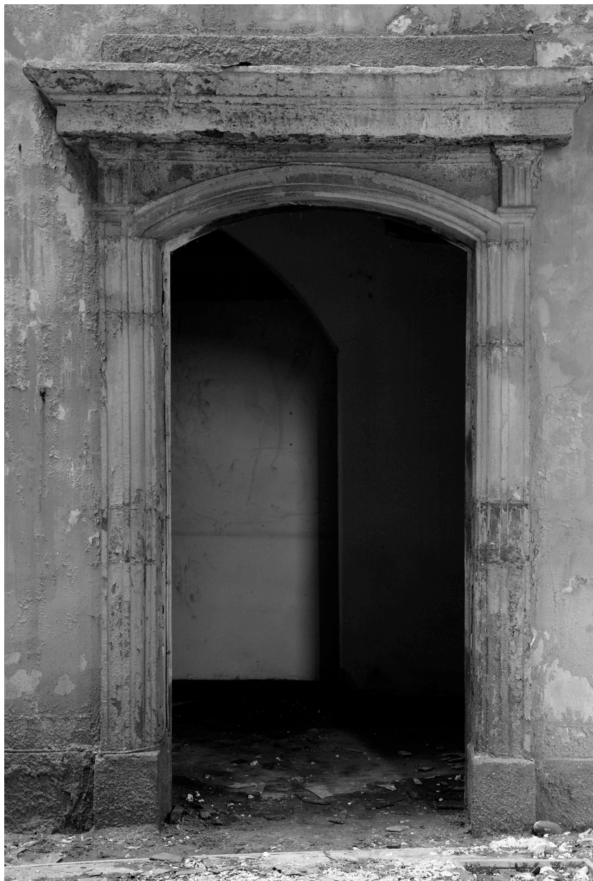
Chapelle, nef, côté ouest, porte.