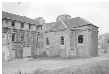
Bâtiment C, chapelle, vue d'ensemble nord rue du Vivier. IVR31_19846200144X