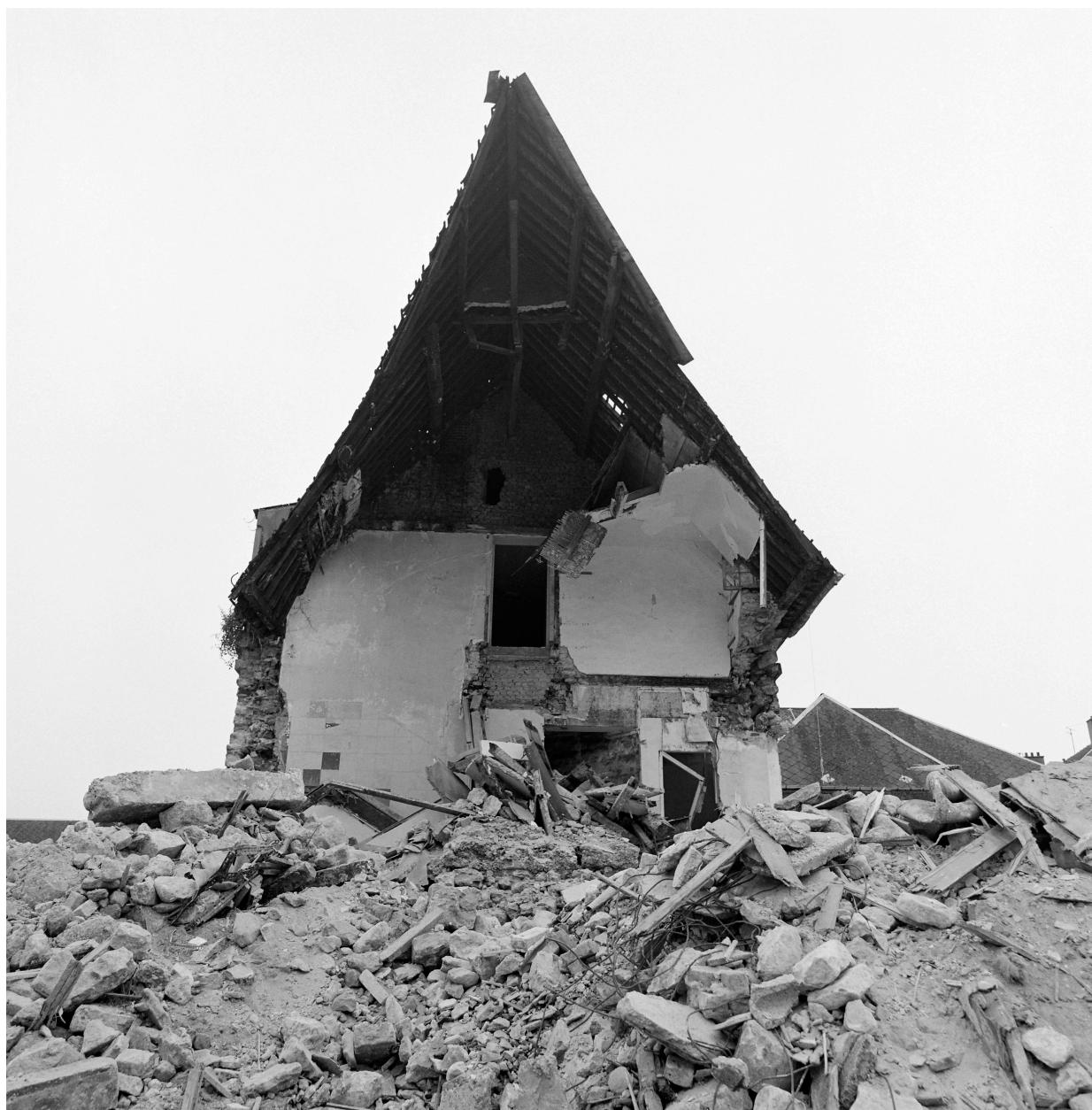
Bâtiment D, charpente.