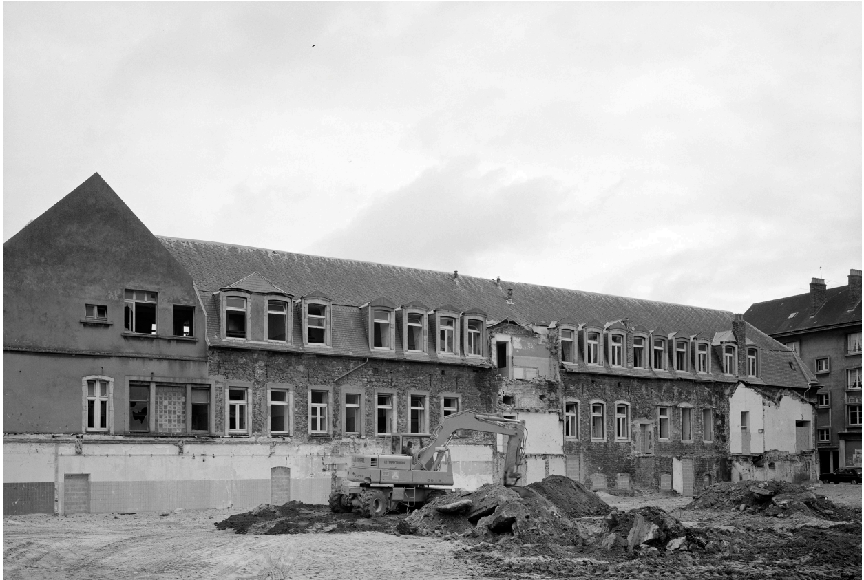
Bâtiment D, façade ouest.