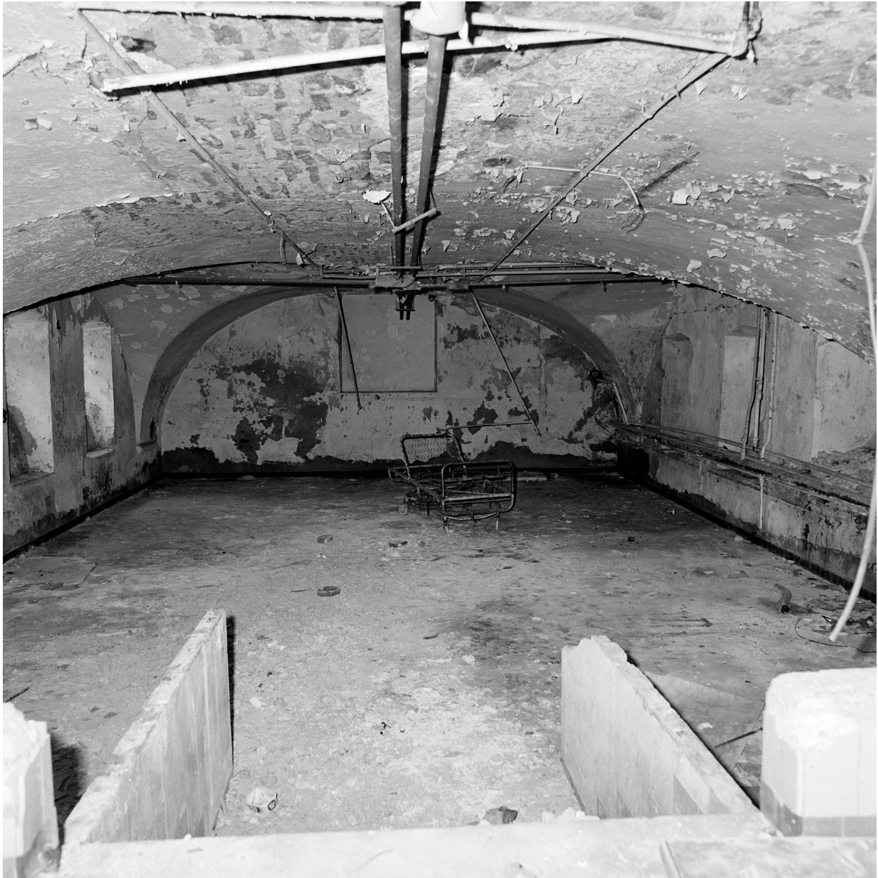
Bâtiment D, sous-sol, voûtement, vue de l'escalier.