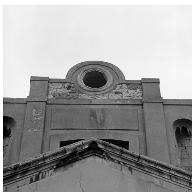
Chapelle, façade sur cour, oculus. IVR31_19886200663X