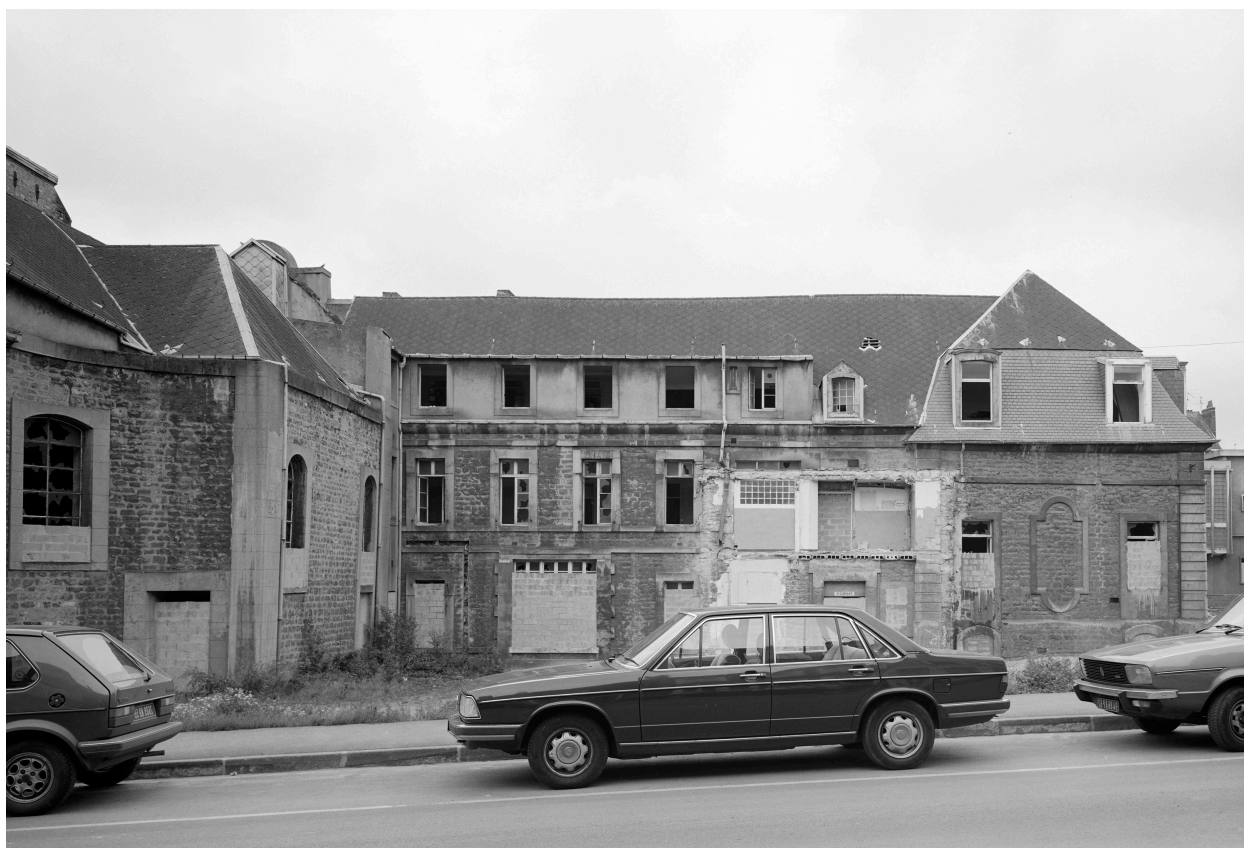
Bâtiment C, partie est, façade partielle rue du Vivier.