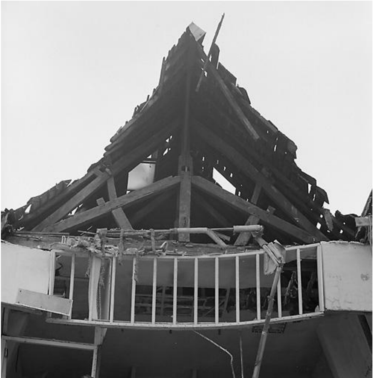
Bâtiment B, charpente.