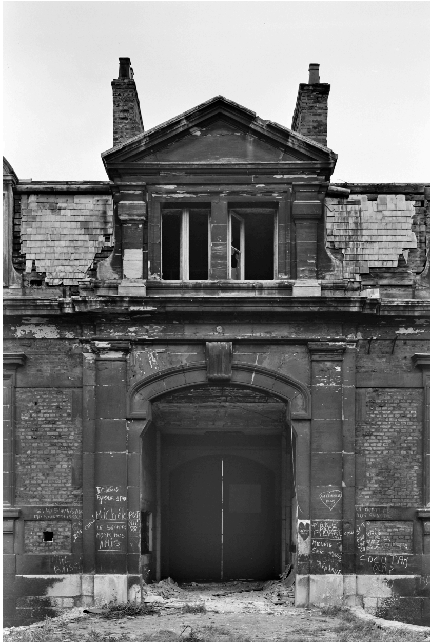
Bâtiment A, portail d'entrée, façade sur cour.