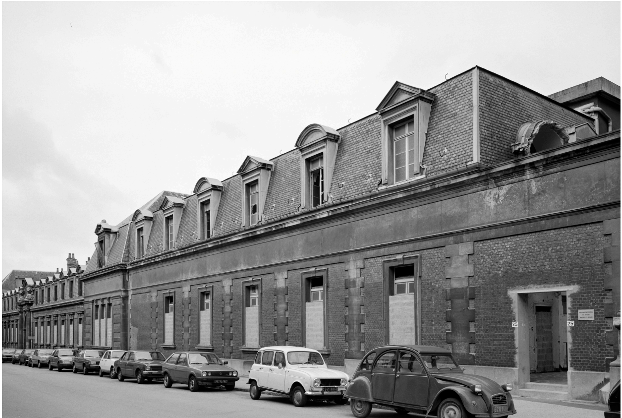
Bâtiment A, partie est, façade sur rue Saint-Louis.