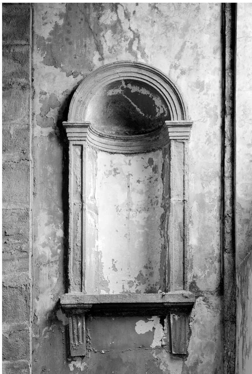
Chapelle, transept ouest, niche.