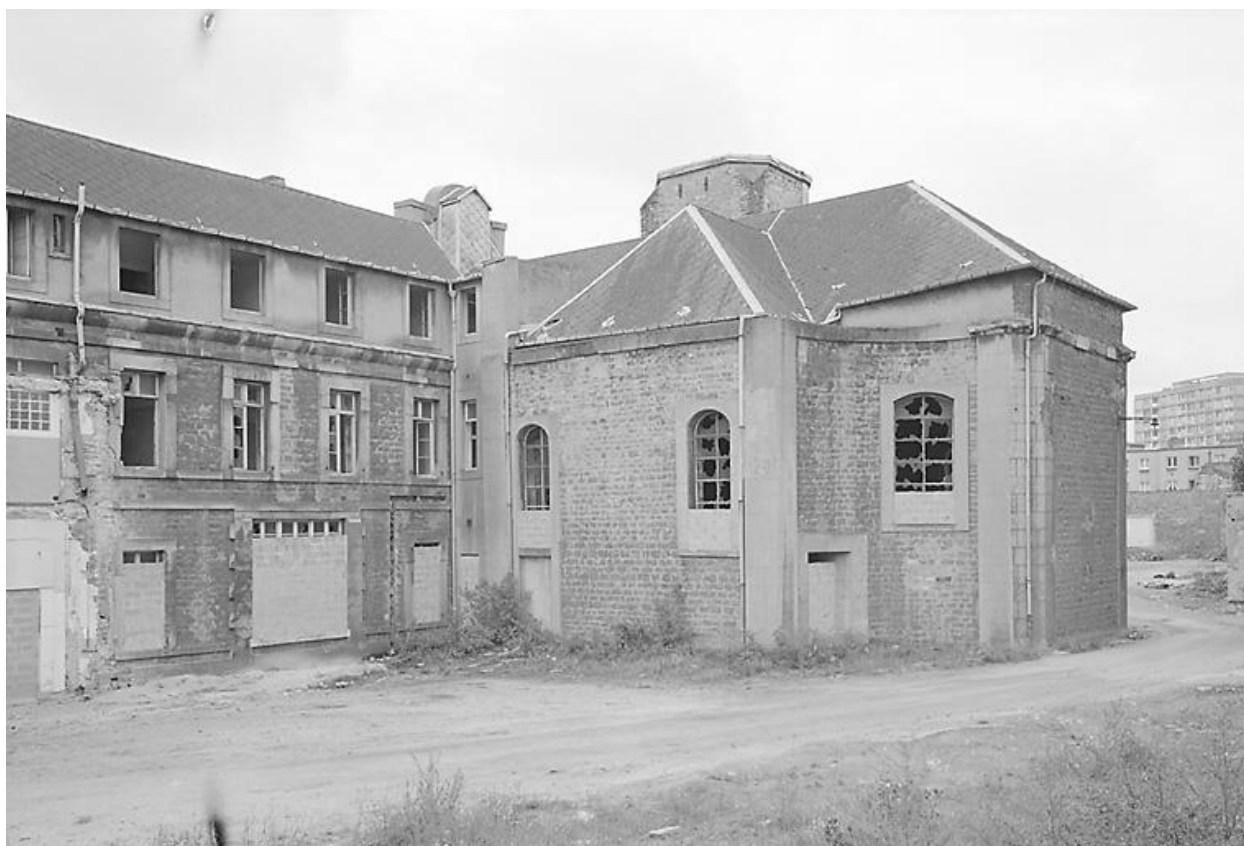
Bâtiment C, chapelle, vue d'ensemble nord rue du Vivier.