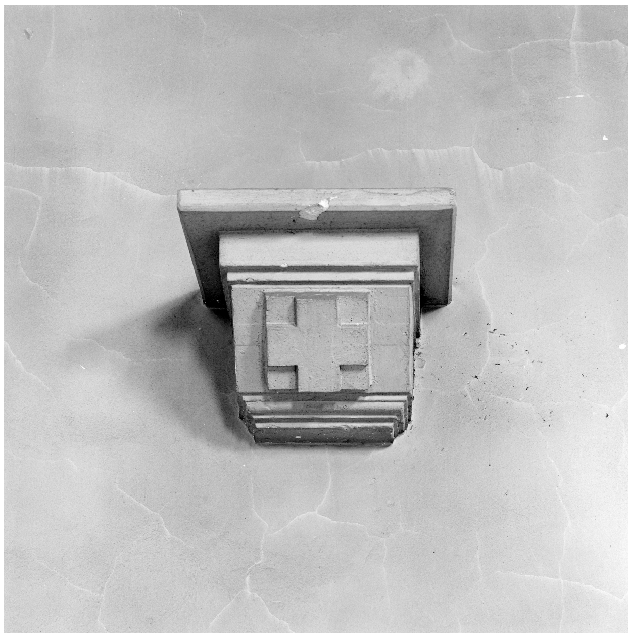
Chapelle, transept ouest, console.