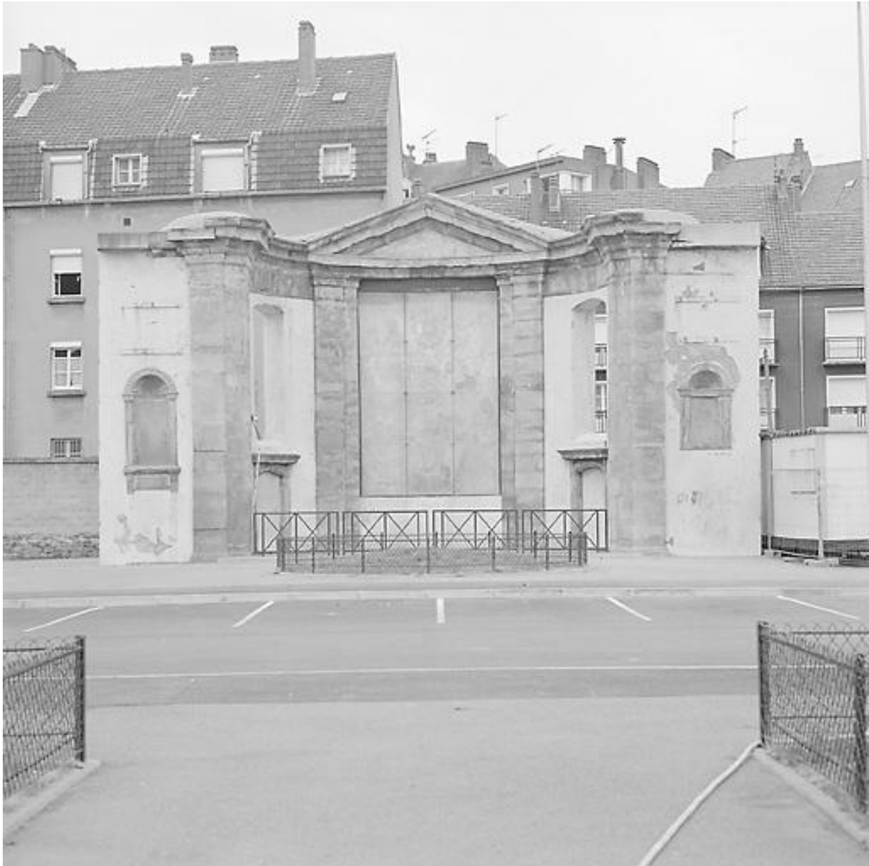
Chapelle, chevet, vestiges conservés.