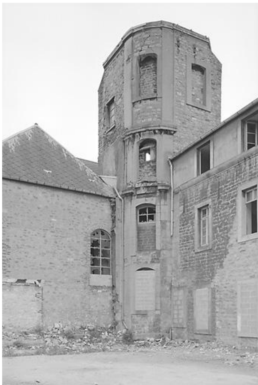
Chapelle, clocher, vue d'angle de la rue du Vivier.