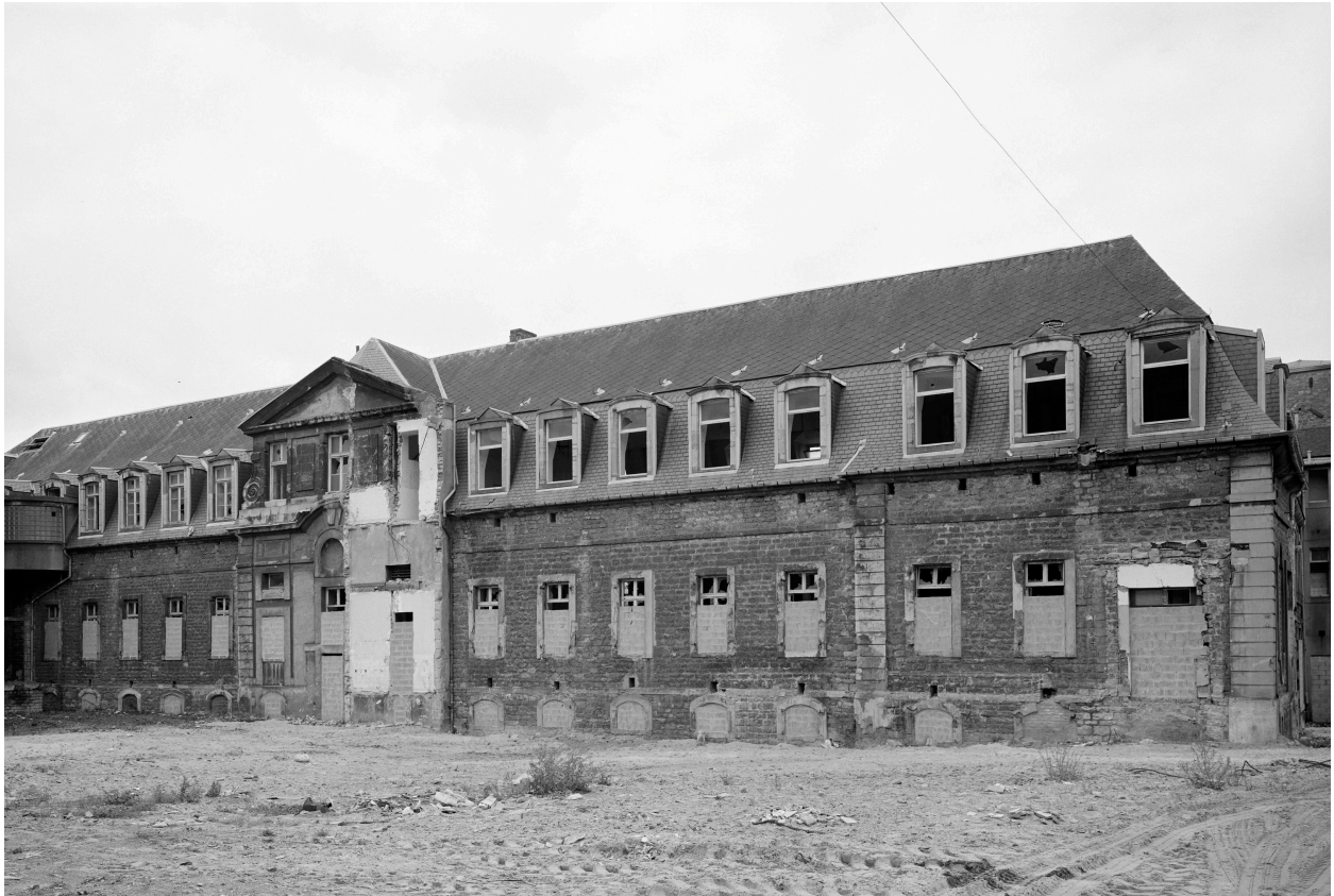
Bâtiment B, façade est sur cour.