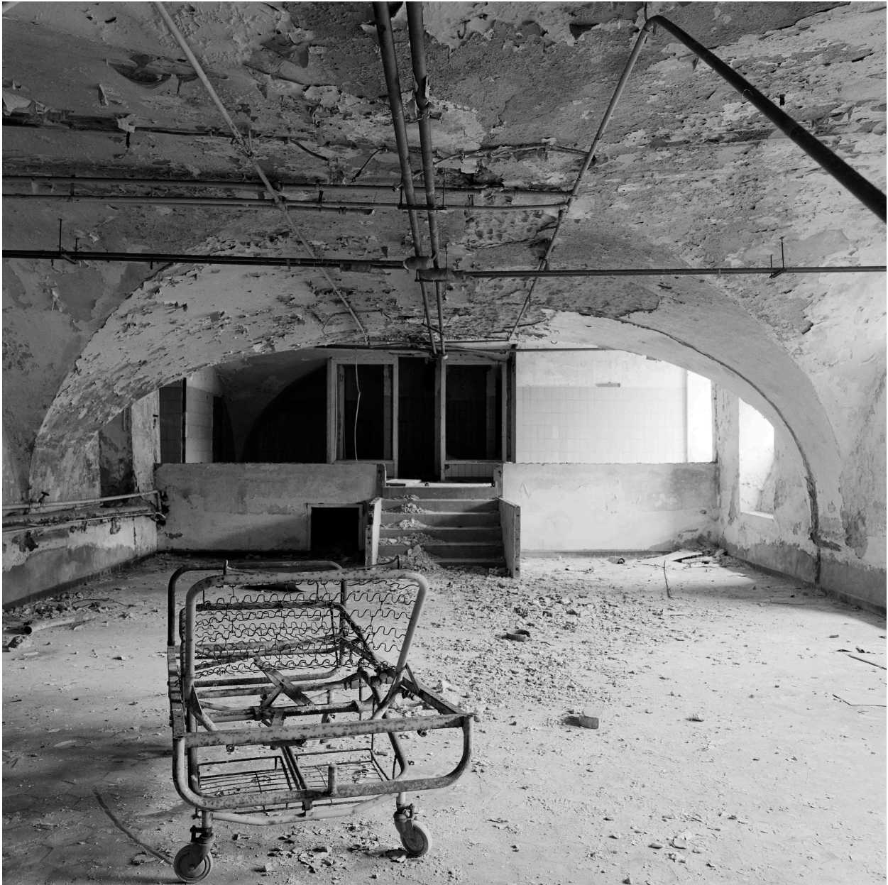
Bâtiment D, sous-sol, voûtement, vue vers l'escalier.