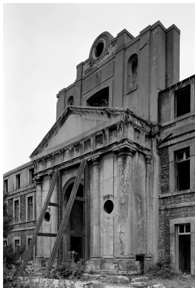
Chapelle, entrée : vue d'angle sur cour.