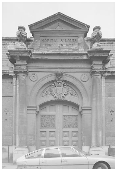
Bâtiment A, portail d'entrée, façade sur voie. IVR31_19846200161X