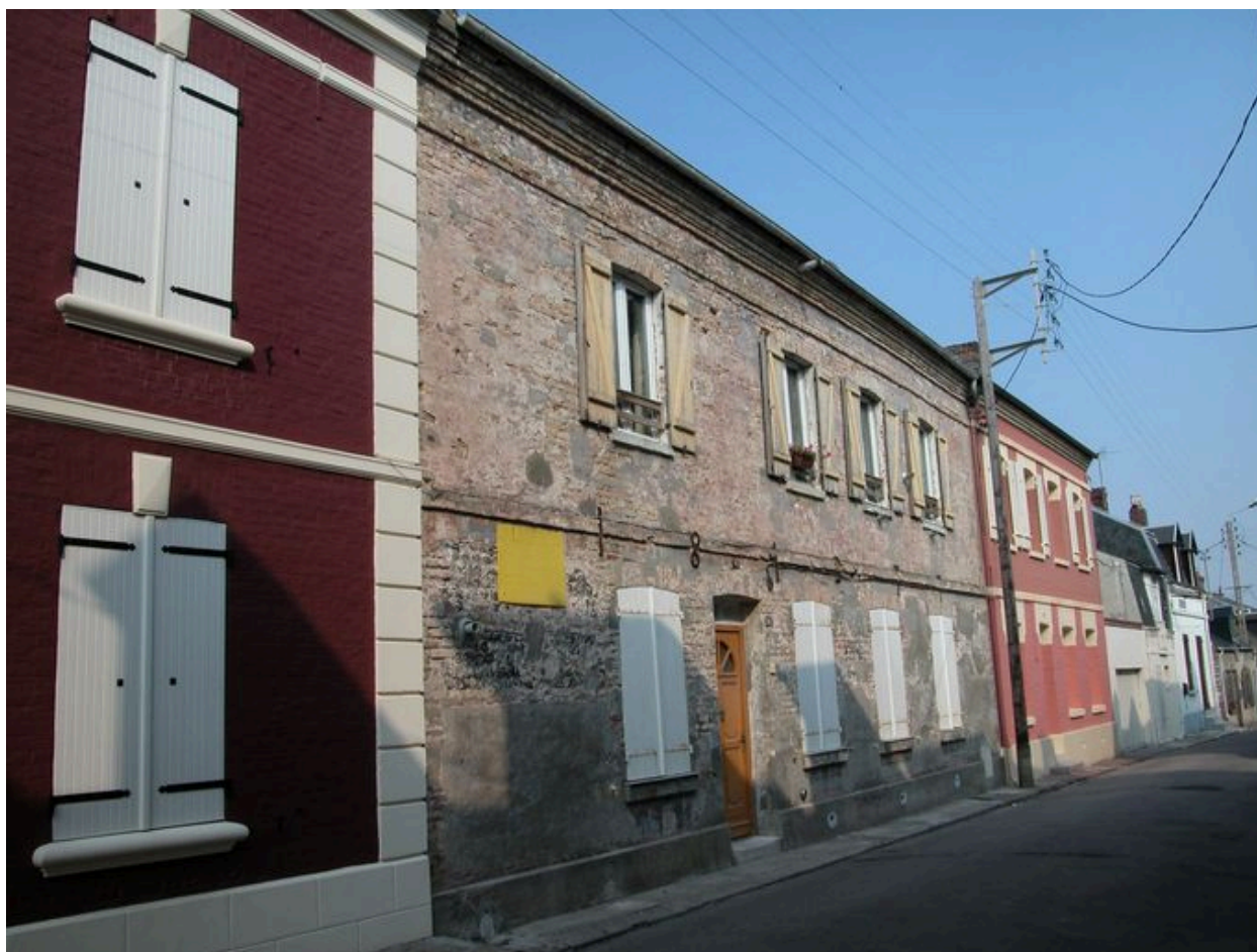
Maison, 11 rue Boyard (1988 BE 278), porte la date 1842.