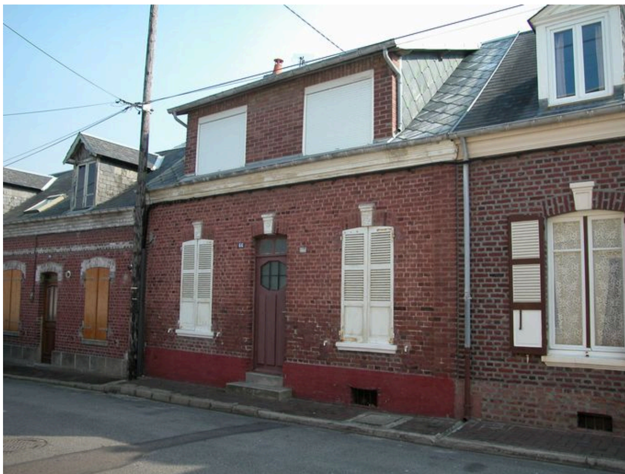
Maison (44 rue Parmentier) portant une plaque émaillée 'eau de source analysée et autorisée'.