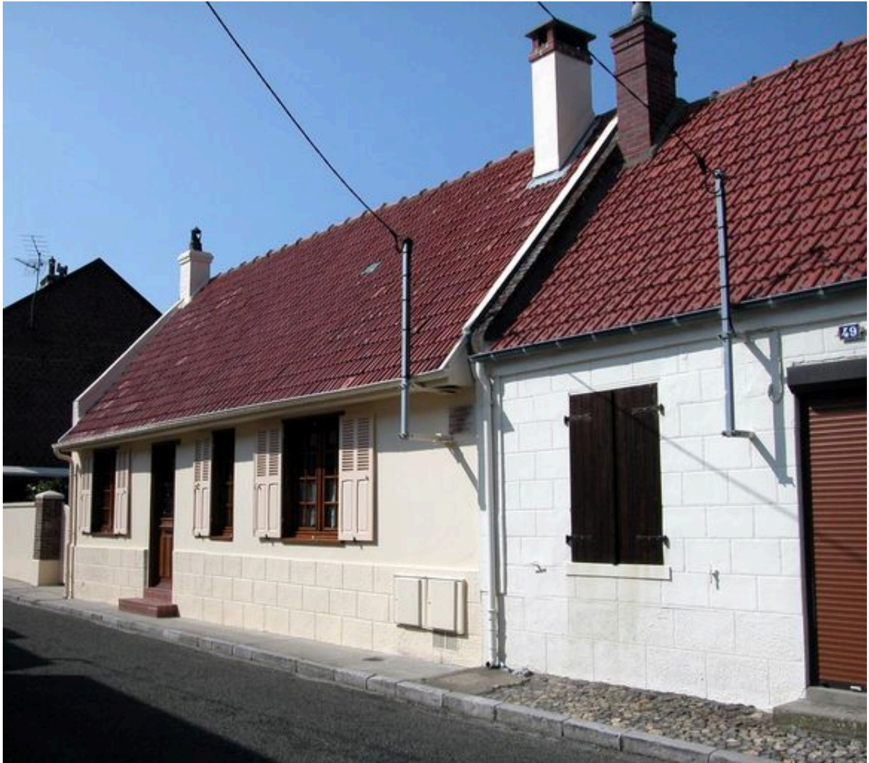
Maison natale d'Anatole-Mopin, maire de la commune entre 1908 et 1940 (47 rue Anatole-Mopin, 1988 BH 17).