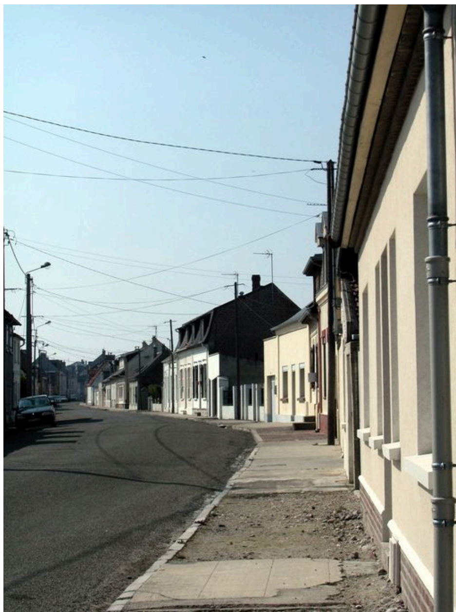
La rue Anatole-Mopin, ancienne rue à Baudet.