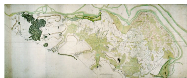
Plan du Marquenterre, de la baie de Somme à la baie d'Authie au 18e siècle.