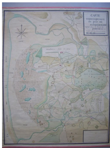
Carte topographique du pays de Marquenterre levée en 1737. IVR22_20078005991NUCAB