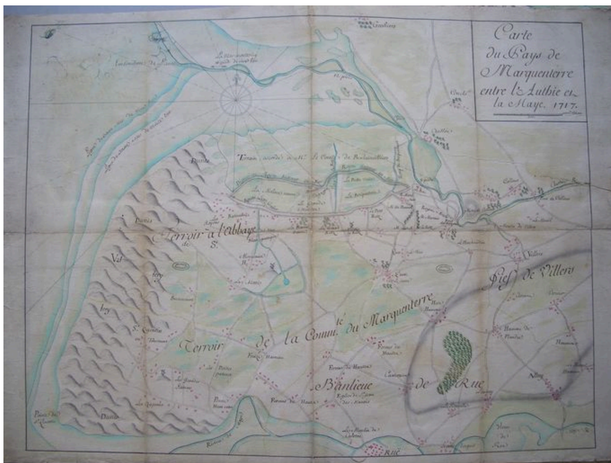
Carte du pays du Marquenterre entre l'Authie et la Maye en 1717.