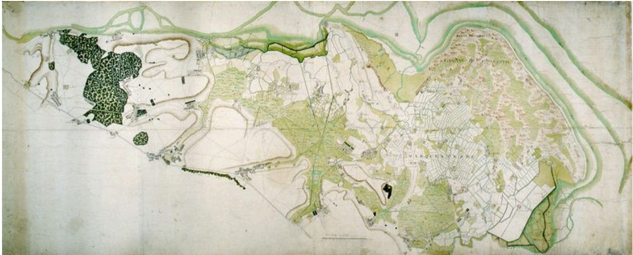
Plan du Marquenterre, de la baie de Somme à la baie d'Authie au 18e siècle.