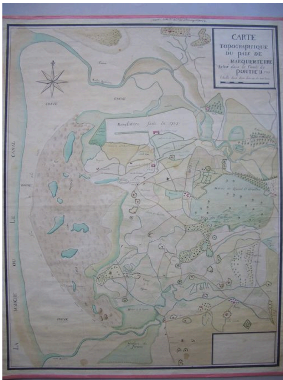
Carte topographique du pays de Marquenterre levée en 1737.