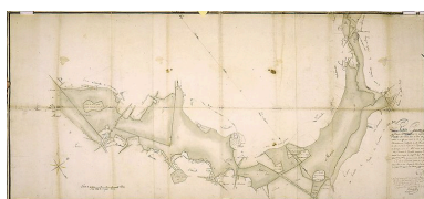
Plan de délimitation des marais de Ponthoile et de Noyelles au 19e siècle. IVR22_20078000039XAB