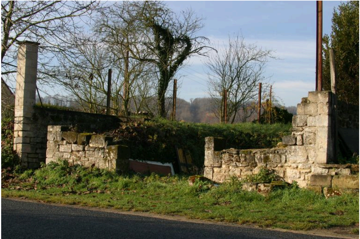
Vue de fondations d'une maison non reconstruite.