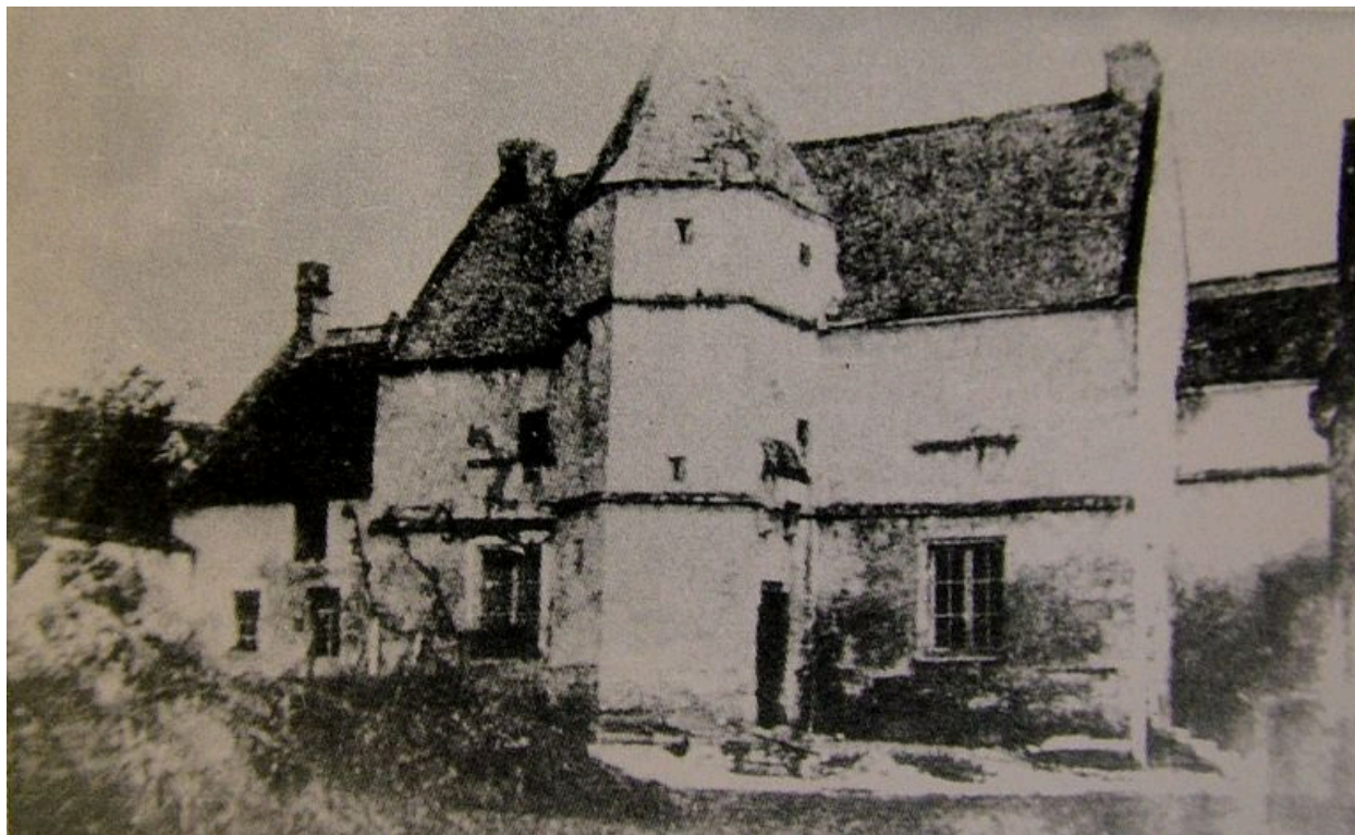
Vue de l'ancien château du 16e siècle.