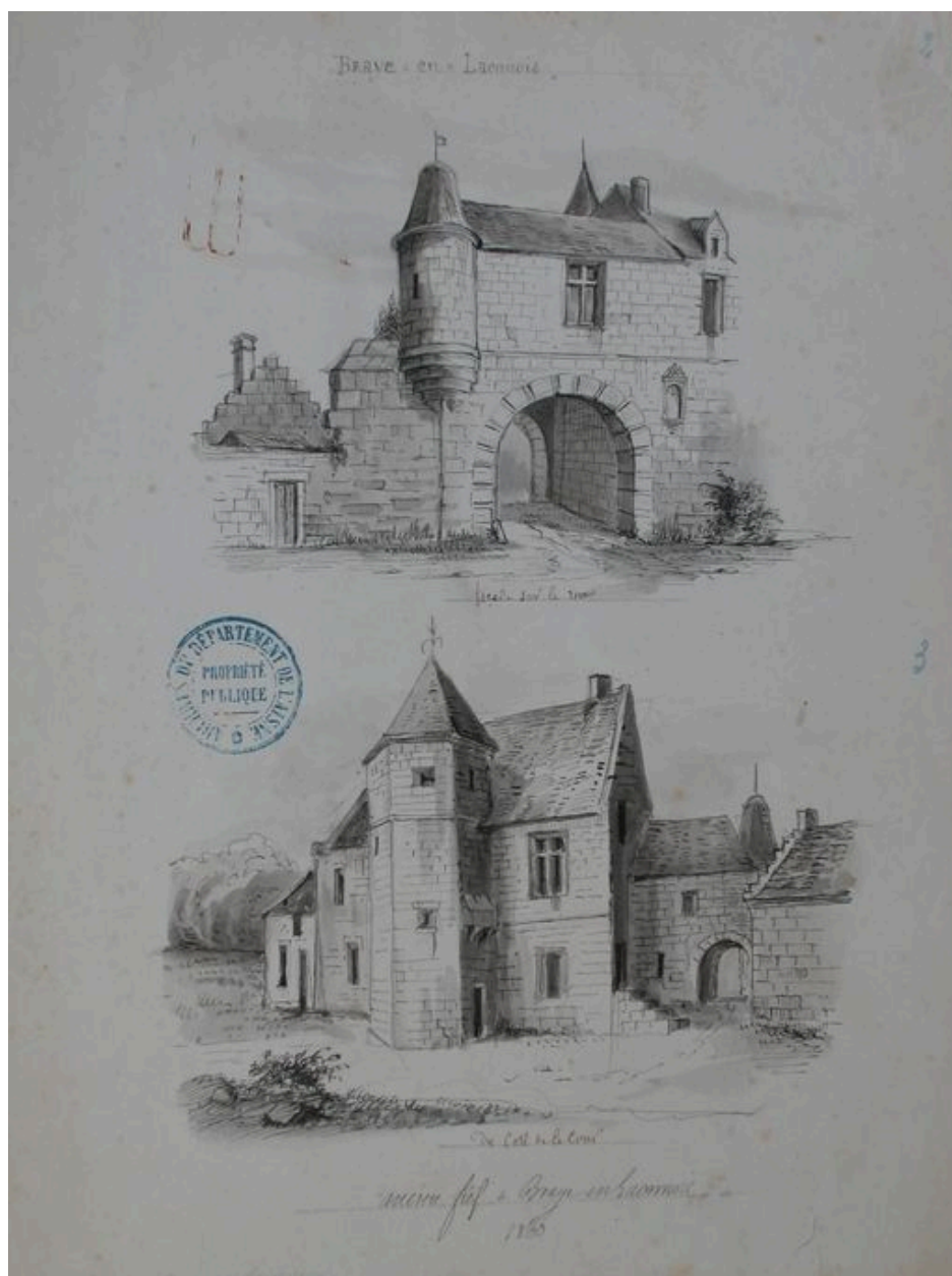
Dessin de l'ancien château du village par Amédée Piette (AD Aisne : 8 Fi Bray-en-Laonnois 2).