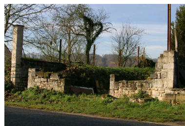
Vue de fondations d'une maison non reconstruite. IVR22_20030202100NUCA