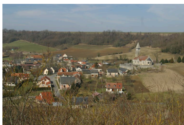
Vue générale. IVR22_20050200709NUCA