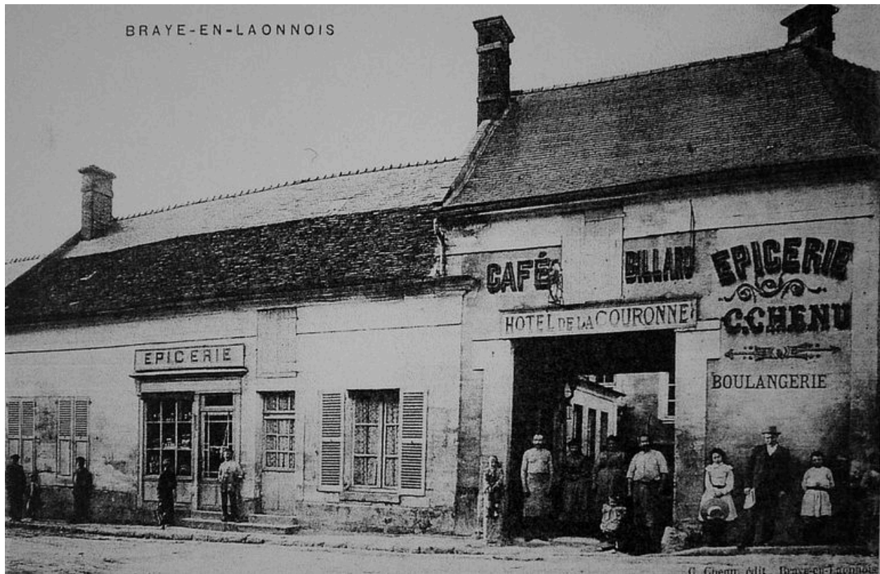
Vue ancienne d'un commerce de Braye-en-Laonnois.