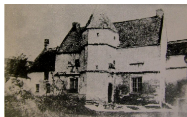
Vue de l'ancien château du 16e siècle (coll. part).