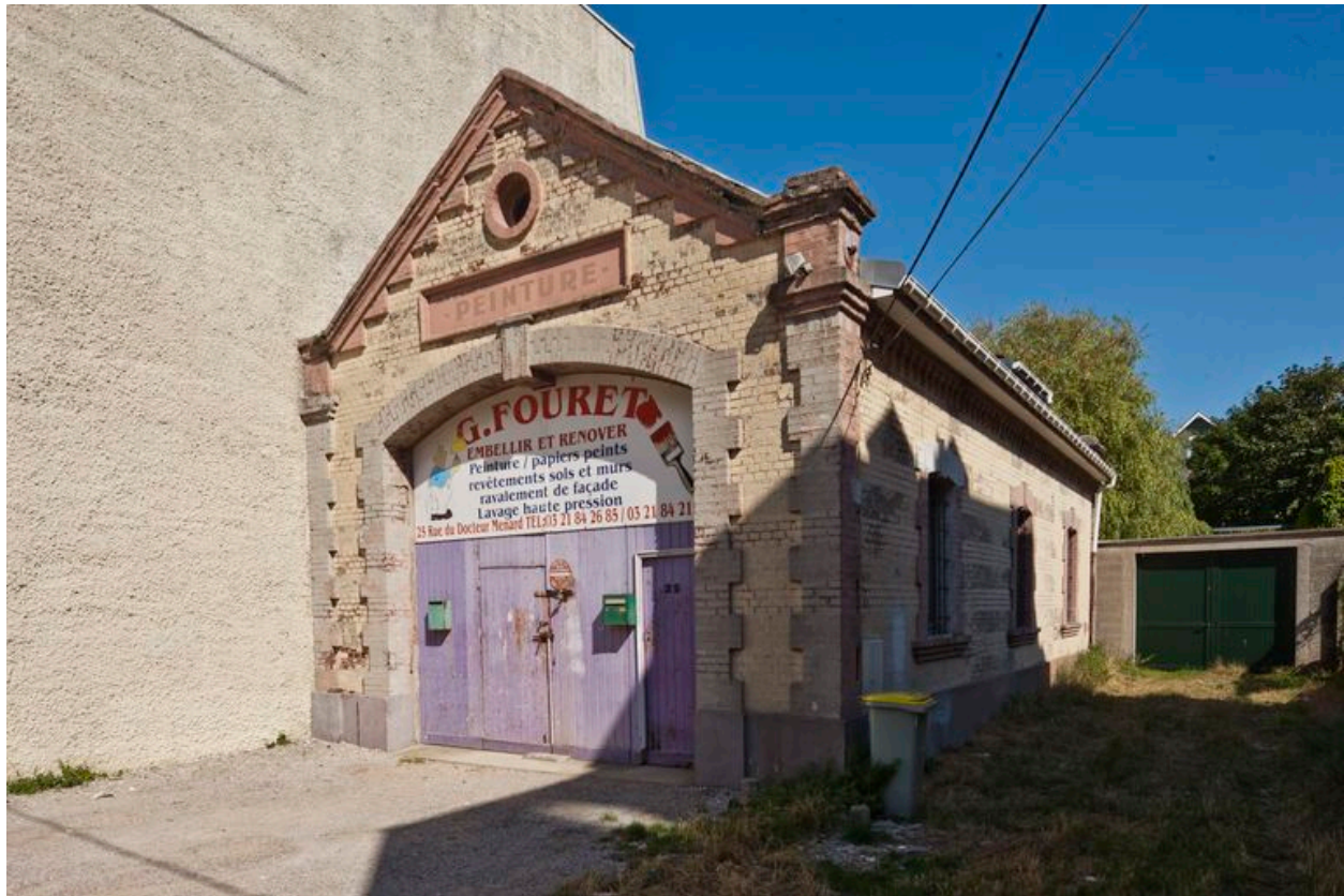
Vue générale de trois quarts.