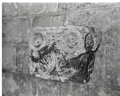
Le chapiteau, vu de trois-quarts. IVR22_20020200167X