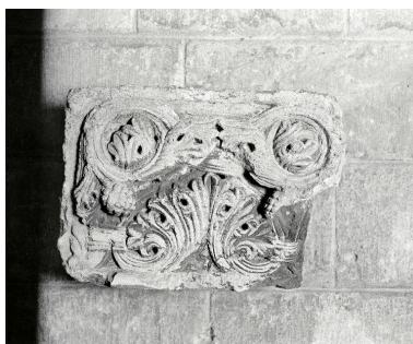
Le chapiteau, vu de face. IVR22_20020200168X