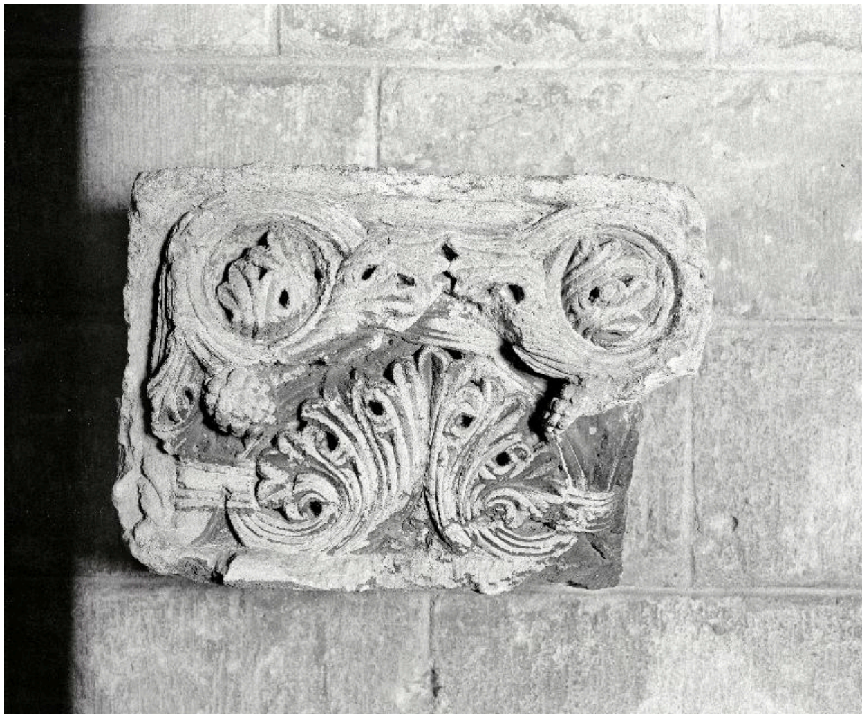
Le chapiteau, vu de face.