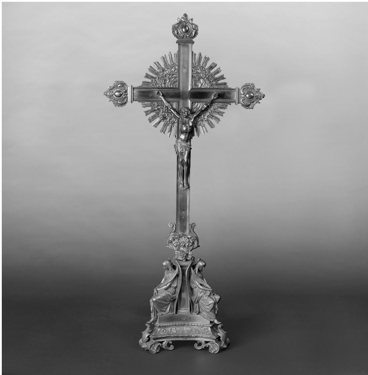
Croix d'autel, face.