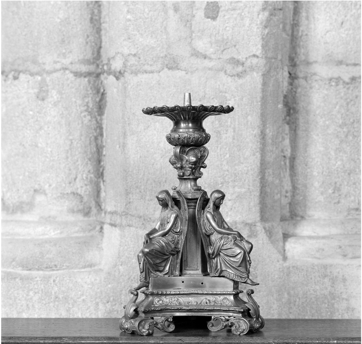
Chandelier d'autel, 4 : vue d'un élément.