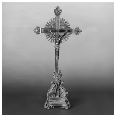
Croix d'autel, face.