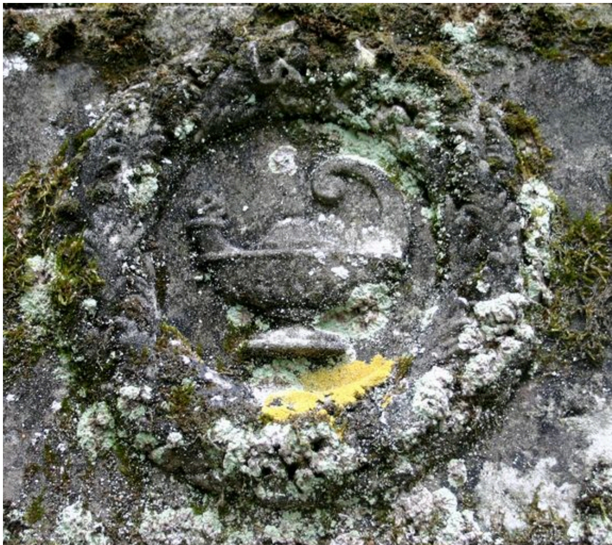
Détail du décor sculpté de la face gauche, représentant une couronne de feuilles de chêne et de branches de cyprès ornée, au centre, d'une lampe sépulcrale.