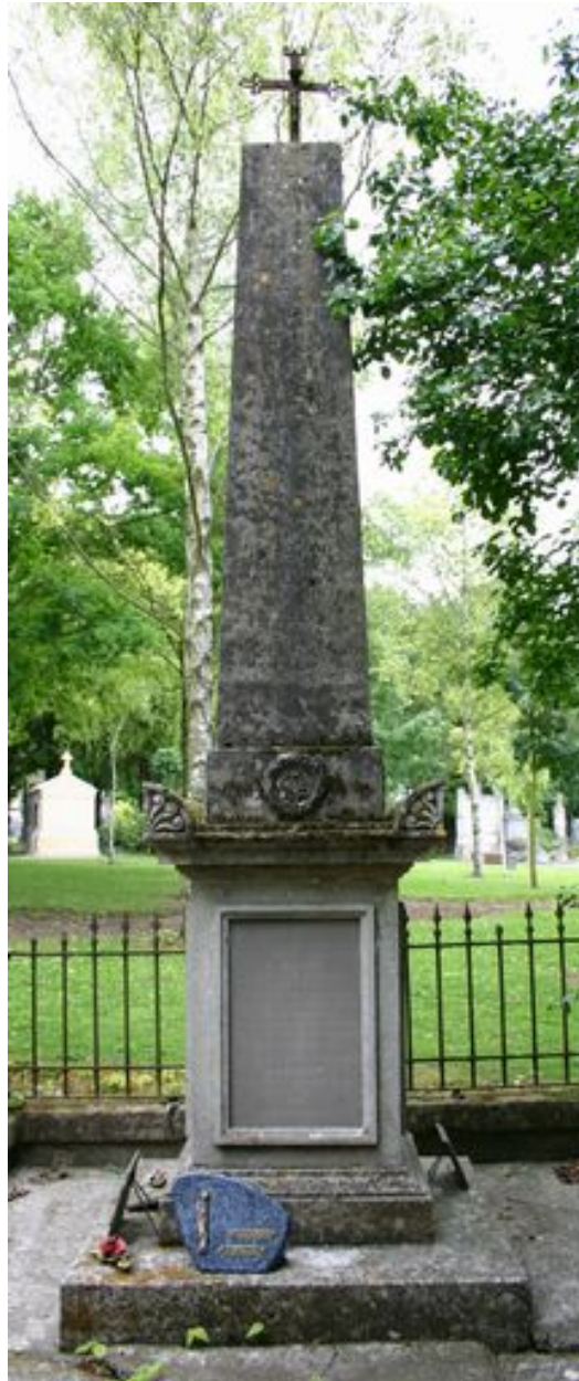
Cippe en forme d'obélisque, Cheussey (architecte), Duthoit (sculpteur), Polart (entrepreneur), vers 1823.