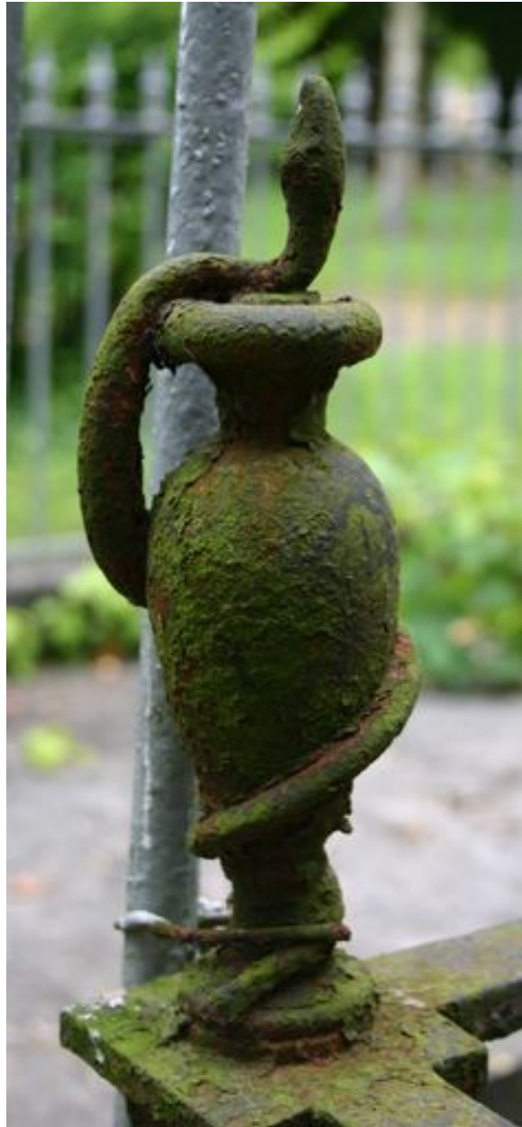
Détail de l'ornementation de la grille de clôture, représentant un caducée.