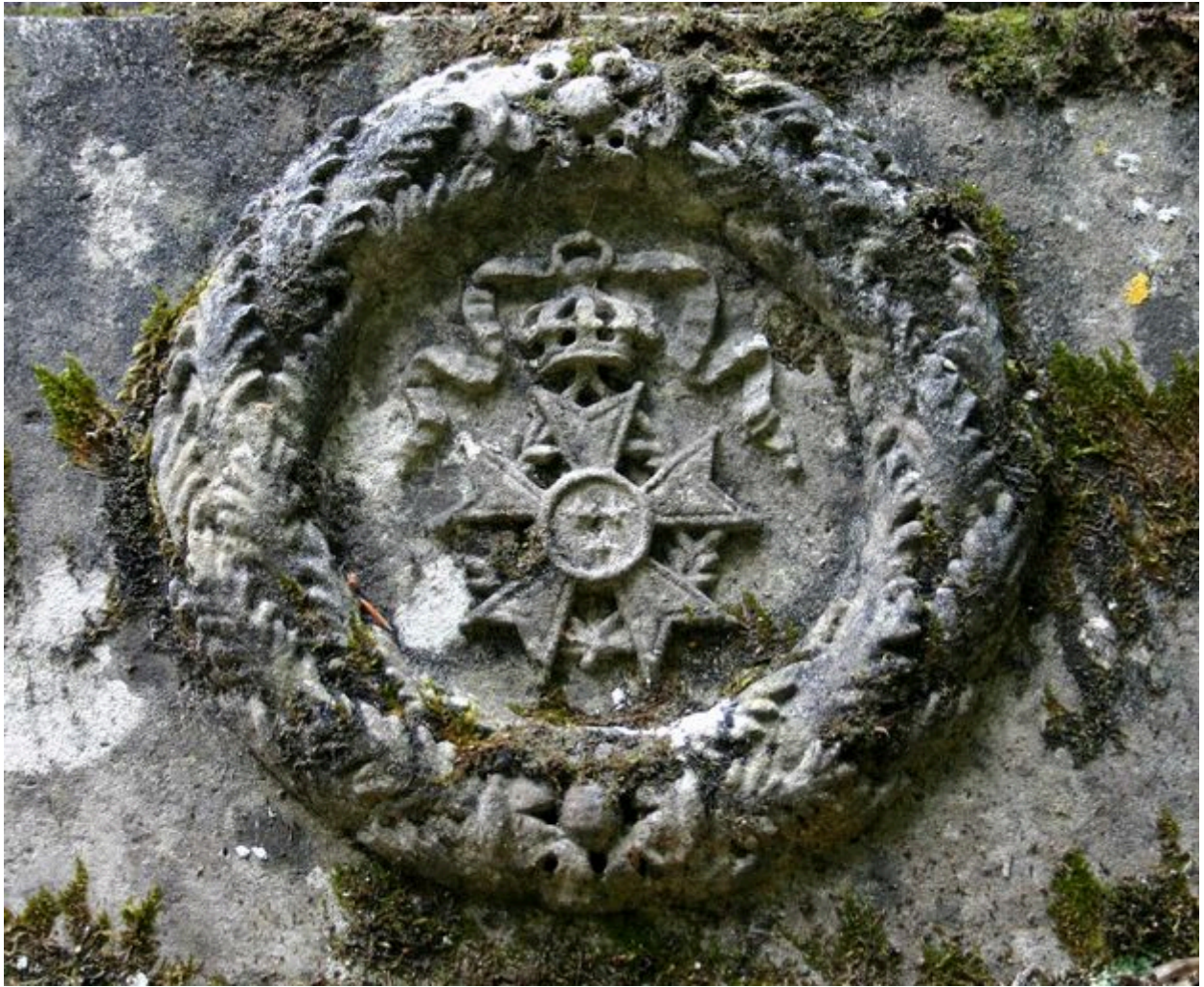
Détail du décor sculpté de la face antérieure, représentant une couronne de feuilles de chêne et de branches de cyprès ornée, au centre, de la croix de la Légion d'Honneur.