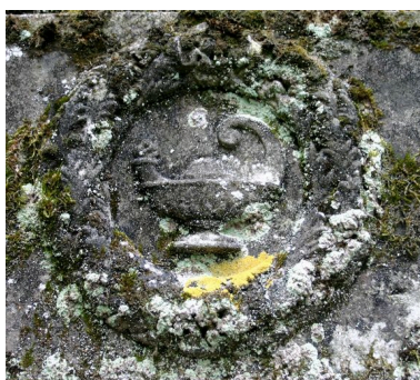
Détail du décor sculpté de la face gauche, représentant une couronne de feuilles de chêne et de branches de cyprès ornée, au centre, d'une lampe sépulcrale.