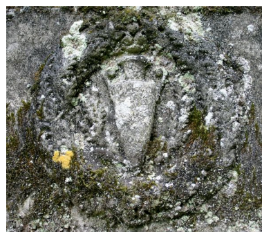
Détail du décor sculpté de la face postérieure, représentant une couronne de feuilles de chêne et de branches de cyprès ornée, au centre, d'un vase funéraire.