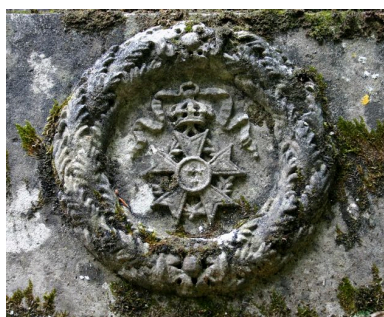
Détail du décor sculpté de la face antérieure, représentant une couronne de feuilles de chêne et de branches de cyprès ornée, au centre, de la croix de la Légion d'Honneur. IVR22_20078000808NUCA