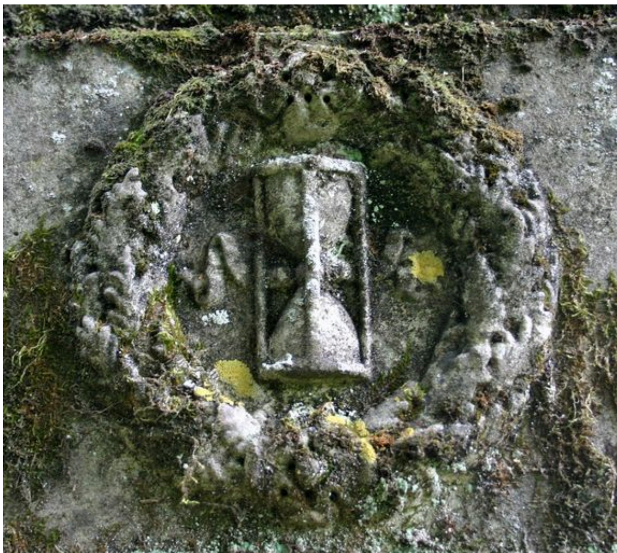
Détail du décor sculpté de la face droite, représentant une couronne de feuilles de chêne et de branches de cyprès ornée, au centre, d'un sablier ailé.