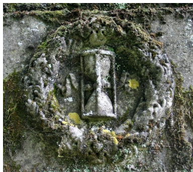
Détail du décor sculpté de la face droite, représentant une couronne de feuilles de chêne et de branches de cyprès ornée, au centre, d'un sablier ailé.

Phot. Caroline Vincent IVR22_20078000811NUCA