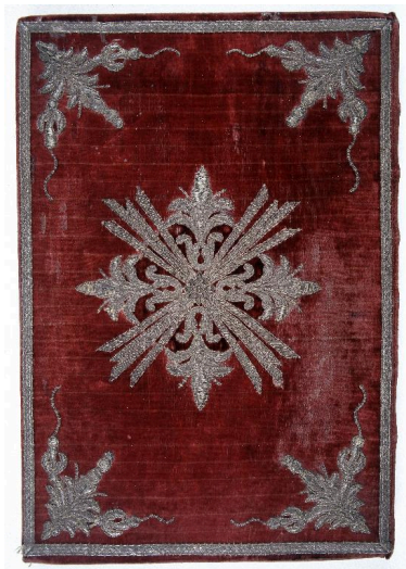
Vue de la reliure en velours.