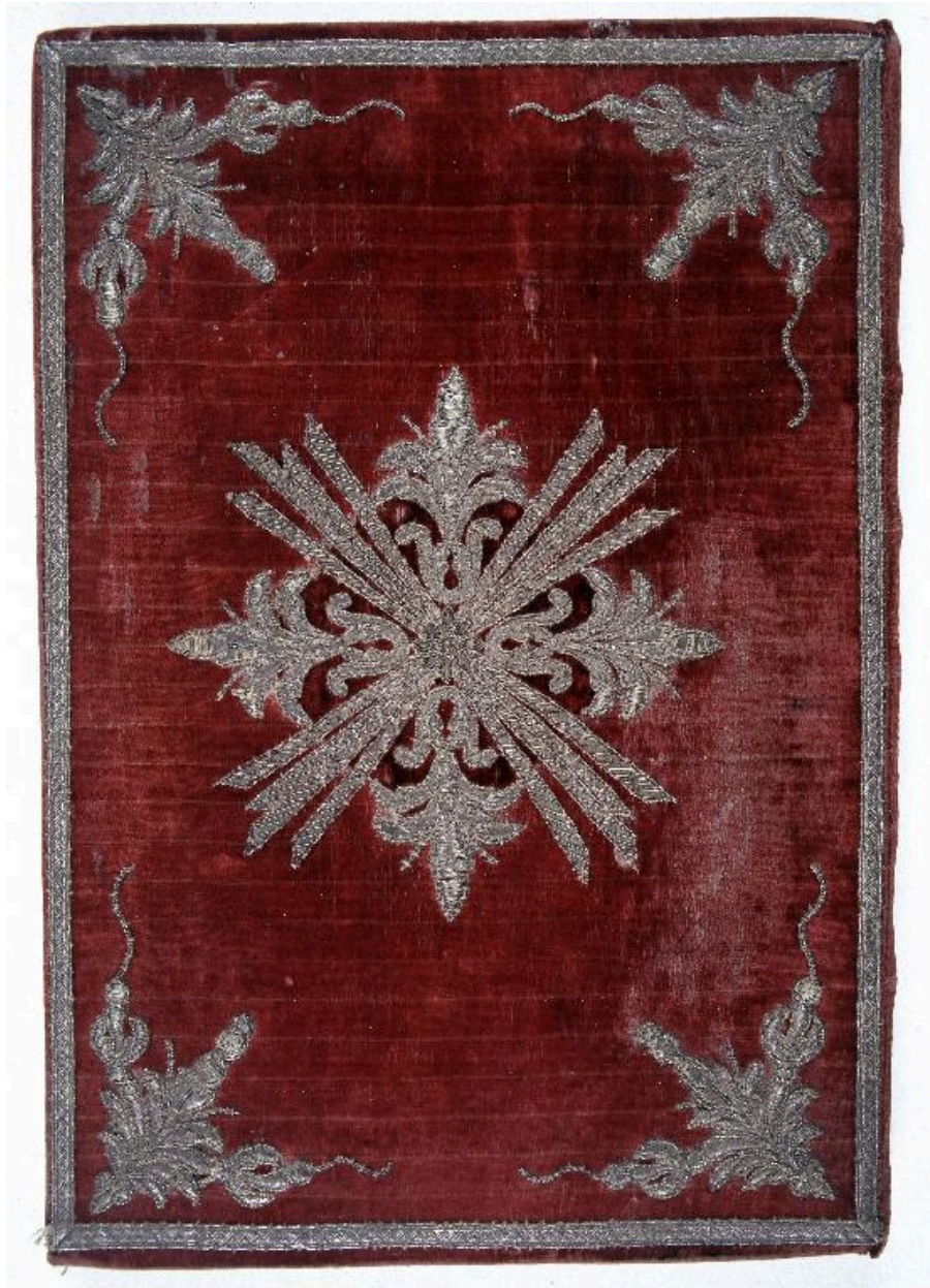
Vue de la reliure en velours.