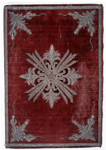
Vue de la reliure en velours. IVR22_19966003627XA