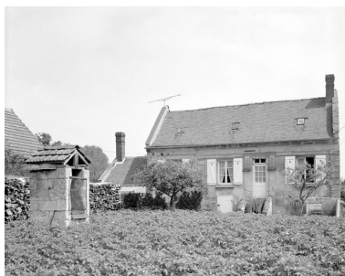
Vue générale. IVR22_19856000823V

Plan de situation. Extrait du plan cadastral de 1962, section B1 11. IVR22_20096000071NUC2A