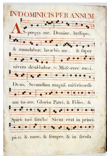
Vue de la première page. IVR22_19966002479XA