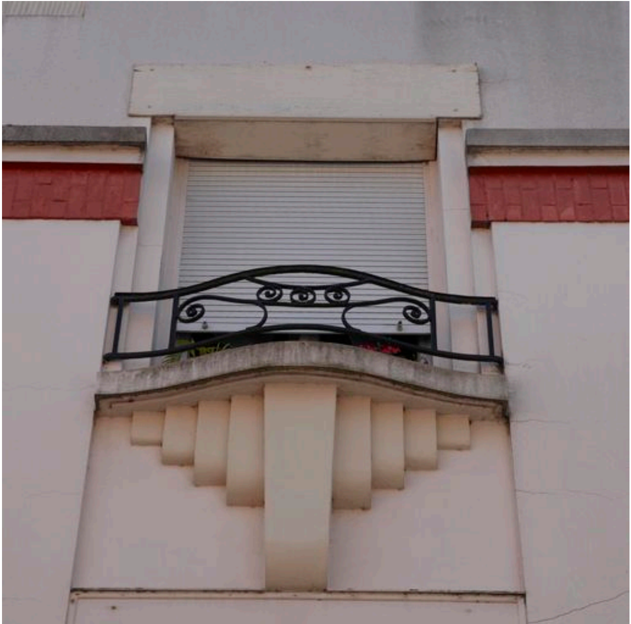
Appui de baie pyramidal.