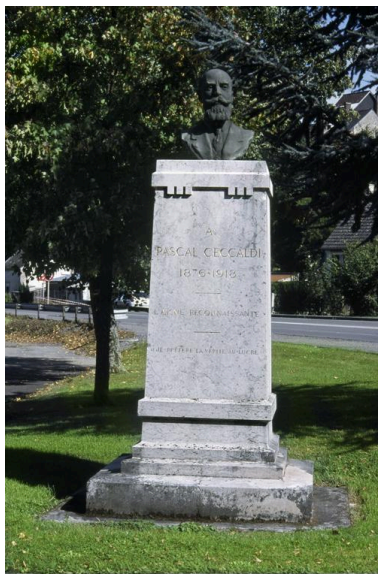
Vue du buste sur son socle.