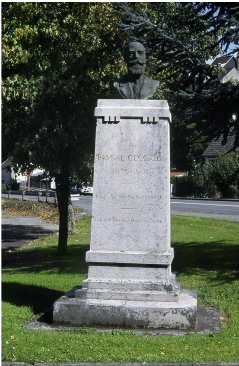
Vue du buste sur son socle.