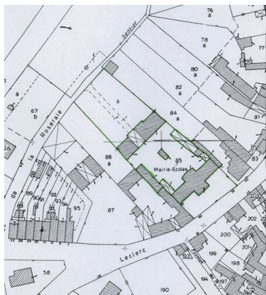
Plan de situation. Extrait du plan cadastral de 1982, section AB 85. IVR22_20096000163NUCA