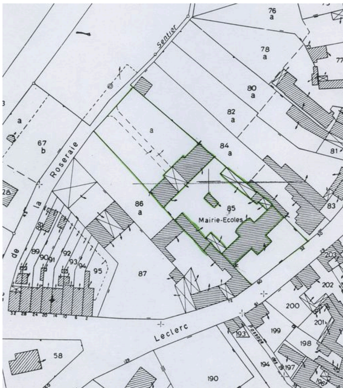
Plan de situation. Extrait du plan cadastral de 1982, section AB 85.