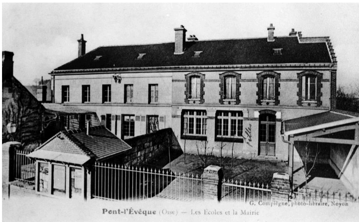
Elévation antérieure, avant 1914 (AP).