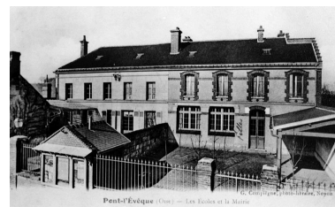
Elévation antérieure, avant 1914 (AP). IVR22_19856000262XB