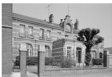
Vue générale. IVR22_19856000890X