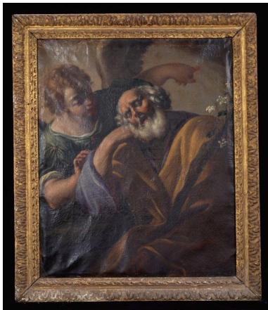
Vue générale. IVR22_19966001773XA