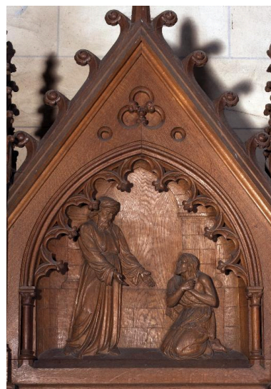
Bas-relief du fronton du confessionnal du bras sud : le Retour du fils prodigue.

IVR22_20138000321NUC2A