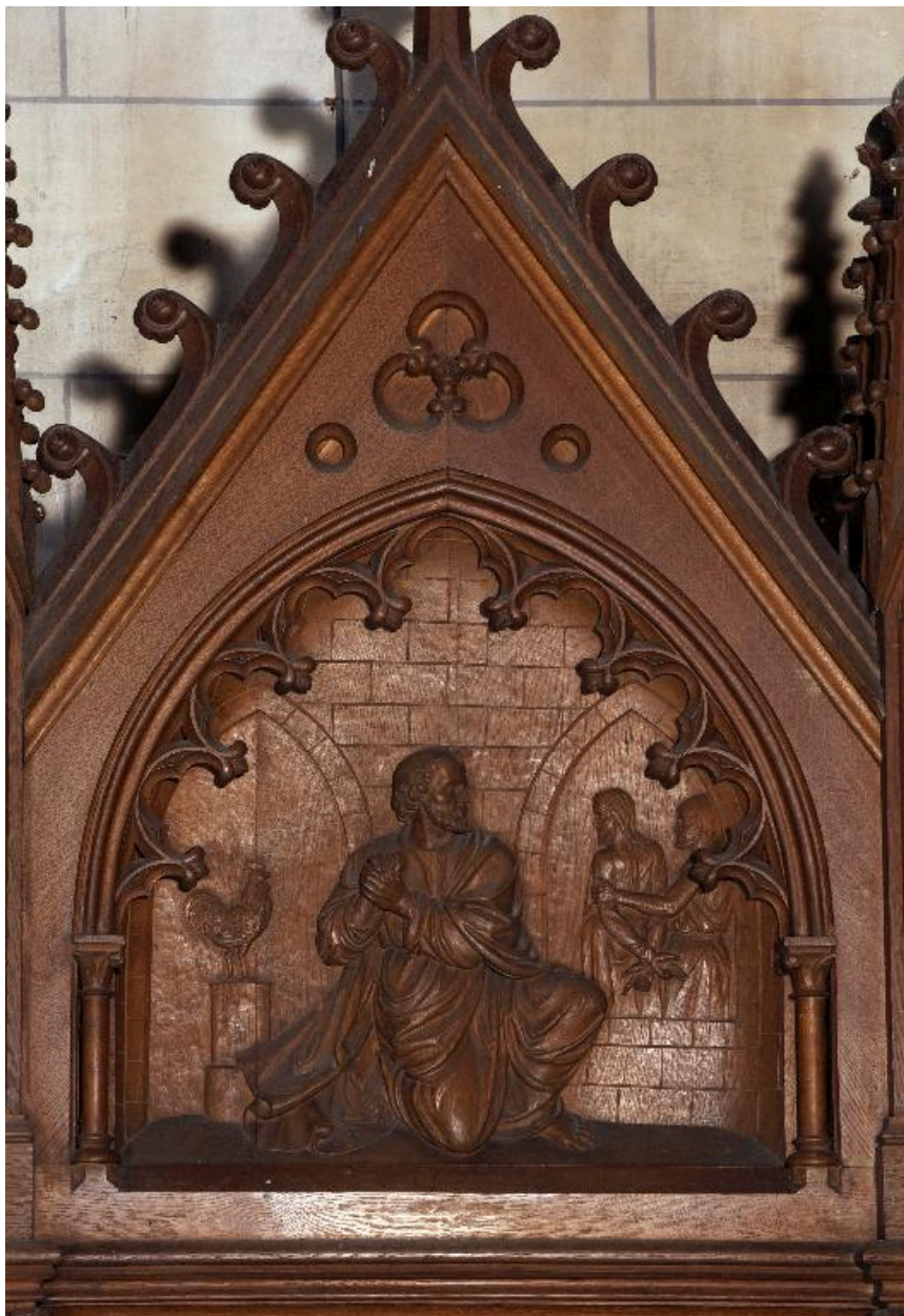
Bas-relief du fronton du confessionnal du bras nord : Reniement et repentir de saint Pierre.