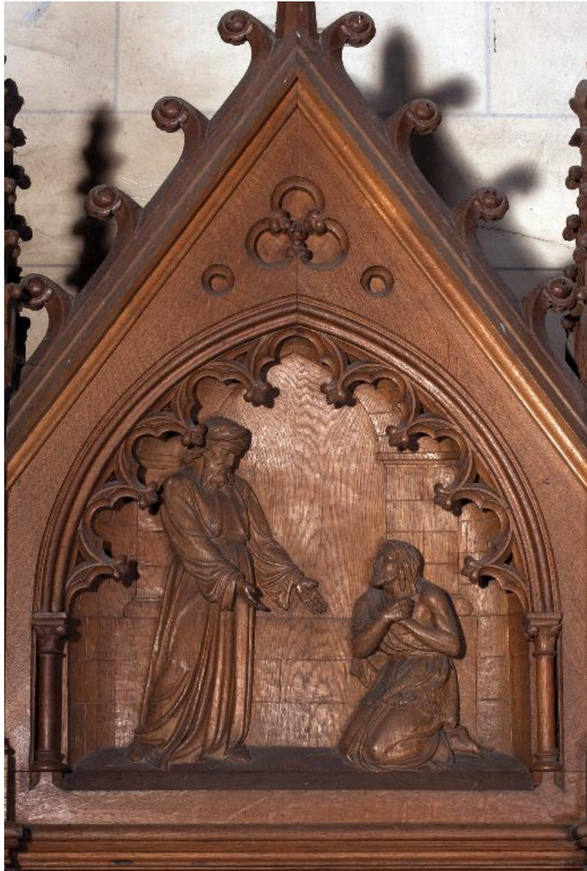
Bas-relief du fronton du confessionnal du bras sud : le Retour du fils prodigue.