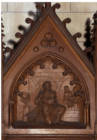
Bas-relief du fronton du confessionnal du bras nord : Reniement et repentir de saint Pierre.

IVR22_20138000305NUC2A