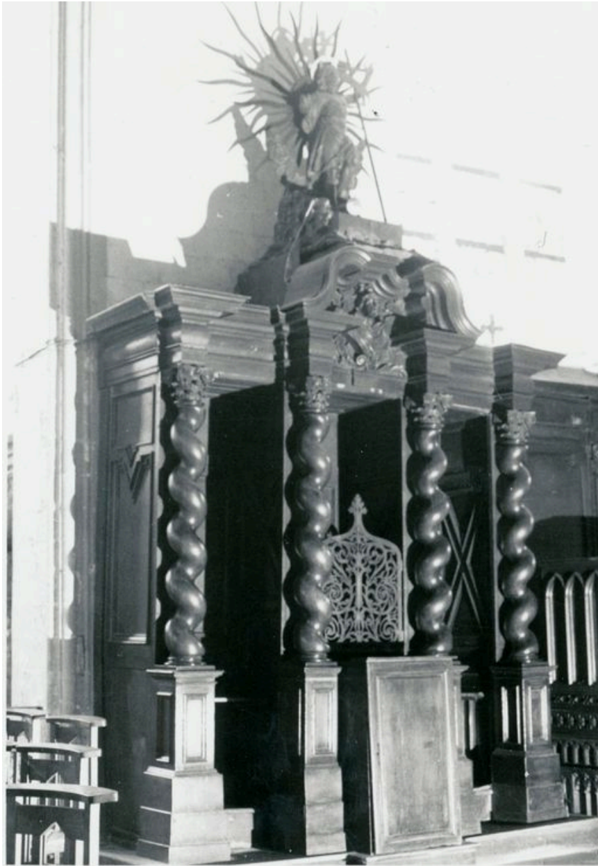
Vue générale, bas côté-sud