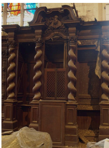
Confessionnal du bas-côté nord IVR31_20106201840NUCA