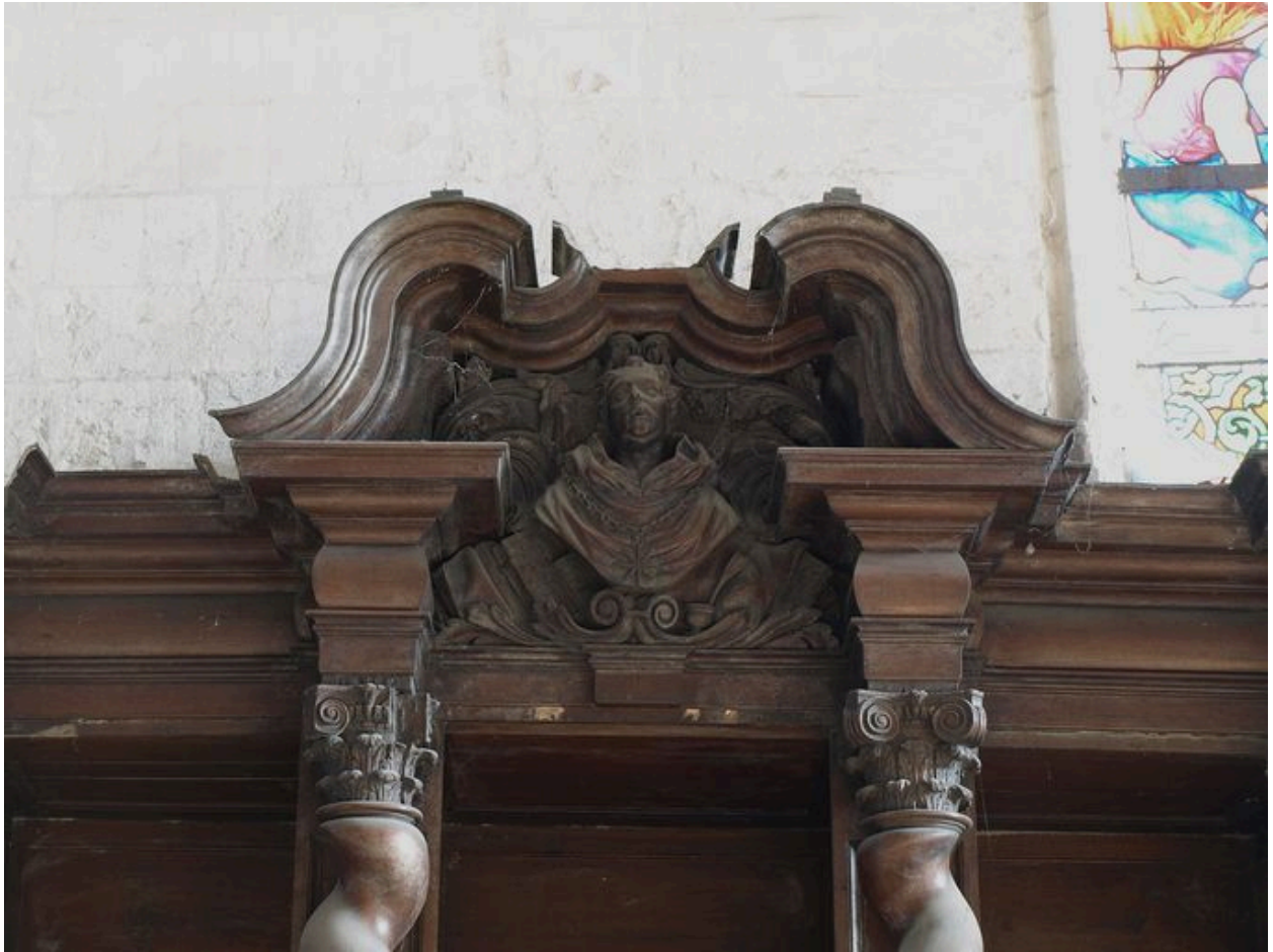
Confessionnal du bas-côté sud, registre supérieur