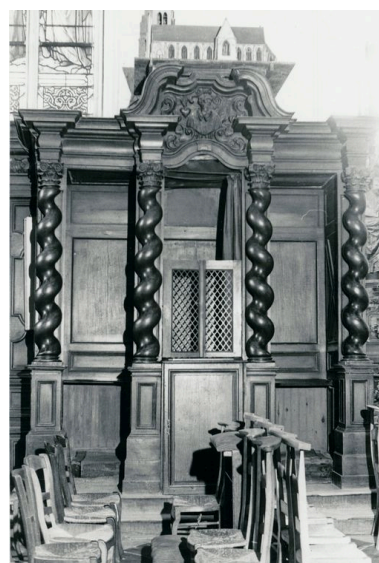
Vue générale, bas-côté nord IVR31_20106201846NUC