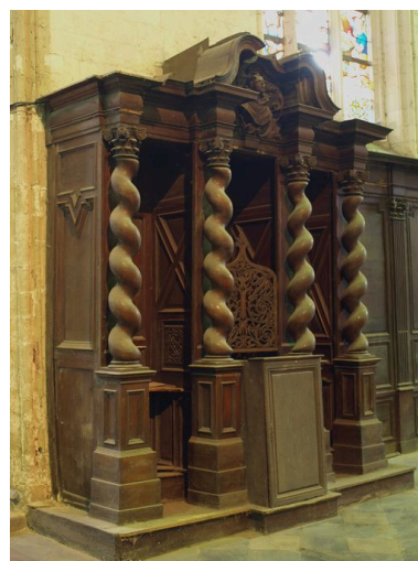
Vue latérale IVR31_20106201836NUCA