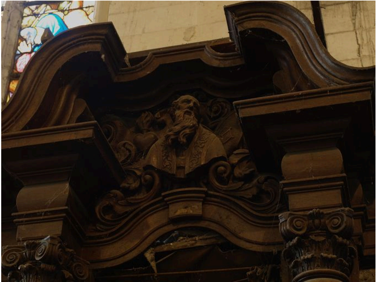
Vue de détail, docteur de l'Eglise