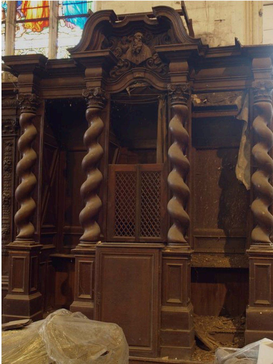
Confessionnal du bas-côté nord