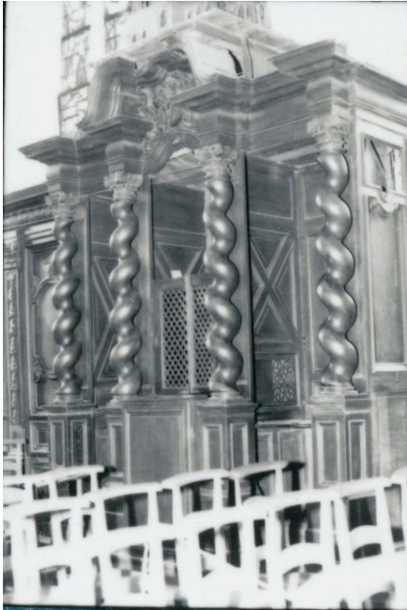
Vue générale, bas-côté nord