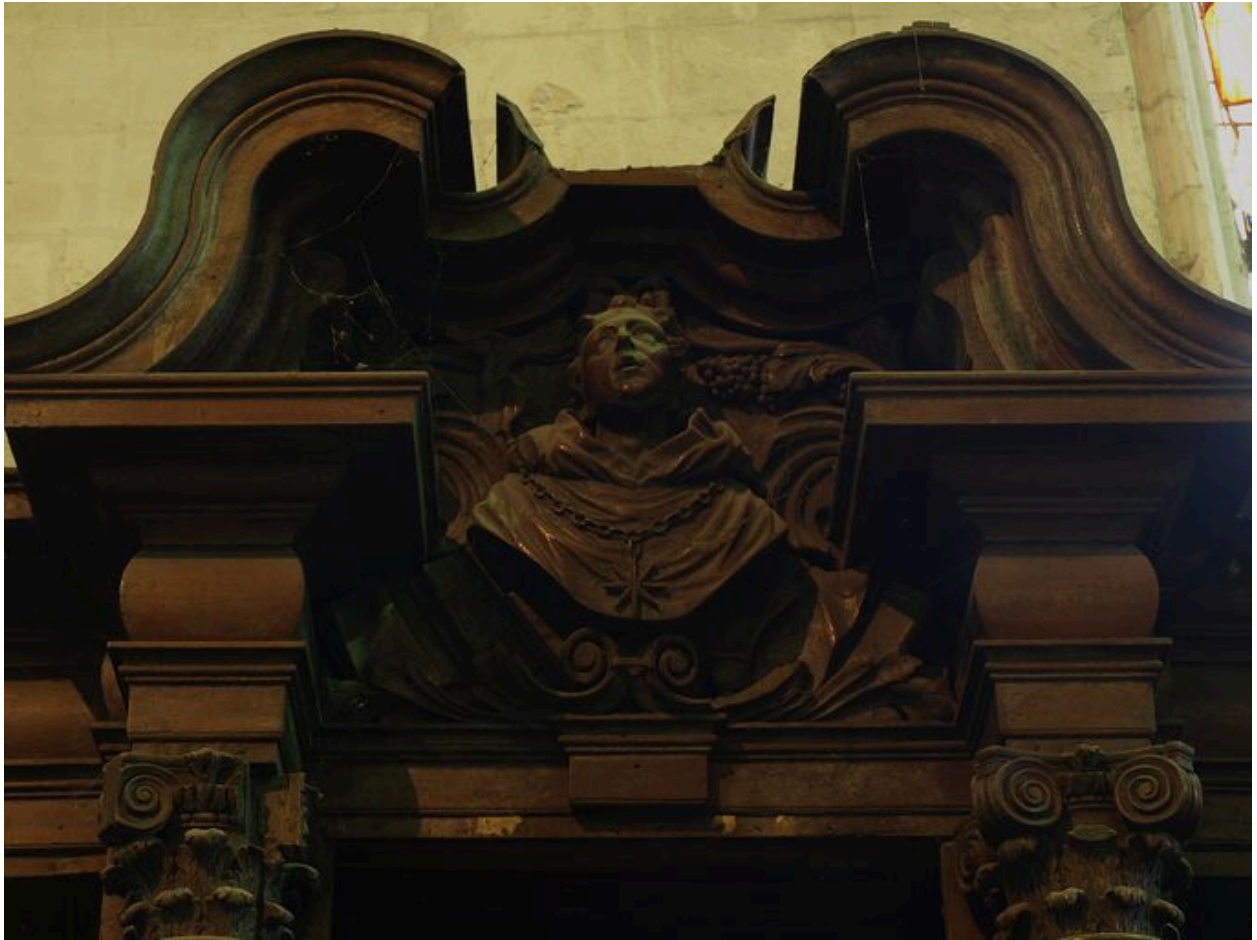
Vue de détail, saint Augustin