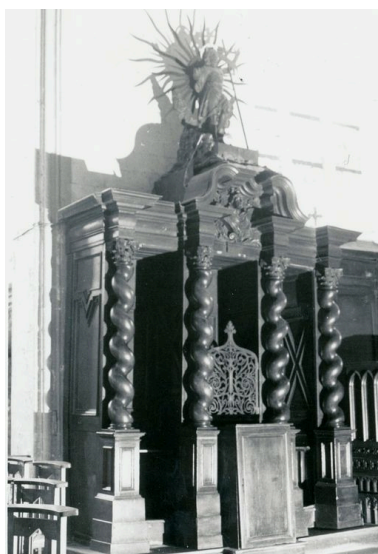
Vue générale, bas côté-sud (phot. Wintrebert, 1978, fonds AOA62) Phot. Julien Marasi