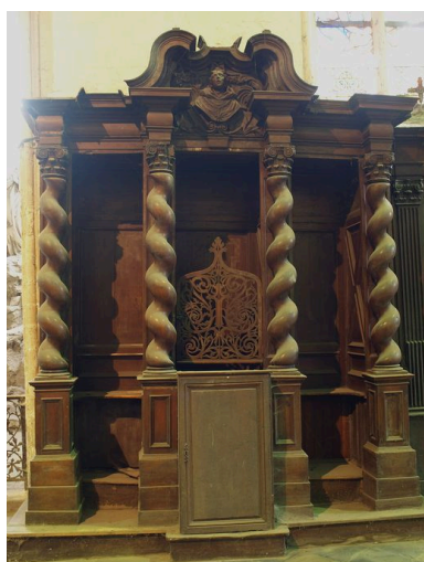
Confessionnal du bas-côté sud IVR31_20106201837NUCA