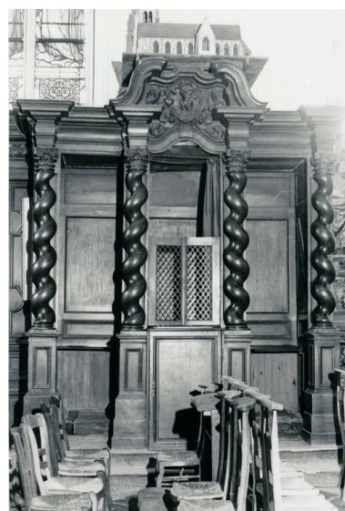
Vue générale, bas-côté nord IVR31_20106201846NUC