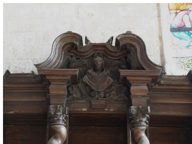
Confessionnal du bas- côté sud, registre supérieur IVR31_20106201838NUCA