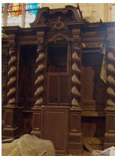
Confessionnal du bas-côté nord