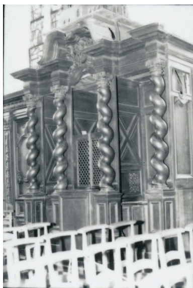
Vue générale, bas-côté nord (phot. Wintrebert, 1978, fonds AOA62)