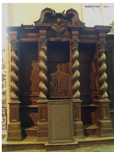
Confessionnal du bas-côté sud