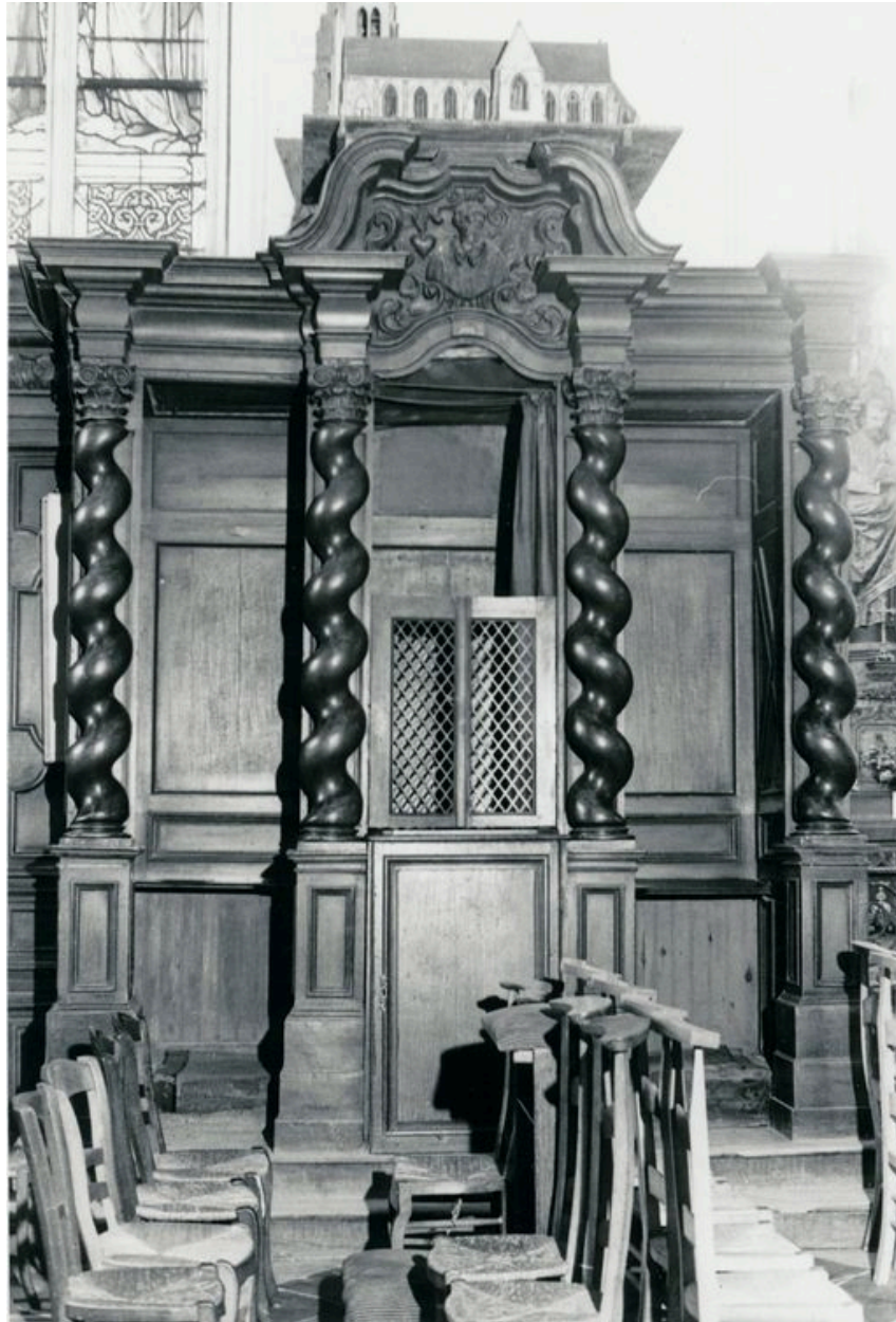
Vue générale, bas-côté nord (phot. Wintrebert, 1978, fonds AOA62)