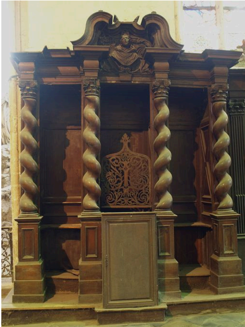
Confessionnal du bas-côté sud