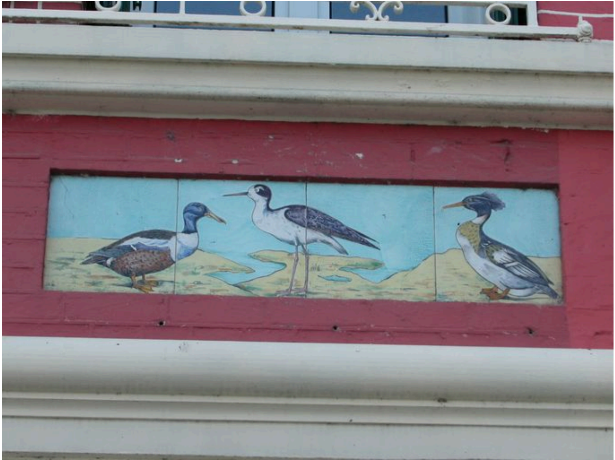
Détail des carreaux de céramique récents (cinquième panneau en partant de gauche).