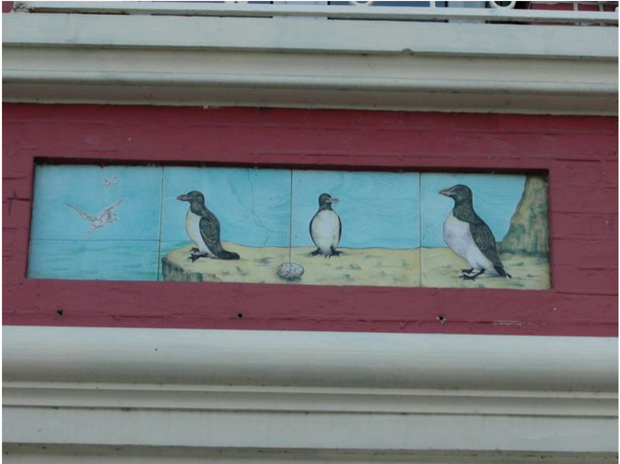
Détail des carreaux de céramique récents (quatrième panneau en partant de gauche).