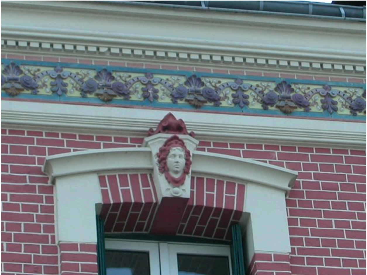
Détail de la tête de femme ornant la clé d'une baie.