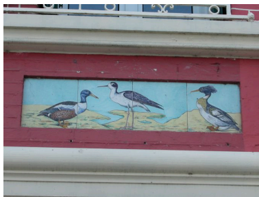
Détail des carreaux de céramique récents (cinquième panneau en partant de gauche).