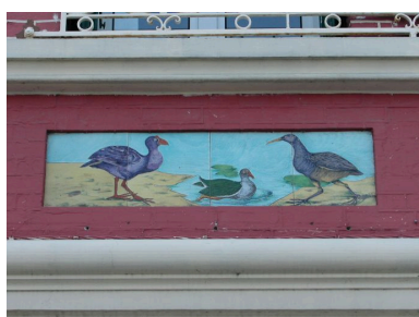
Détail des carreaux de céramique récents (premier panneau en partant de gauche). IVR22_20058002894NUCA