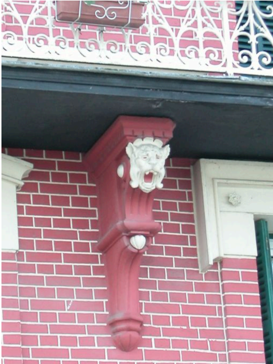
Détail de la tête de lion ornant la console du balcon.