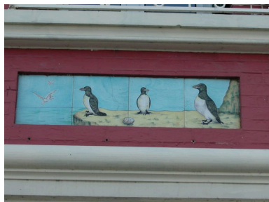
Détail des carreaux de céramique récents (quatrième panneau en partant de gauche).