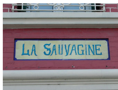
Détail des carreaux de céramique portant appellation (troisième panneau en partant de gauche). IVR22_20058002896NUCA