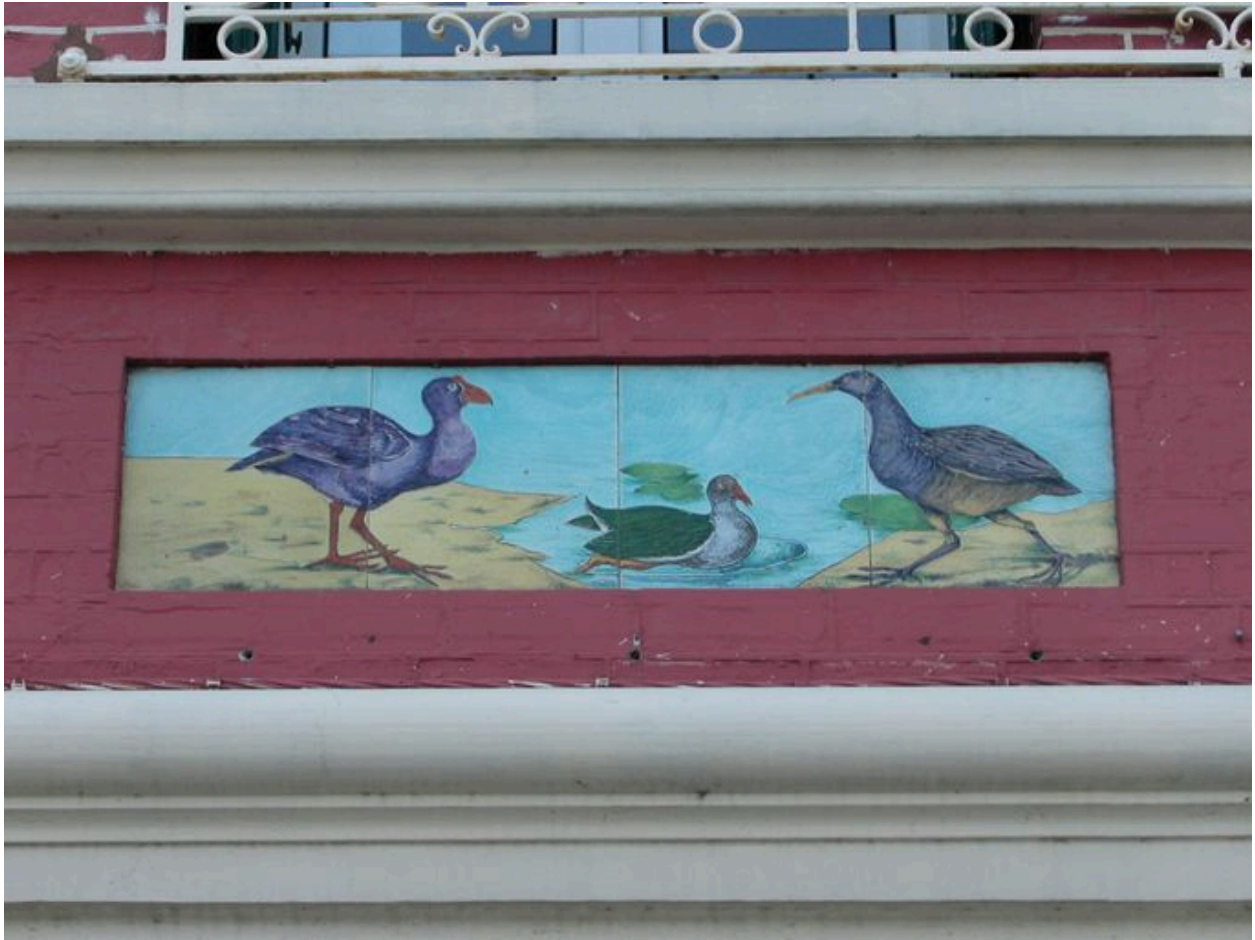
Détail des carreaux de céramique récents (premier panneau en partant de gauche).