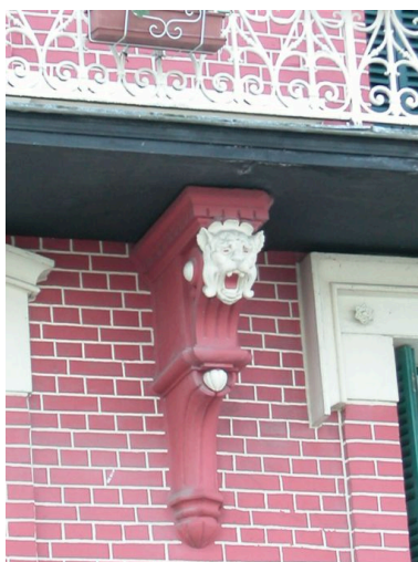
Détail de la tête de lion ornant la console du balcon.