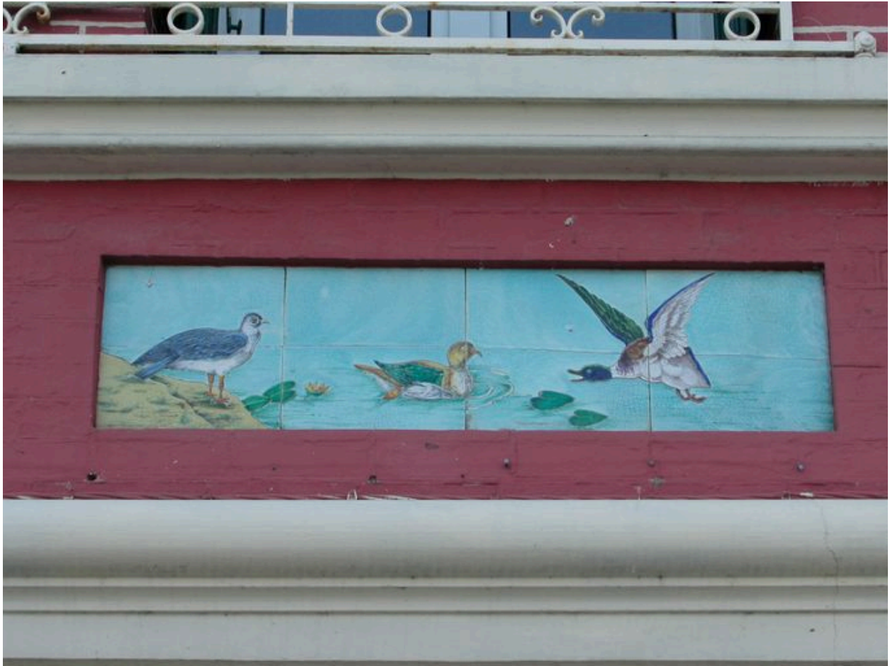
Détail des carreaux de céramique récents (deuxième panneau en partant de gauche).