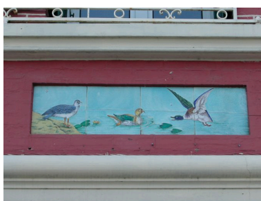
Détail des carreaux de céramique récents (deuxième panneau en partant de gauche).