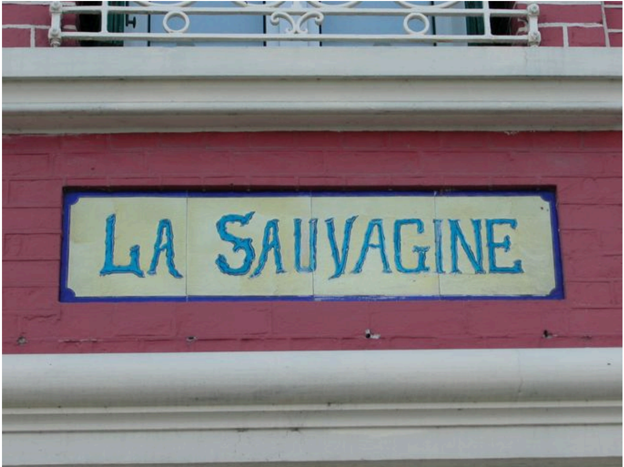
Détail des carreaux de céramique portant appellation (troisième panneau en partant de gauche).