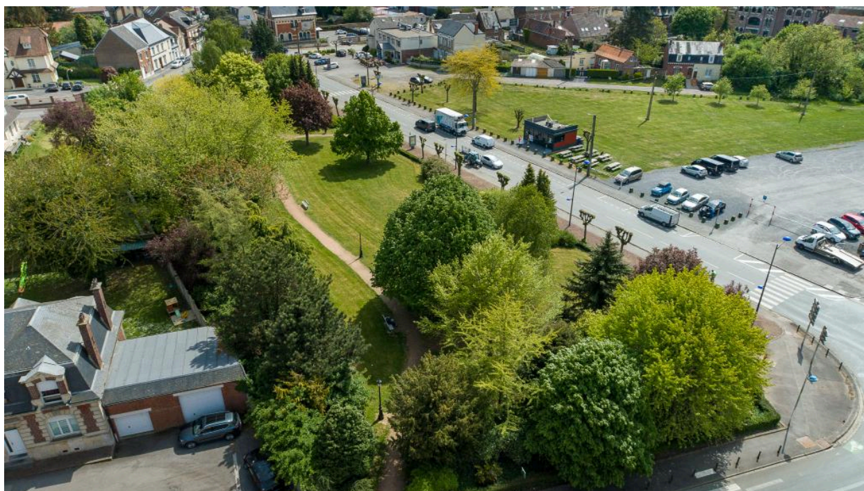
Vue aérienne du jardin occupant l'emplacement de la piscine détruite.