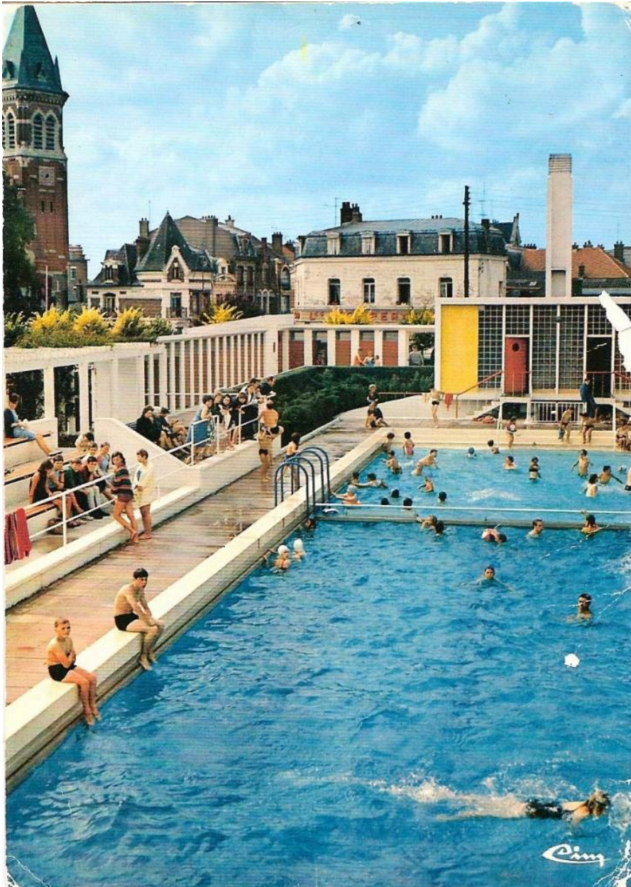
La piscine de Bapaume. Carte postale, 3e quart 20e siècle (Coll. part.).

IVR32_20196200990NUCA (c) Région Hauts-de-France - Inventaire général tous droits réservés