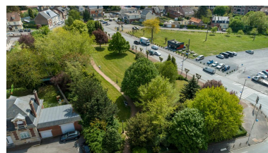
Vue aérienne du jardin occupant l'emplacement de la piscine détruite.