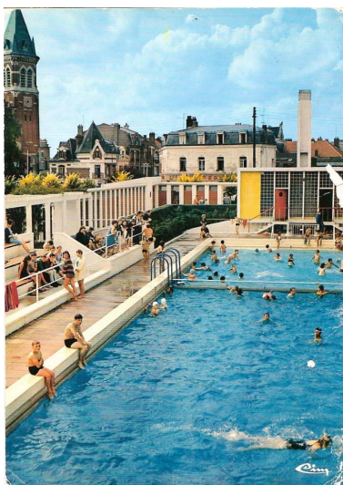
La piscine de Bapaume. Carte postale, 3e quart 20e siècle. IVR32_20196200990NUCA