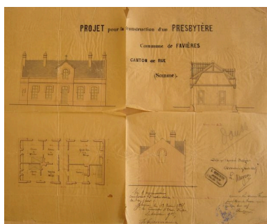
Plan, coupe et élévation du projet de construction du presbytère en 1865.