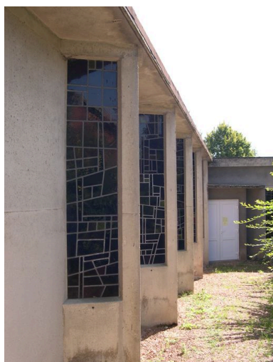
Vue des fenêtres de la façade ouest, depuis le nord. IVR22_20038011014NUCA