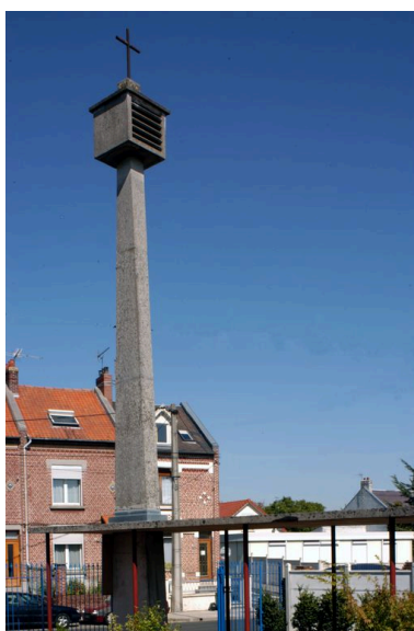
Vue du clocher. IVR22_20038000916NUCA