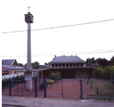
Vue générale. IVR22_20038000923XA