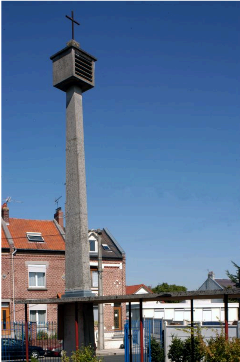
Vue du clocher.