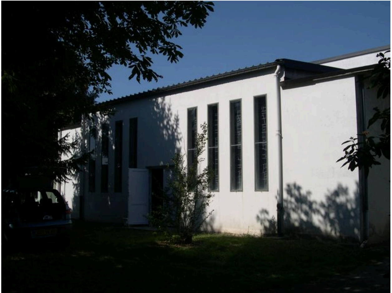
Vue depuis le sud-est.