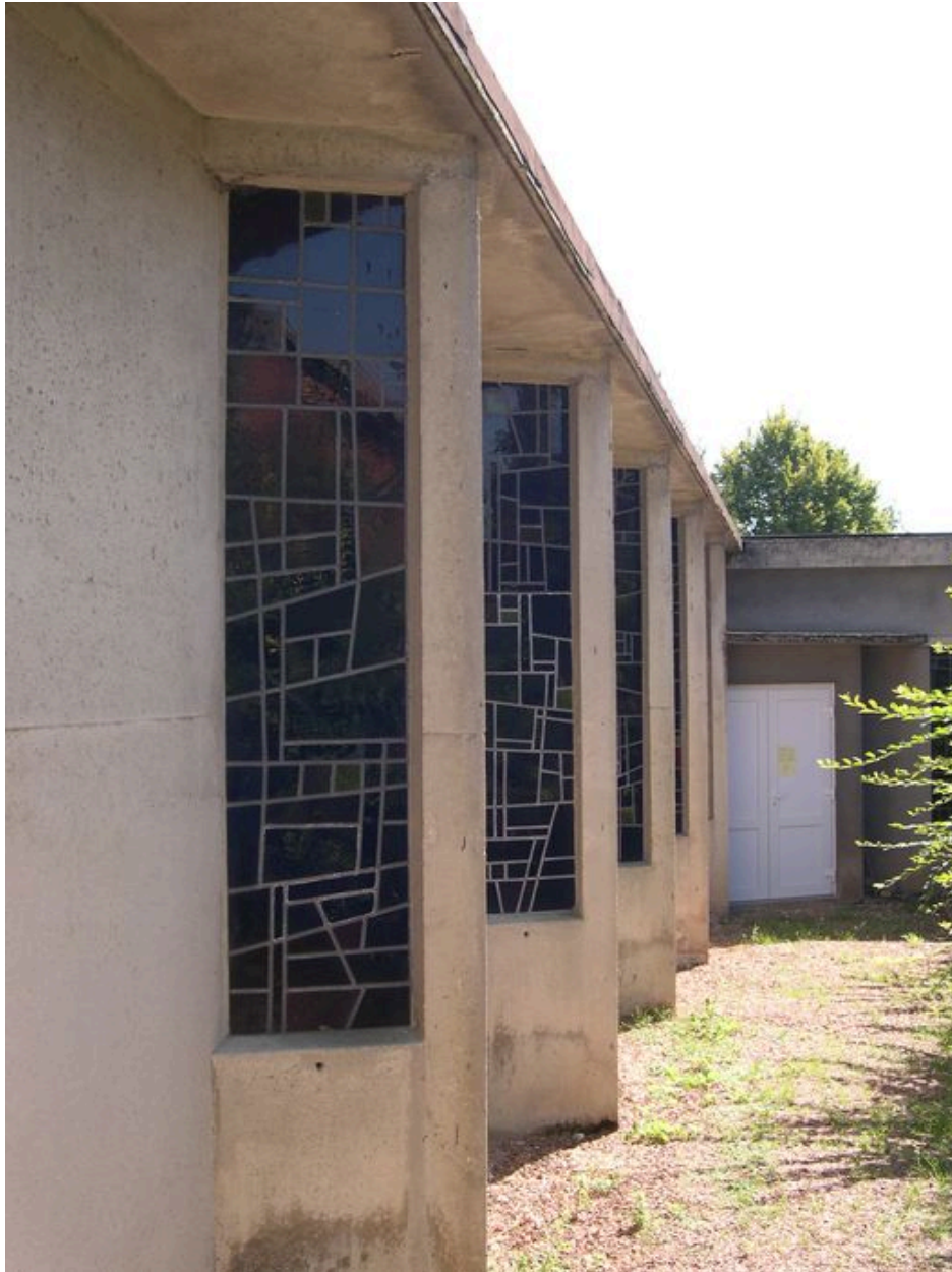
Vue des fenêtres de la façade ouest, depuis le nord.