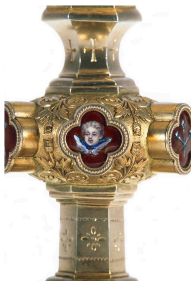
Vue de détail du noeud : une tête de chérubin. IVR22_19966001078ZA