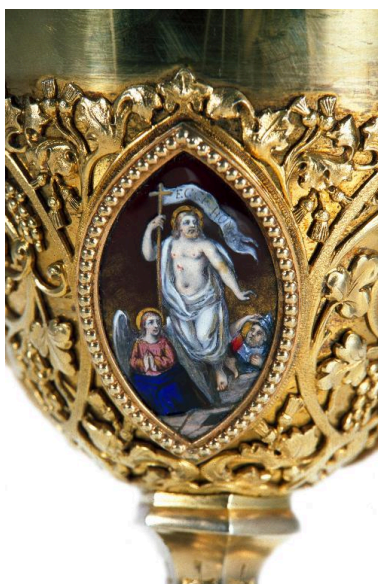
Vue de détail d'un médaillon sur la fausse-coupe : la Résurrection.