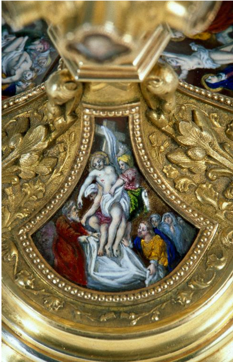
Vue de détail d'un médaillon sur le pied : la Descente de croix.