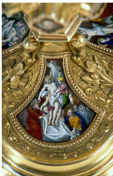
Vue de détail d'un médaillon sur le pied : la Descente de croix.