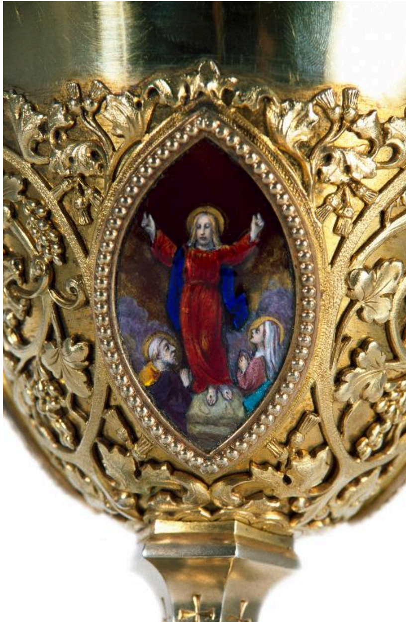
Vue de détail d'un médaillon sur la fausse-coupe : l'Ascension.