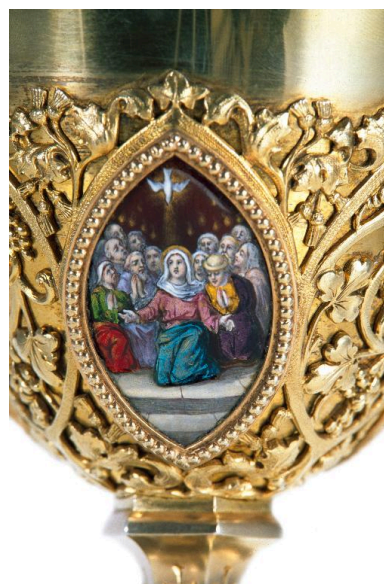
Vue de détail d'un médaillon sur la fausse-coupe : la Pentecôte. IVR22_19966001080ZA