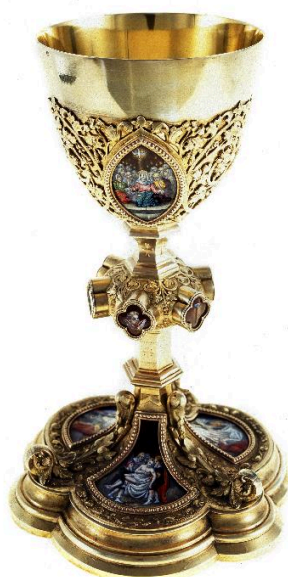
Vue d'une des faces. IVR22_19966001648XA