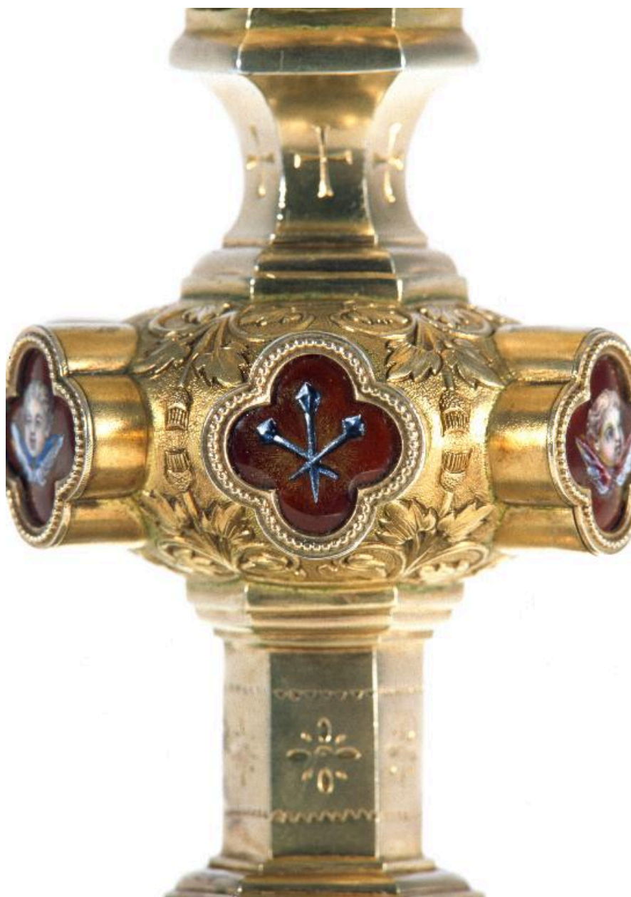
Vue de détail du noeud : les clous de la Passion.