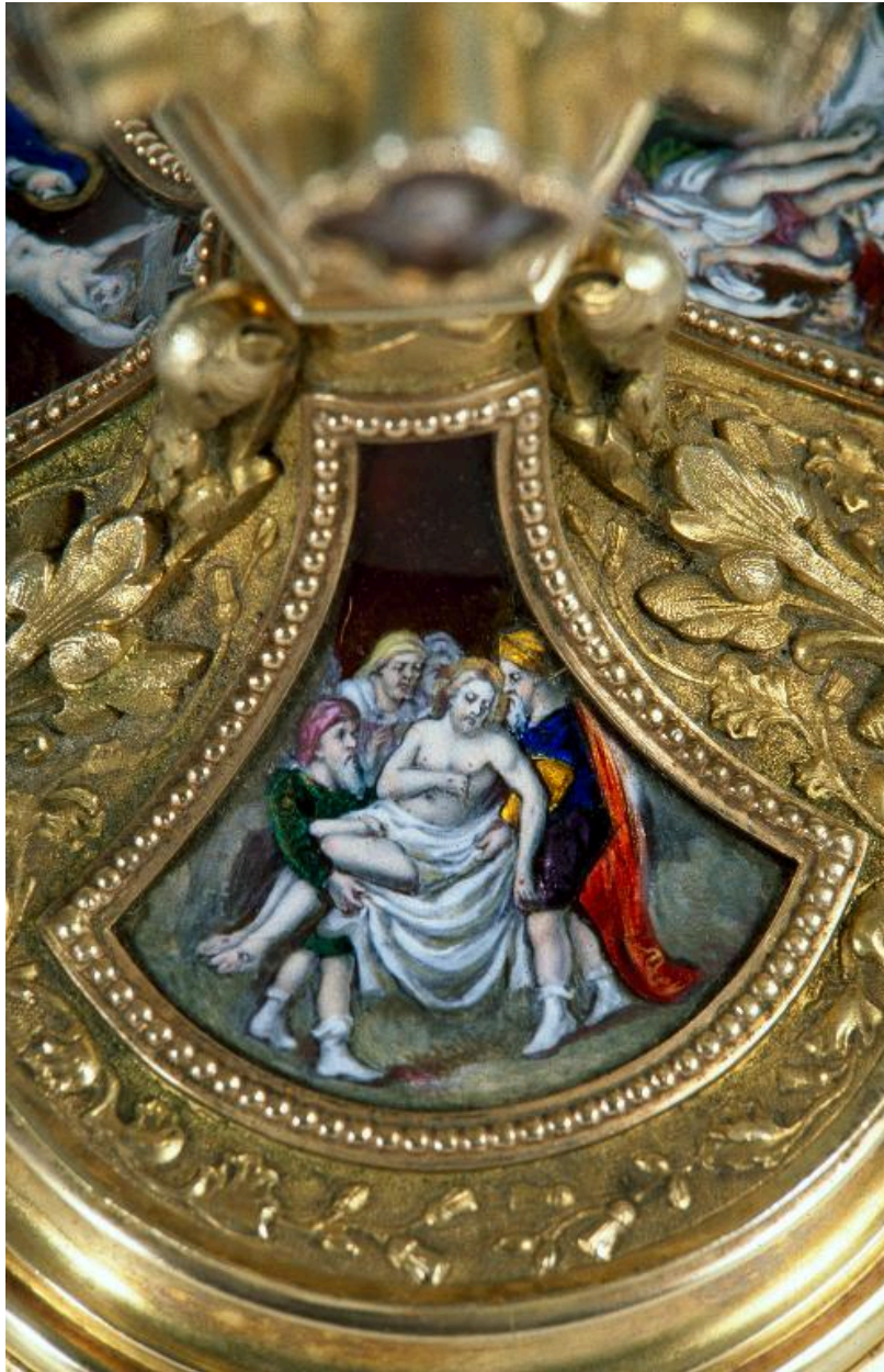
Vue de détail d'un médaillon sur le pied : la Mise au tombeau.