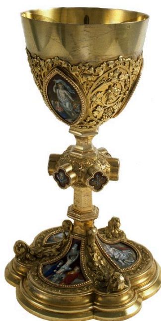
Vue d'une autre face.