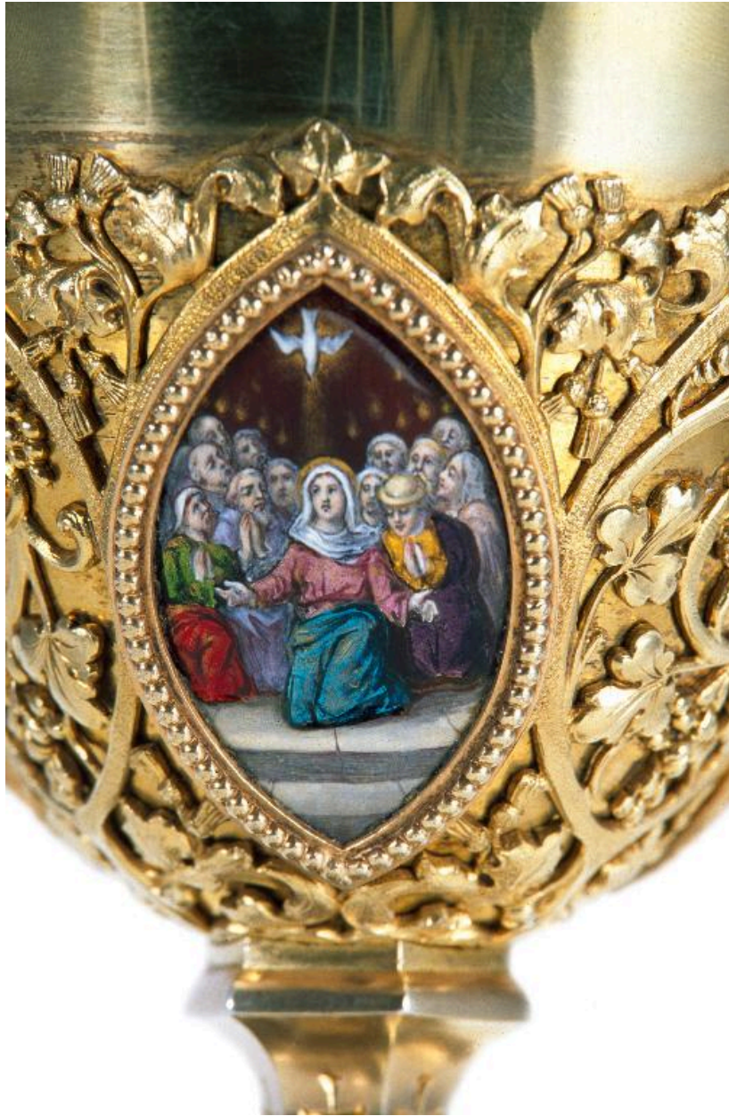
Vue de détail d'un médaillon sur la fausse-coupe : la Pentecôte.