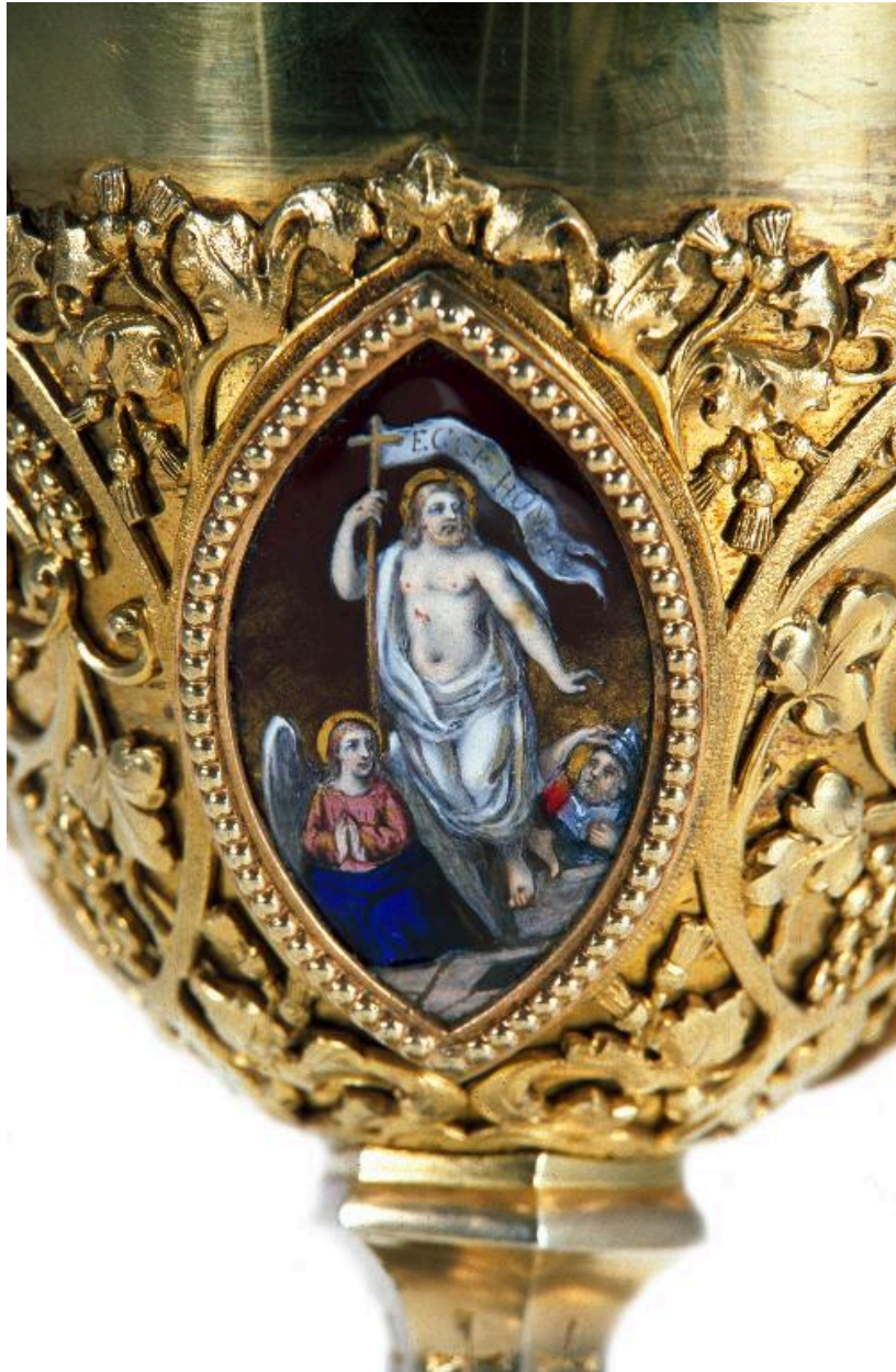
Vue de détail d'un médaillon sur la fausse-coupe : la Résurrection.