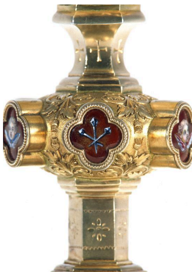
Vue de détail du noeud : les clous de la Passion. IVR22_19966001079ZA