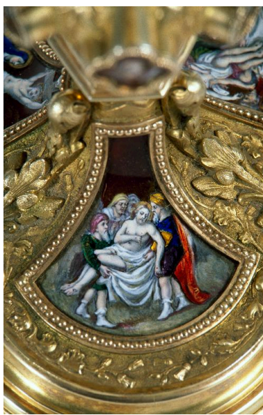
Vue de détail d'un médaillon sur le pied : la Mise au tombeau.