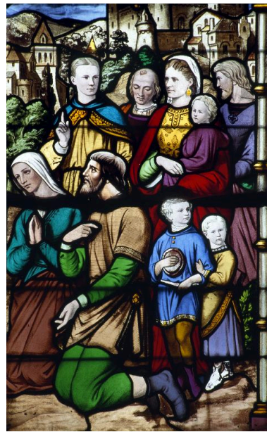
Détail de la verrière : un groupe de plaignants, où plusieurs personnages ont reçu le visage d'un membre de la famille Moreau.