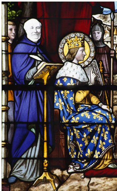
Détail de la verrière : le roi Saint Louis et son secrétaire (portrait photographique d'un membre de la famille Moreau).