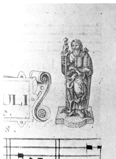
Détail de la page 146 : petit dessin représentant saint Paul.