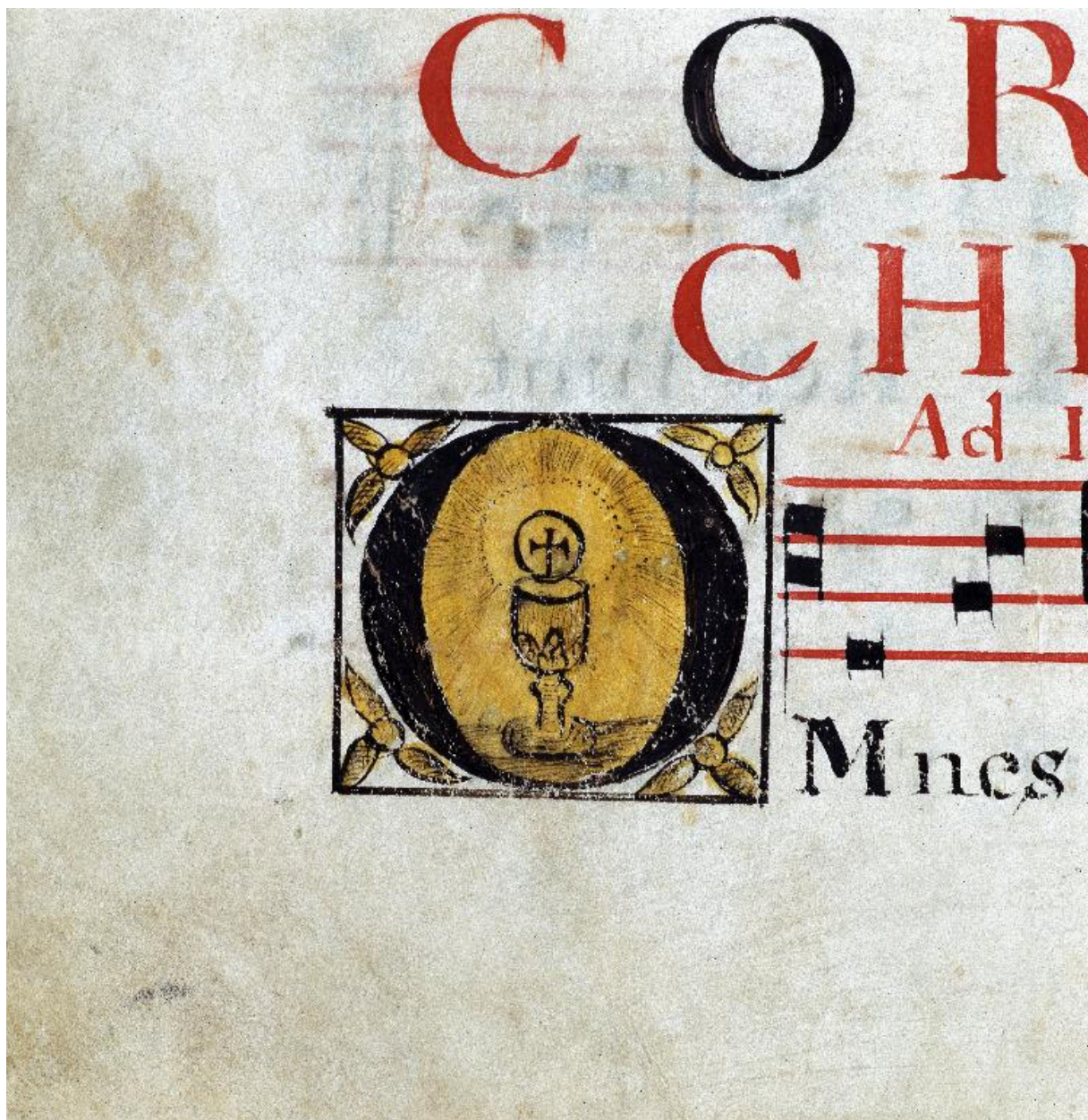
Détail de la page 90 : lettre O enluminée avec un calice et une hostie.