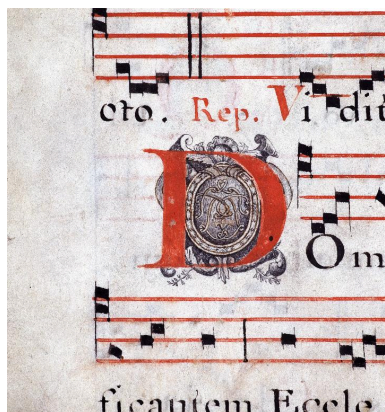
Détail de la page 146 : lettre D avec un cuir enroulé.