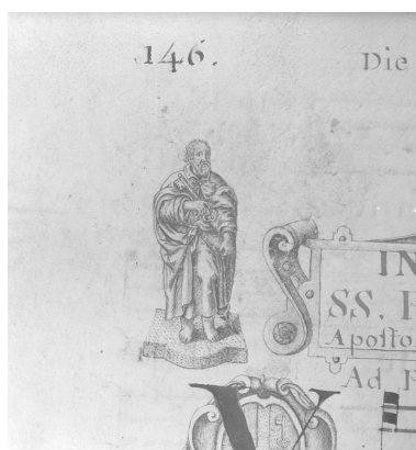
Détail de la page 146 : petit dessin représentant saint Pierre.