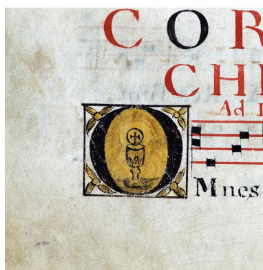
Détail de la page 90 : lettre O enluminée avec un calice et une hostie. IVR22_19966003614XA