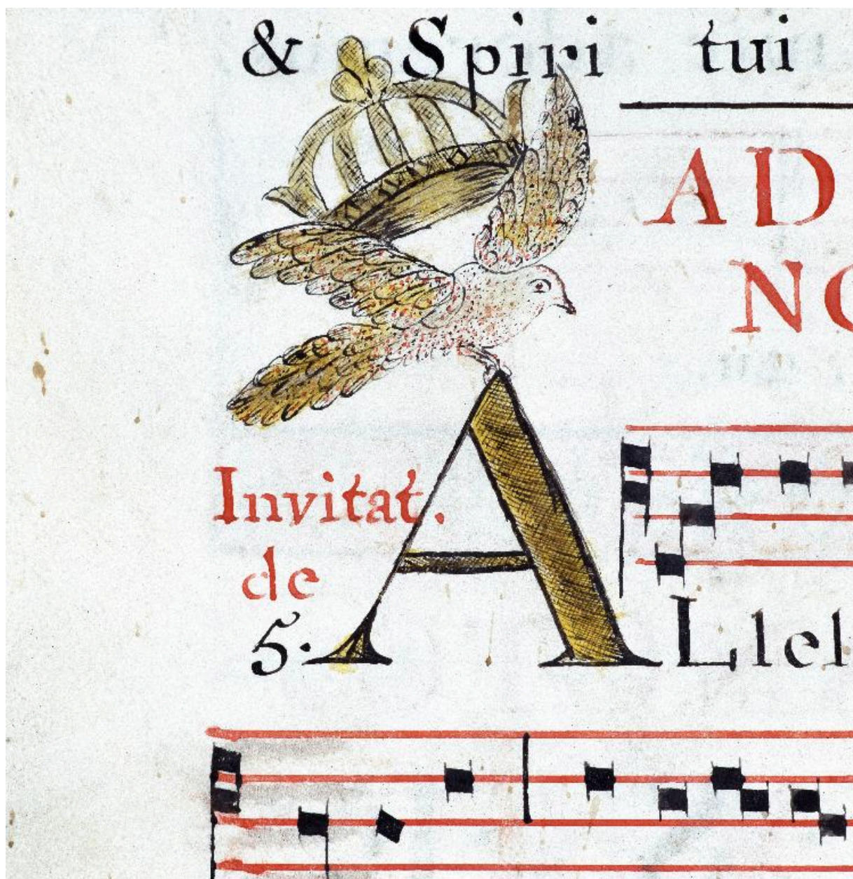
Détail de la page 82 : lettre A enluminée avec une colombe et une couronne.