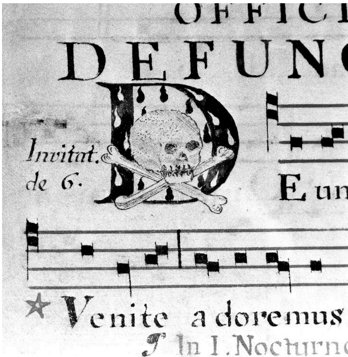
Détail de la page 24 (début de l'officium defunctorum) : lettre D enluminée avec une tête de mort.