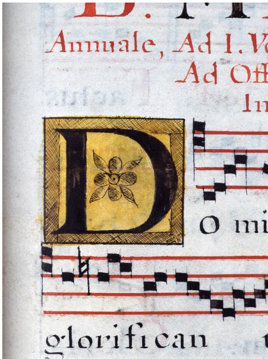
Détail de la page 165 : lettre D enluminée dans un cadre doré