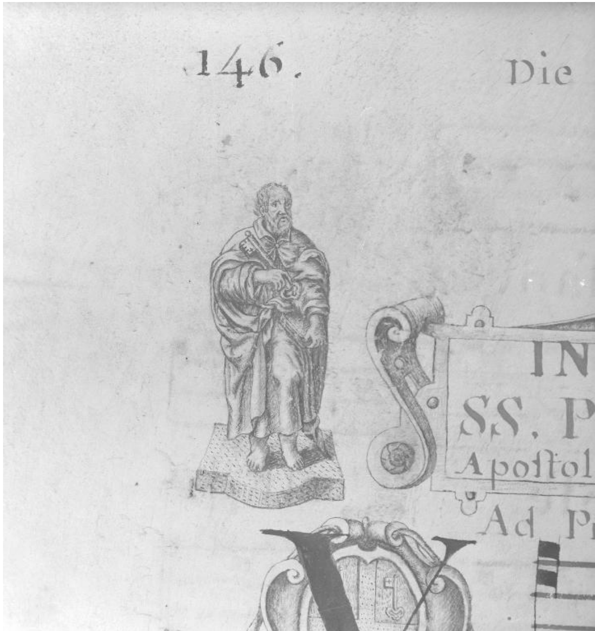
Détail de la page 146 : petit dessin représentant saint Pierre.