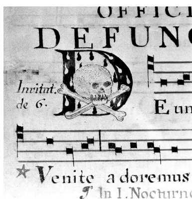
Détail de la page 24 (début de l'officium defunctorum) : lettre D enluminée avec une tête de mort.