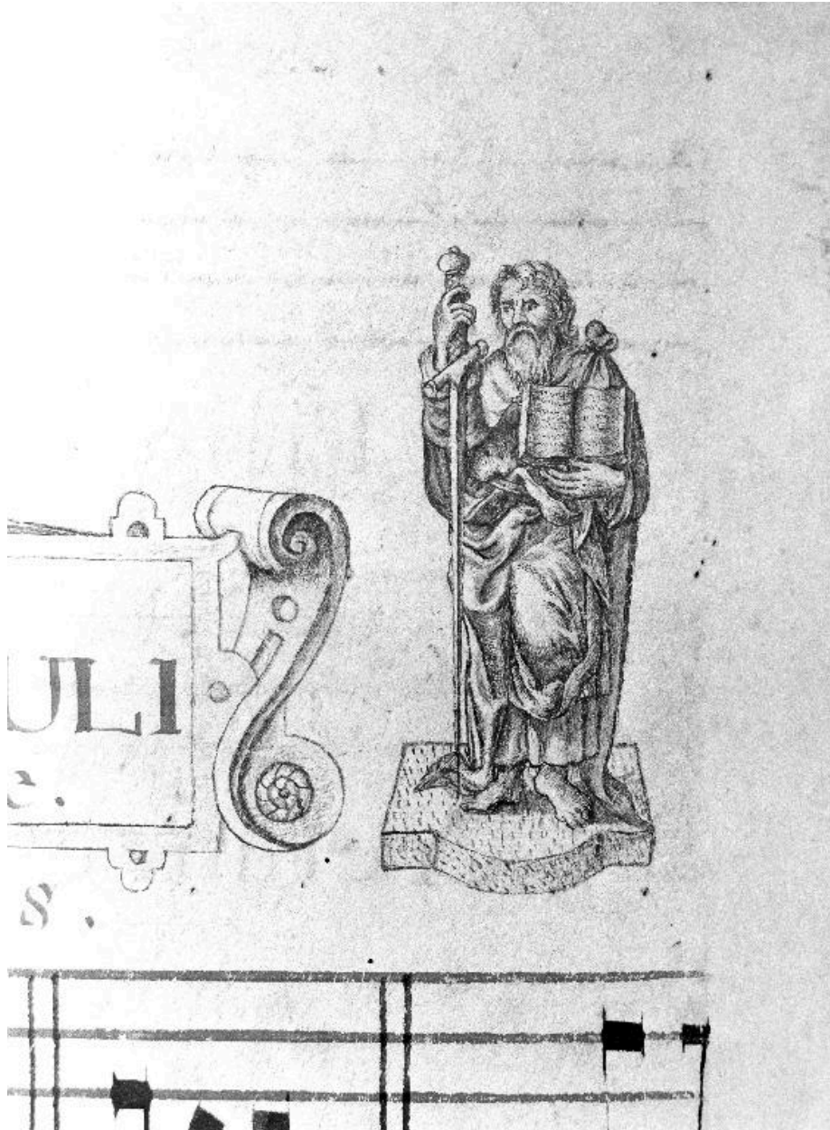
Détail de la page 146 : petit dessin représentant saint Paul.