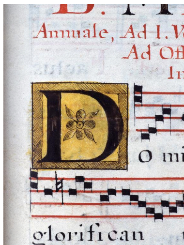
Détail de la page 165 : lettre D enluminée dans un cadre doré IVR22_19966003615XA