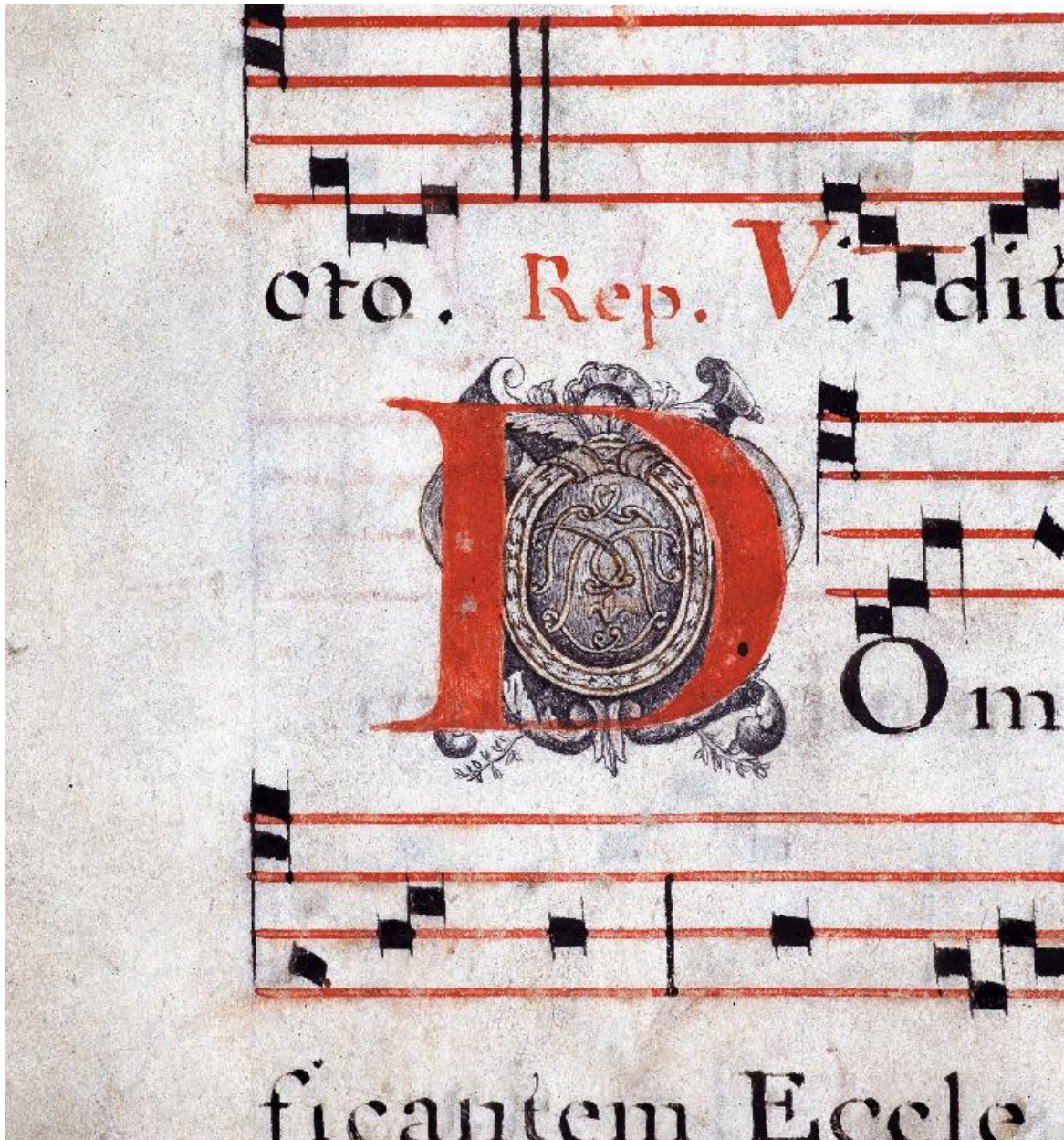
Détail de la page 146 : lettre D avec un cuir enroulé.