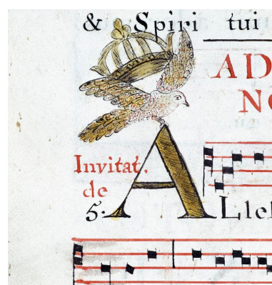
Détail de la page 82 : lettre A enluminée avec une colombe et une couronne.